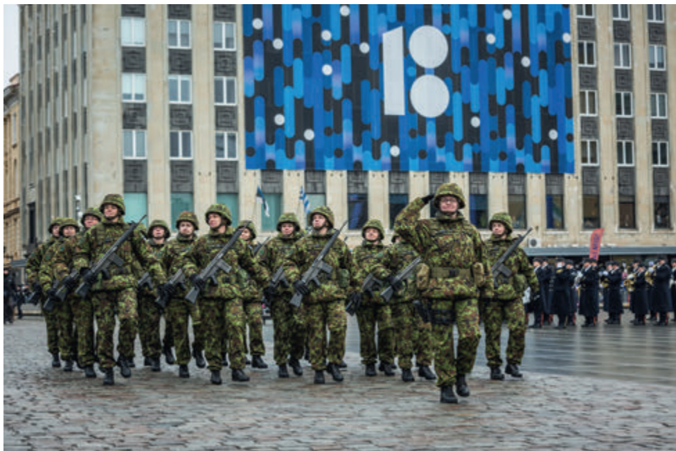
Eesti Vabariigi 101. aastapäeva paraad.

2021. a algusesse planeeritud tänuüritus tuli piirangute tõttu edasi lükata. Nagu paljudes muudes valdkondades tuli siingi loovus valla päästa ning piiratud oludega kohaneda. Nõnda toimus seekordne tänu gala stuudios, kus videopildi ja otseühenduste vahendusel said üritusest osa nii need, kes kohal viibisid kui ka need, kes isolatsiooni tõttu või muudel põhjustel eemal pidid viibima. Kindlasti saame ka sellest kogemusest palju kasulikke nippe, mida edaspidi rakendada ka tavapäraistes oludes.