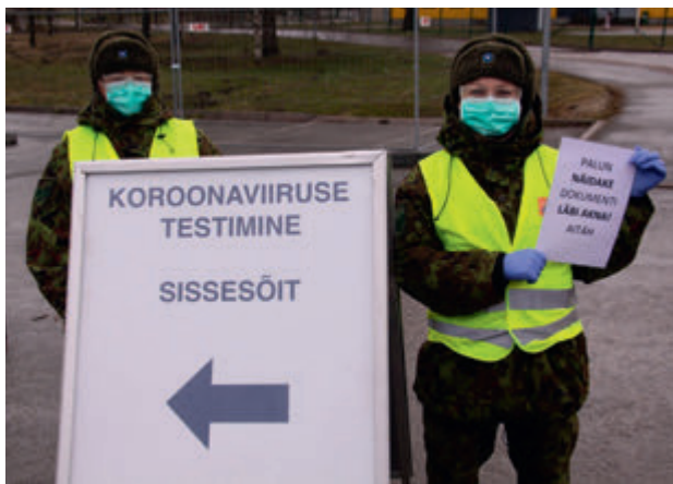
Drive-in testimispunktis (2020).

Sellal kui tervet maailma ja Eestit ehmatas võõras viirus, kui kõik pandi kinni ja lukku, leidsid naiskodukaitsjad võimaluse selles kaoses oma panuse ja abi anda. Käidi Häirekeskuses kriisiabi telefonile vastamas, abistati Tervisametit Tallinnas staabisistentidena, oldi nii Tartus kui Paides drive-in testimispunktis, käidi ka kohalikele omavalitsustele abis, kas siis toidupakkide jagamisel või kaupluste juures jälgimas, et inimesed ennast ja teisi ohtu ei seaks. Hoolimata segastest aegadest näitas naiskodukaitsja, et tema peale saab kindel olla ja tema on valmis oma riiki ja rahvast teenima. Oleme uhked iga meie liikme üle.