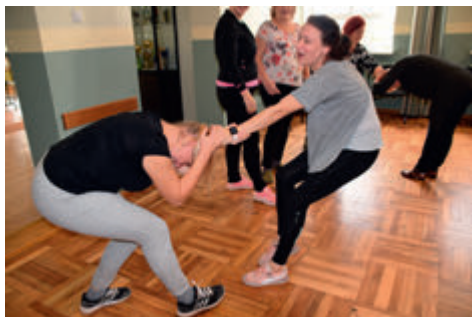
Ohutushoiu kursusel harjutati enesekaiste võtteid. Tegevus käis läbi rõõmu ja lusti.