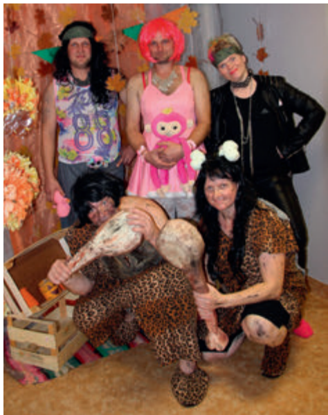
Tõrva ja Tõlliste sünnipäev. Näitetrupp Tõrva jaoskonna ja KL Helme kompanii liikmetest.

2019. a toimus Võidupüha paraad Tartus ja seega oli ka Valga ringkonna naistel võimalus paraadil osaleda. Võidupüha paraadile järgnesid üritused maakon-