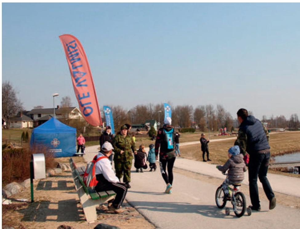
Sinilillejooks 2019.

Sinilille kampaania. Aktiivne müük käest kätte oli võimatu. Propageeriti tellimisi läbi neti ning anti veebikontserte, korraldati joonistusvõistlusi.