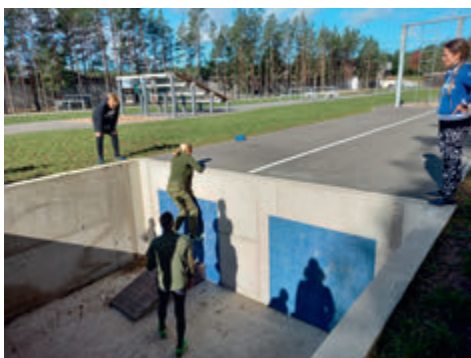
Takistusi ületades. Erialagruppide kompleksõppus 2020