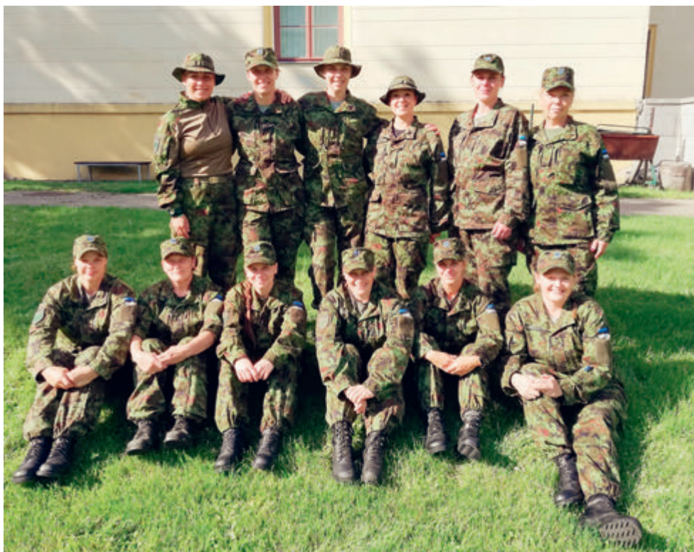
Kolm Rapla ringkonna võistkonda minemas NKK koormusmatkale augustis 2020

peale võistlust siiski üles leiti). Siiski on kõik tahtmist täis, et ikka uuesti ja uuesti koormusmatkale minna ning seetõttu ongi Rapla ringkonnas plaani pidama hakatud, et tuleb enne üle-eestilist koormusmatka maha pidada üks oma ringkonna sisene mõõduvõtmine, mille auhinnaks on pääs Koormusmatkale.