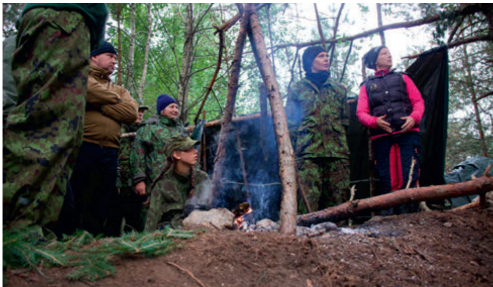
Naiskodukaitsjad osalesid Kaitseliidu üleelamiskursusel, kus tuli hakkama saada nappide vahenditega.