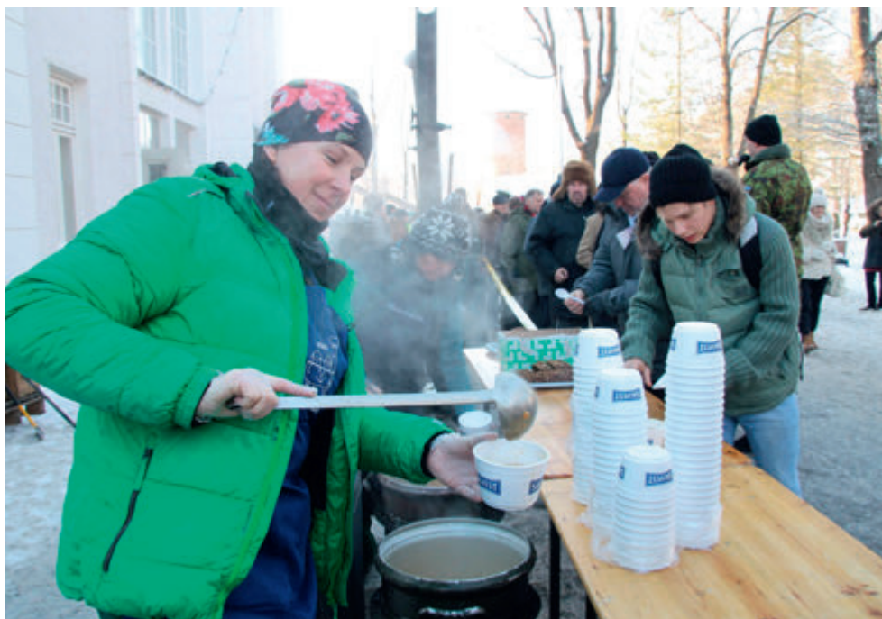
Paju lahingu 100. aastapäev. Supp auramas ja lõhn meelitamas paljusid sööma.