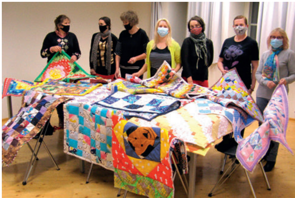
Head mõtted ja soovid õmmeldi tekkidesse ning kingiti Rakvere haigla sünnitusosakonnale.