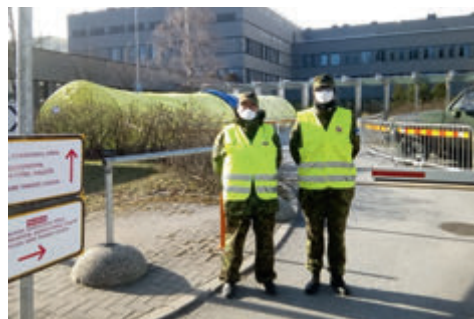
Põhja-Eesti Regionaalhaigla juures oli naiskodukaitsjate ülesanne esmase triaaži tegemine.