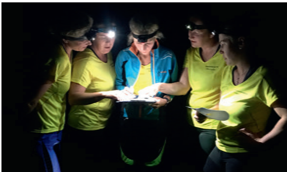
Öös on asju.

kond tõmbas endale loosiga moodustada kultuurigrupist pilt, mis pidi kindlalt olema ülevalt vaates pildistatud ja mis pidi kujutama selle grupi tegemisi. Ja välja tuli selline tore asi!