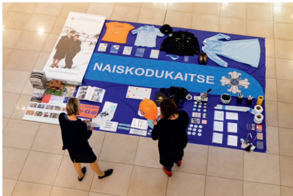
Tetrisse väljakutse sai vastu võetud. Meie ülesandeks oli näidata avalike suhete gruppi.

Orissaare hoovikohvikute päeval tutvustati ka NKK (ajaloohõngulist) pannkoogi-kohvikut. Nagu nimigi ütleb, oli võtmeisikuks pannkook, mis valmis välikatla pannil ja tõi meelde unustamatud pühapäevad vanaemaga. Samuti leidis menüüst valiku soolaste ja magusate küpsetistega. Peale mõnusat vatsatäit oli võimalus lapata meie fotoalbumeid ja saada teada, mida need naised õigupoolest teevad.