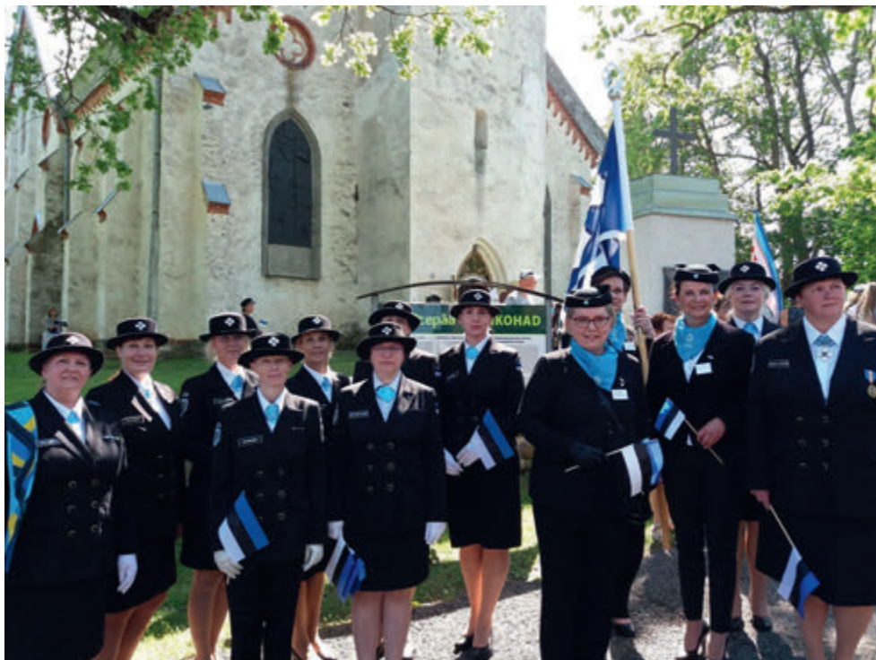
Lipupäev Otepääl 2019 koos Soome naisorganisatsiooniga.

Aasta lõpuks oli Valga ringkonnas 138 liiget, neist 122 tegevliiget ja 16 toetajaliiget. Ka sellel aastal liitus Valga ringkonnaga 6 kodutütart. Valga ringkond koosneb nüüd 5 jaoskonnast ja Valga ringkonnas on 4 meessoost toetajaliiget.