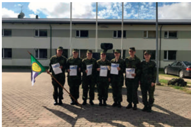
SOK kursus 2020 lõpetajad koos ringkonna instruktoriga.

meile meelde, et TEST1 sooritamine on alles algus ja edaspidi tuleb laskepäevadel ainult harjutada ja harjutada! Harjutati nii tegusalt, et üle pika aja oli meil võimalus nii lahing- kui ka sportrelva võistlusel oma naiskond välja panna.