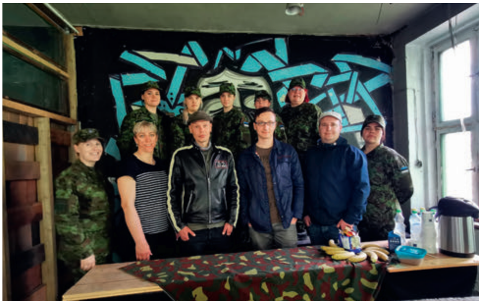
Ole valmis! räpiloo filmimine.