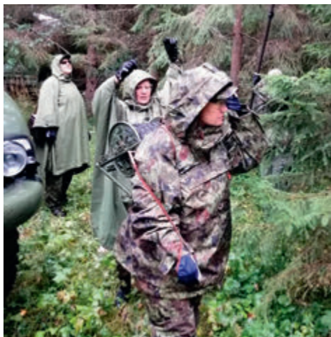
Hakkajate harjukate loodud teenustasuta sideühendus.