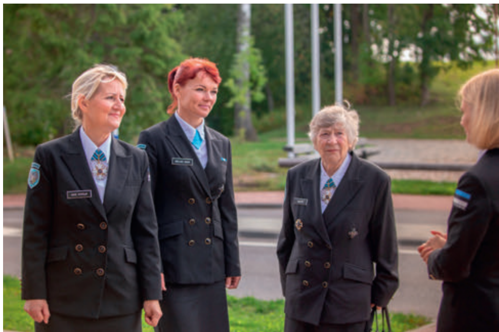
Jõgeva ringkonna staažimärgi saajad.

2020. a anti üle-eestiliselt välja esmakordselt pronksine staažimärk, mõeldes neile liikmetele, kes on oma tegevusega esimese jälje jätnud enam kui 25 aastat tagasi