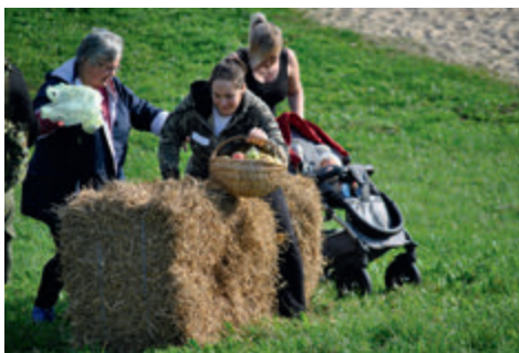
Tule sügist otsima võistlusmatka ülesan- deid lahendavad Padise-Kloostri ja Paldiski jaoskonna naised.