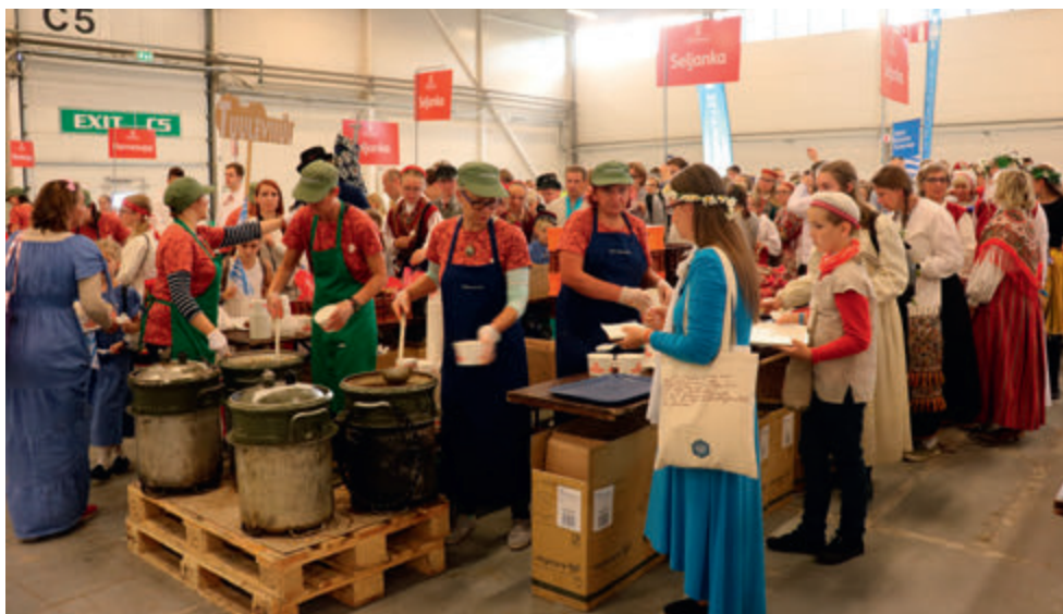
2019. aasta laulupeo tootlustamine.

Välikööki opereerimise, logistika korraldamise, toidujagamise ja mitmete teiste funktsioonide täitmisel oli nädala jooksul ametis 130 naiskodukaitsjat ja kaitseliitlast. Kokku jagati lauljatele, tantsijatele ja muusikutele laiali 61 tonni suppi, mis tähendas 180 000 supiportsjonit.