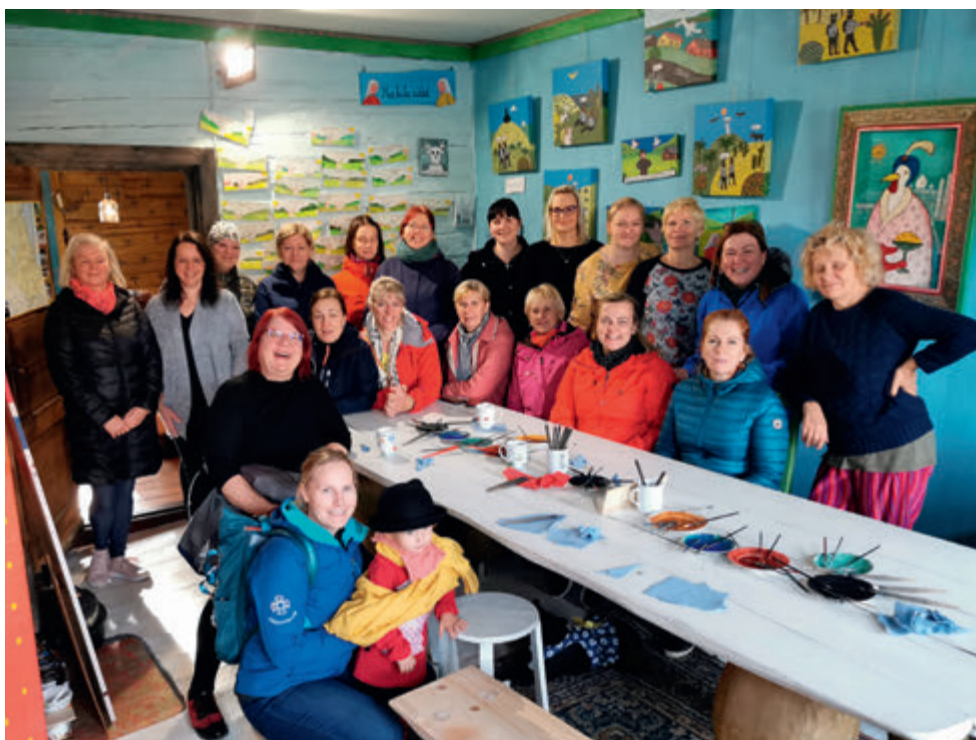
A. Nahkur võõrustab Sakala ringkonda.

aedniku töös olen aastate jooksul kokku puutunud lihtsas vormis igakuiste uudiste edastamisega Lasteaia Teataja näol, mis on kättesaadav kodulehel. Sellest ajendatuna tekkis mõte proovida midagi sarnast ka Sakala ringkonnas teha. 2020. aasta aastaring sai täis ja kvartaalne arhiveerimisväärtusega NKK Sakala Ringkonna Sõnumikandja on nüüdseks neljal korral kodulehele üles riputatud. Luge mine on huvitav ja aastaga on ka uudiste kokku kogumine natuke hoogsamalt kul gema hakanud, aga selle jäävväärtuse selgitamine NKK liikmetele on alles ees. Võib olla Sõnumikandja tuli, et jääda ja edasi areneda, aga võib ka teisiti minna. Igatahes on see 2020. aasta üks toredatest tegudest NKK Sakala ringkonna heaks.