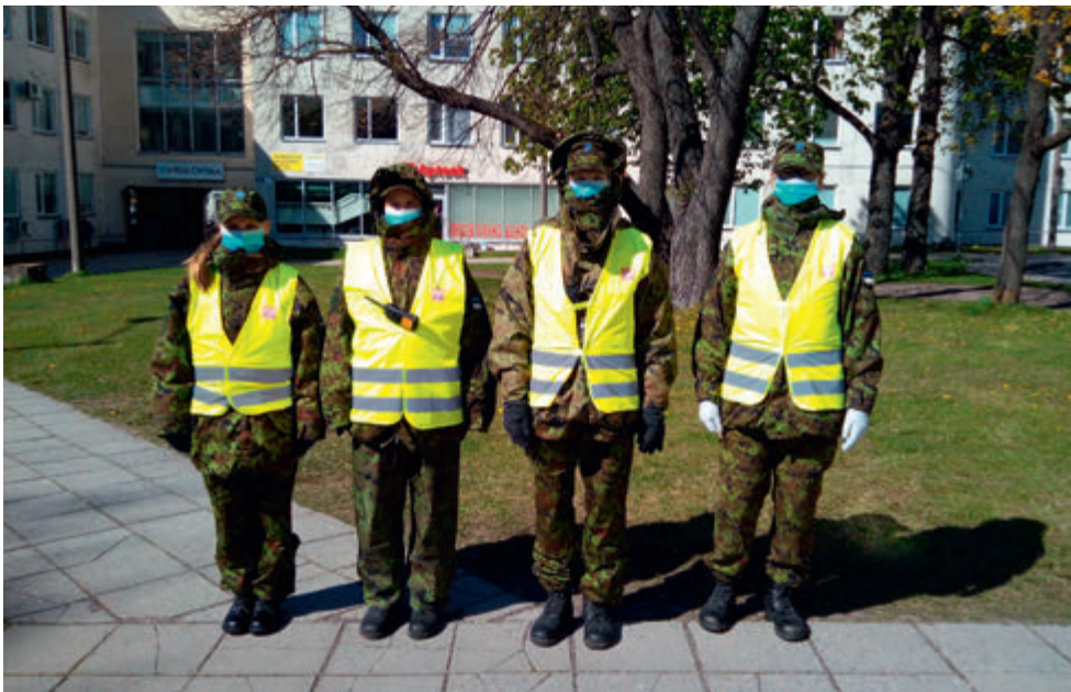
Võitluses COVID 19 vastu Ida-Tallinna keskhaigla juures.

Neile kahele aastale tagasi vaadates tundub, et iga kriis muudab meid tugevamaks, ühtsemaks ja paindlikumaks, ning aitab meid nii eesmärkide püstitamisel kui ka juba olemasolevate eesmärkide ümberseadmisel.