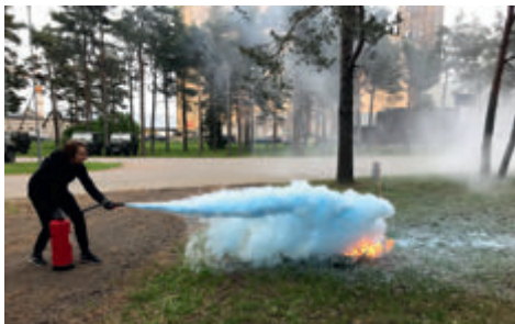
Igaks olukorraks valmis. Ohutushoiu kursus 2019.