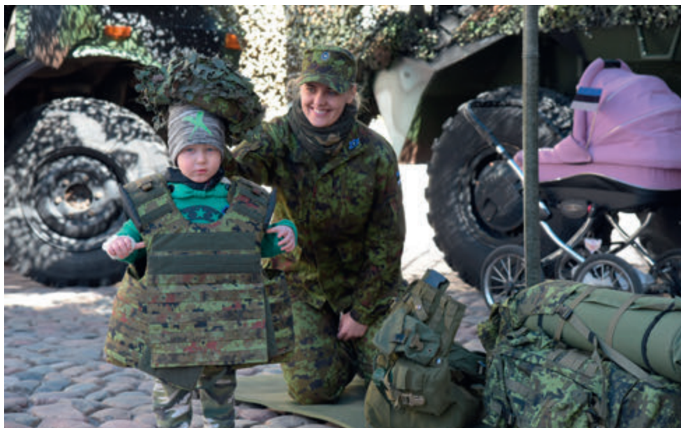
Anname au kampaania avalöök Tartus 2019.a.

Ohutushoiu alased tegevused, sealhulgas mobiilirakenduse tutvustamine toimus 2019. a Tartu linna ja Tartumaa valdade erinevatel üritustel - Anname au avalöögil, Sinilillejooksul, Supilinna päevadel, lastekaitsepäeval, maakaitsepäeval, Tagalaskohvikus, perepäevadel, kriisiteemalisel infoõhtul.