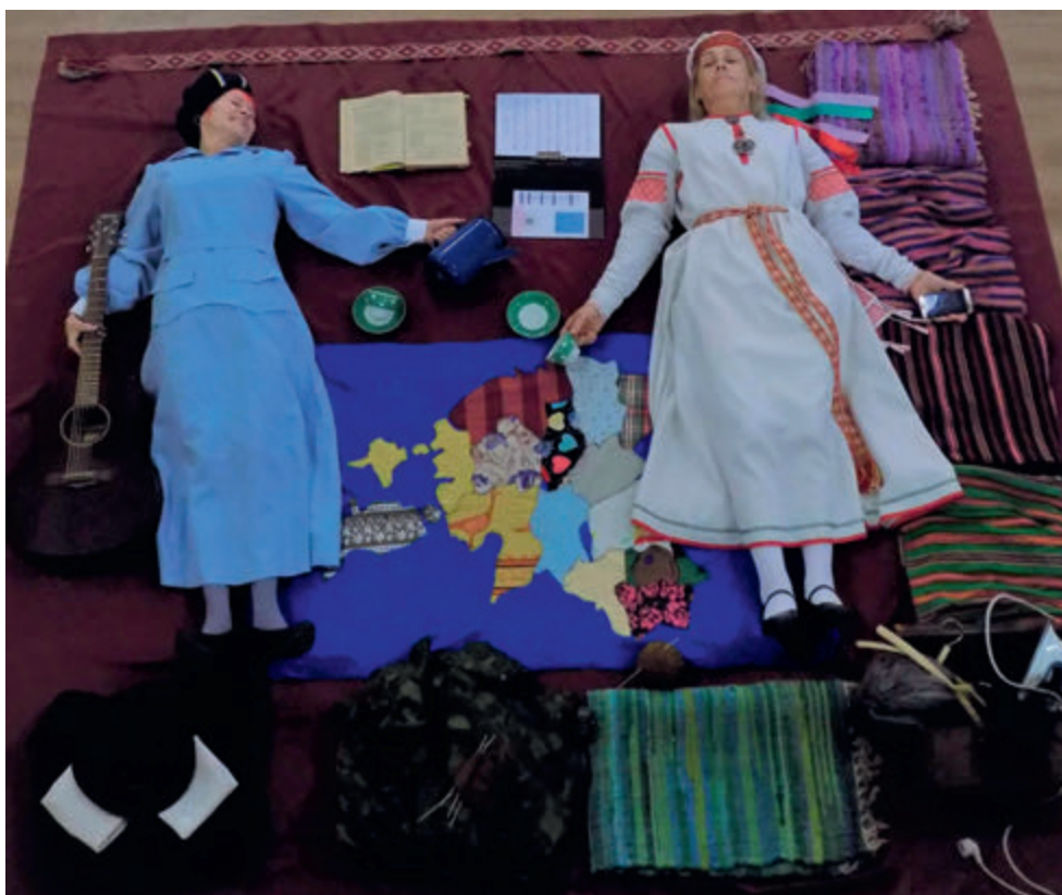
Kultuurigrupi tegemised.

kond tõmbas endale loosiga moodustada kultuurigrupist pilt, mis pidi kindlalt olema ülevalt vaates pildistatud ja mis pidi kujutama selle grupi tegemisi. Ja välja tuli selline tore asi!