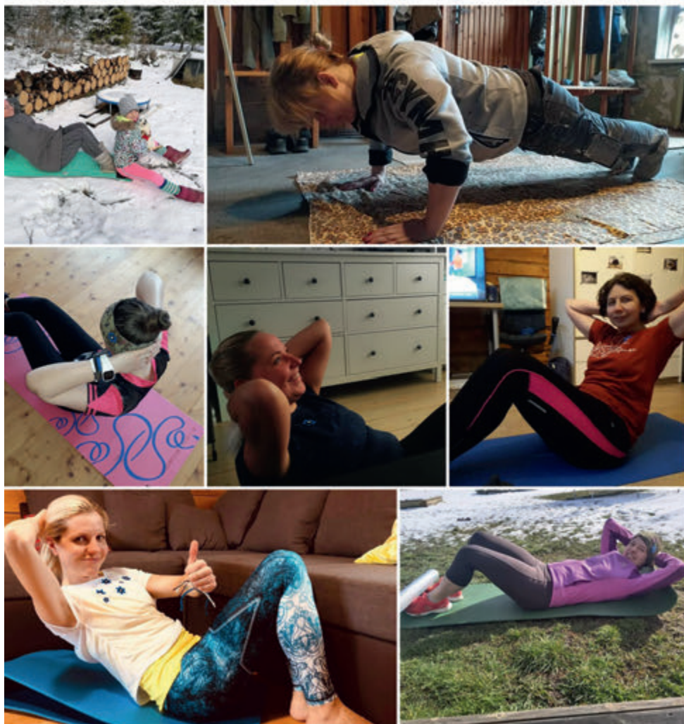
Nissi naised võtsid naerusuiselt vastu veteraniväljakutse.