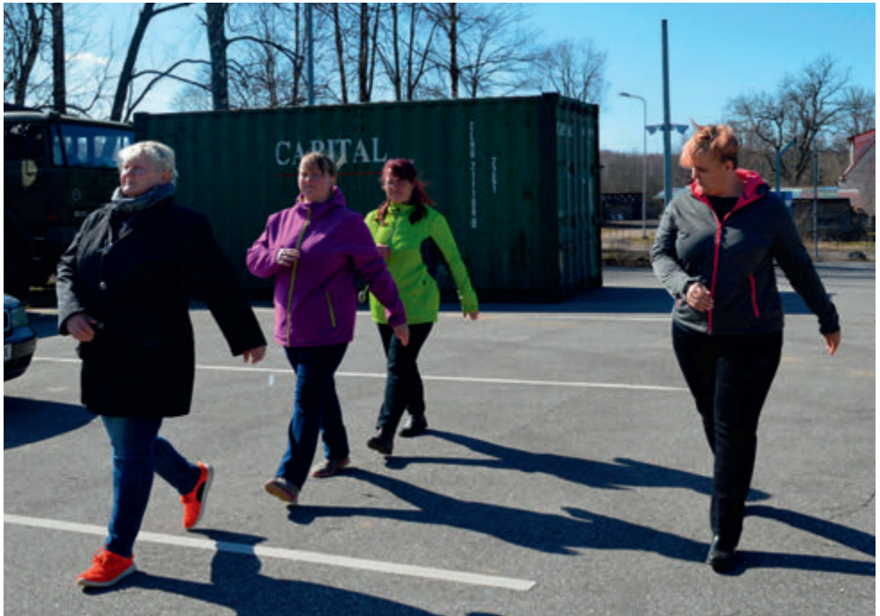
BVÕ organisatsiooniõppe mooduli rividrilli tund.