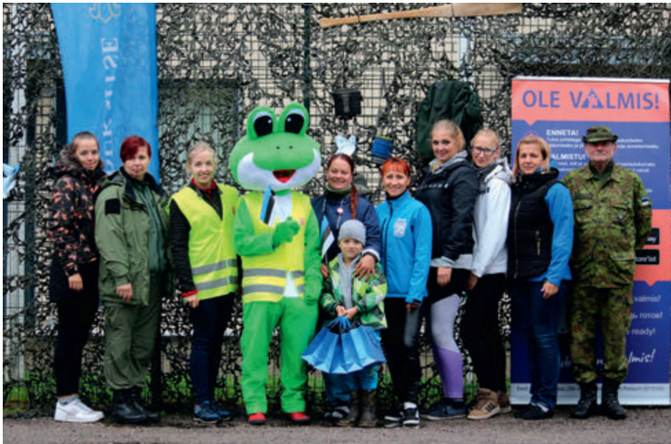
Kogupere seiklusmärg Kärkla Konn.

Hommik algas korraldajatel varakult, oli vaja ju viimased ettevalmistused teha.