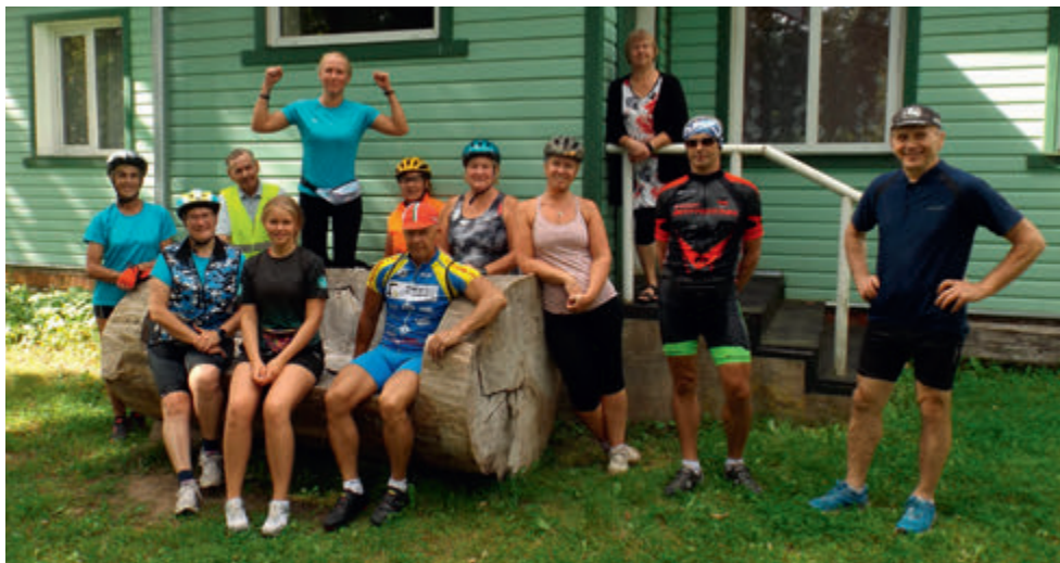
Visnapuu nimeline rattamatk.

mõnigi tähtis otsus. Kõigepealt nimi - nime valikul lähtusime eelkõige loogikast, et Põlva ringkonna kõigi jaoskondade nimed on seotud nende tegutsemispiirkondadega. Esimesena välistasime nime Põlva teine jaoskond vms, sest tahtsime päris oma nime. Lahendus tuli suhteliselt kiiresti, sest meie kaunist Põlvast lookleb läbi armas pisike jõgi nimega Orajõgi, mille kallastel ühel ja teisel pool meie liikmed tegutsevad.