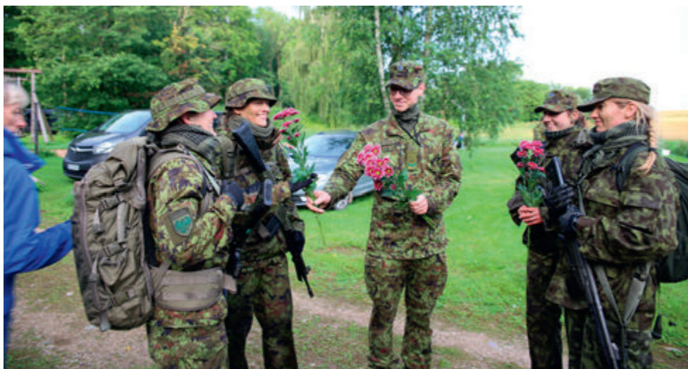
NKK koormusmatka võistkond (2020).

2020. aasta koormusmatka lõpuhetkil oli meie naiskonnale ette valmistanud armsa üllatuse nende võistkonna tugiisik Indrek Etverk - ta tervitas meie naisi finišis lilledega. See väike hetk muutis naiste meeleolu ja tõi naeratuse suule ka pärast koormusmatka läbimist.