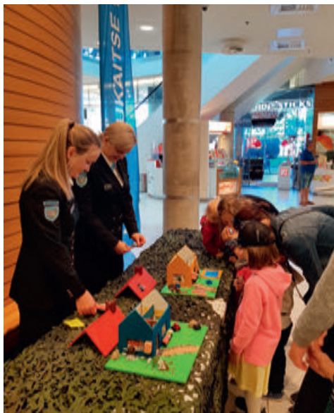
Lastekaitsepäev Tasku keskuses (2019).

sid kõik erialagrupid. Koormusmatk toimus 17.-19. mail. Võistlusel osales 12 võistkonda, nende hulgas ka Tartu esindus.