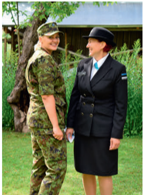
Uus aasta lubadus = olen parimas vormis. Parim vorm - Naiskodukaitse vorm!

2019. a oli Tartu ringkonnal eesõigus korraldada üle-eestiline NKK koorumusmatk, mille korraldamisse panusta-