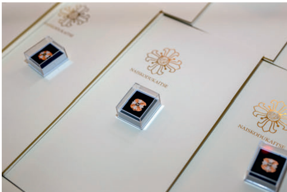
Naiskodukaitse staažimärk.