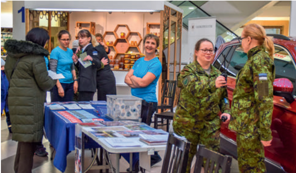
Mis jääb sokkide ja sookolli vahele? Naiskodukaitse organisatsiooni ja tegevuste tutvustamine Pärnus, Port Artur 2 kaubanduskeskuses.