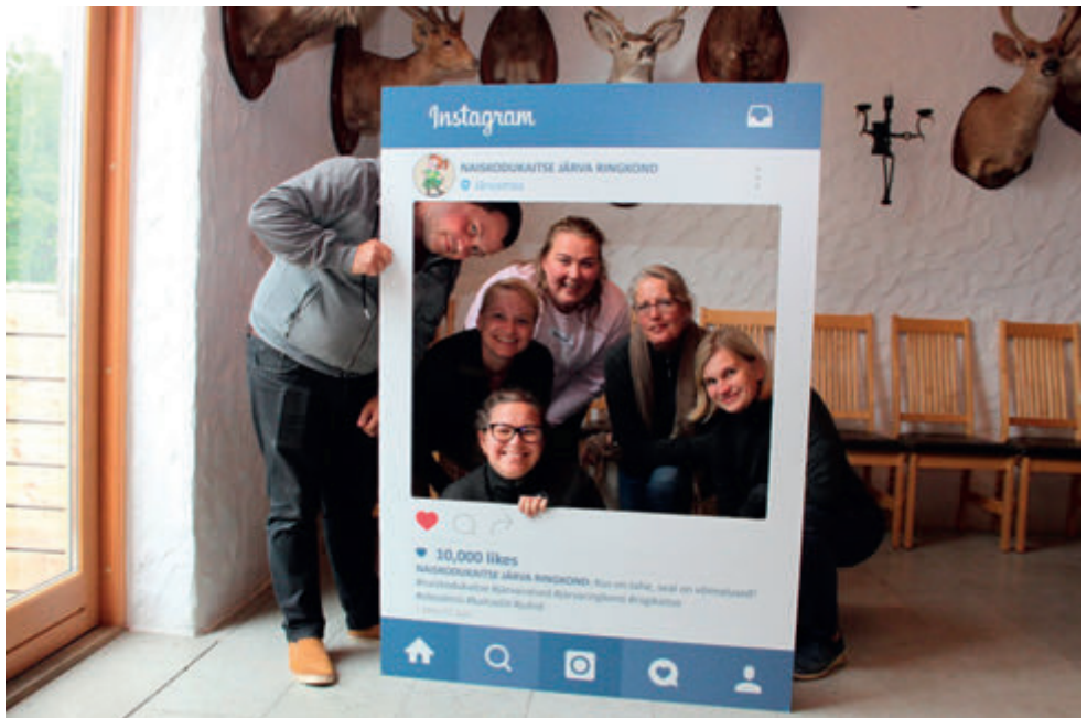
Naiskodukaitse juhtide laagri korraldusmeeskond.