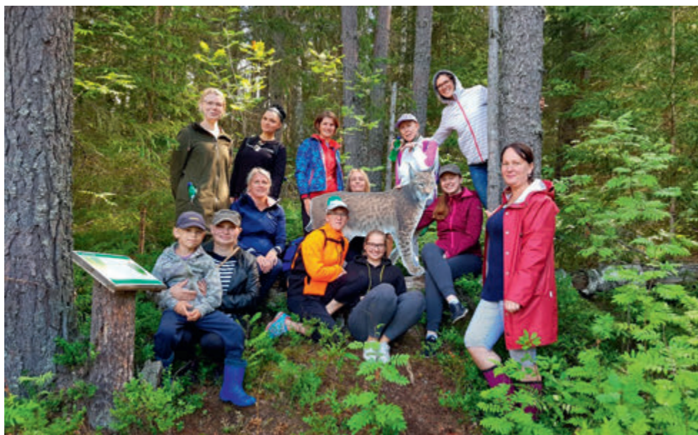
Võrumaa ringkonna juhtide õppepäevad.

2020. a oli samuti plaanis teha samasugune õppepäev praktiliste õpitubadega, kuid seoses koroonaviiruse levikuga tehti viimasel hetkel otsus, et kõigi turvalisuse tagamiseks tehakse õppepäev veebis. Kaasa tegid ka kodutütarde ja