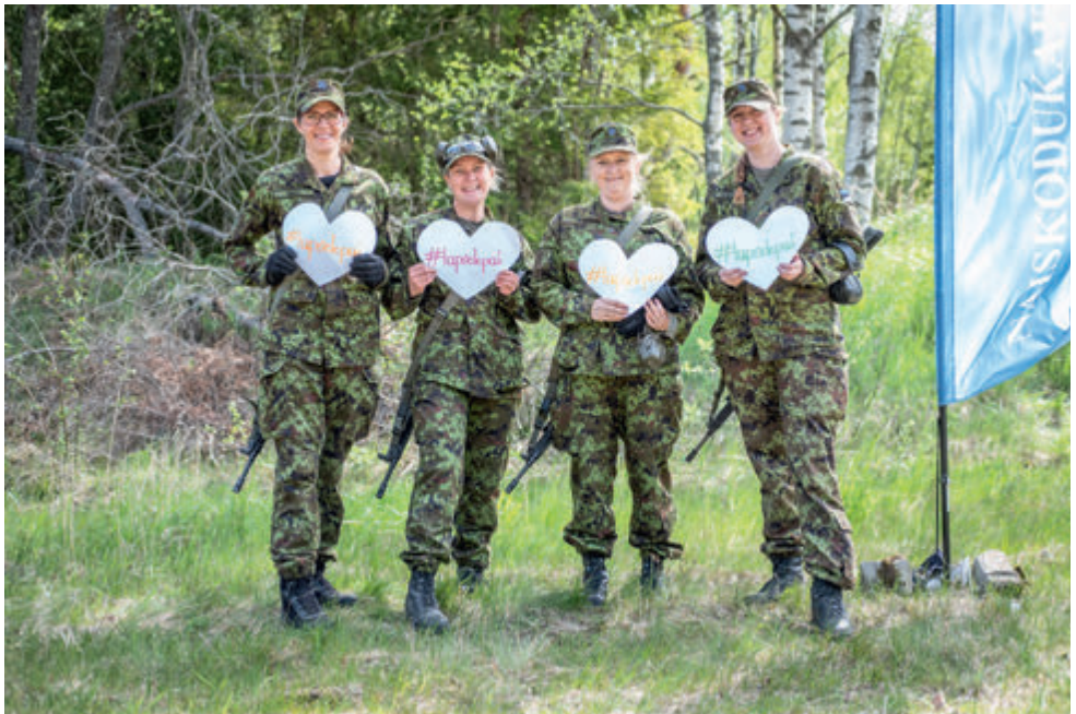
NKK laskevõistlus lahingrelvadest 2020.

Heade tulemustega jätkasid Võrumaa naised 17.-19.05 Naiskodukaitse koor