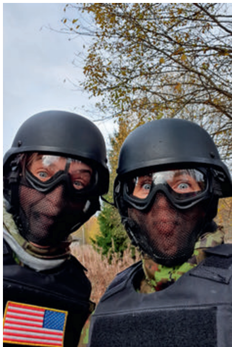
Airsofti lahing lõi naiskodukaitsjate verevemmeldama.