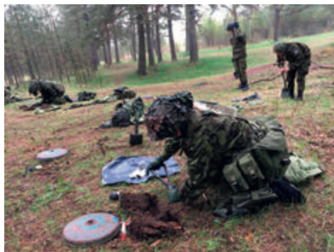
Sõdurioskuste baaskursuselt saadud oskused.

Seitsmel nädalavahetusel omandasid kursuslased erinevaid baasteadmisi sõdurioskustest, et tulevikus edukalt igapäevases teenistuses ja lahinguväljal hakkama saada. Viimane nädalavahetus tõi kaks olulist sündmust: laskeoskuse harjutamine ja testi sooritamine ning pärast seda suunduti otse lasketiirust rännakule. Raja nominaalne pikkus oli 47 km, kuid kujunes nii mõnelegi grupile pikemaks. Rännakul oli vaja läbida vahepunkte, kus hinnati erinevaid teoreetilisi ja praktilisi sooritusi nii individuaalselt, kui ka lahingpaarilisega. Rännakule järgnes KL Lääne maleva pealiku kindel käepigistus ja auga välja teenitud tunnistus SOKi läbimise kohta, kuum saun ja seltskondlik lõbus kokkuvõtete tegemine. Nii mõnigi valus hetk rajal muutus selle kestel hoopis lõbusaks vahejuhtumiks, mida teistega siis jagati.