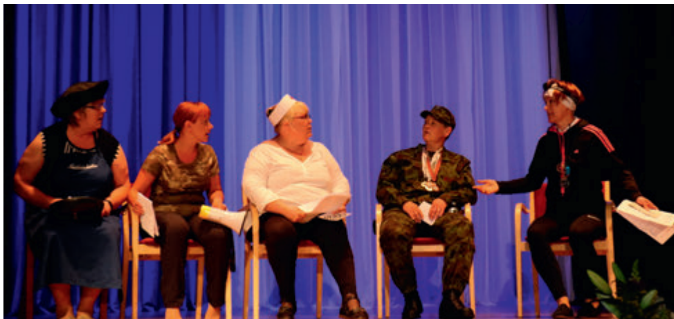
Viru ringkond asutati 10. juunil 1925. aastal. 9. juunil 2019 peeti Väike-Maarja seltsimajas ringkonna sünnipäeva, kus Väike-Maarja naised etendasid meeleoluka näidendi.