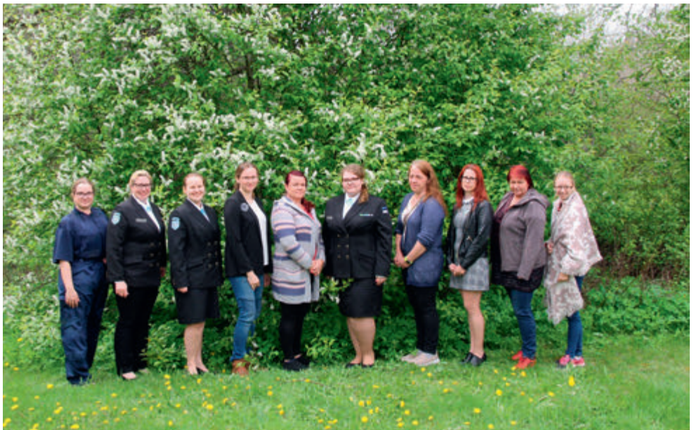
Laanemetsa jaoskonna taasloomine 2020.

2020 oli selles mõttes ka eriline, et suurt Võidupüha paraadi ei toimunud. Selle