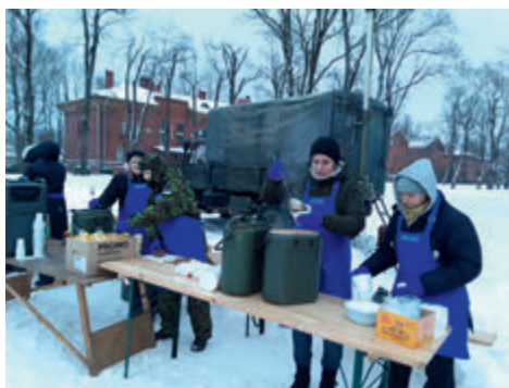
Alutaguse naiskodukaitsjad Utria dessandil.