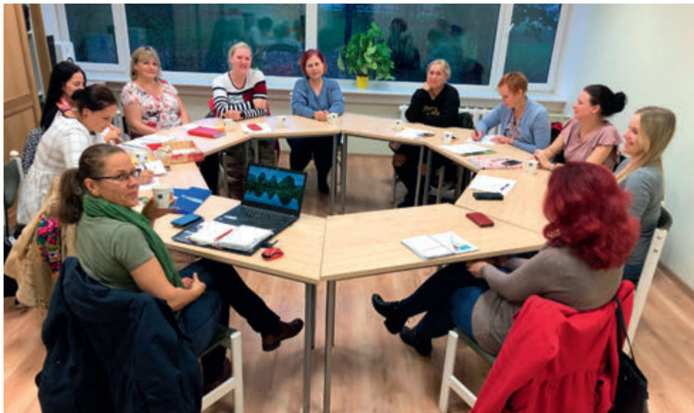
Vända jaoskonna loomine.