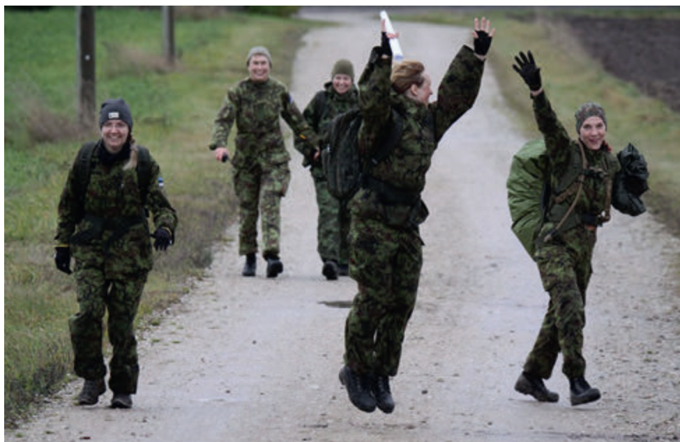
Alutaguse võistkond side ja staabi erialavõistlusel.

Kaitseliidu aastapäeval 2019 tänati neid naisi, kes on tegemistes kaasa löönud vähemalt 15 aastat.