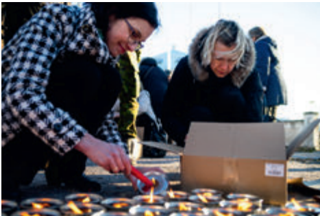
Mäletame! Peame mäletama minevikku, mõistmaks, et Eesti hoidmiseks peame kõik panustama iga päev.