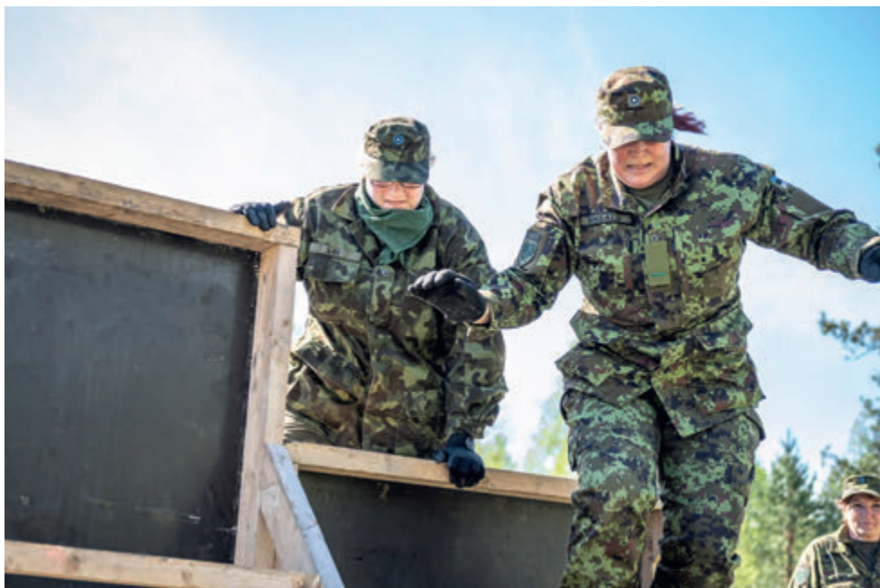
Üle-eestiline laskevõistlus Lääne ringkonna moodi.

jooksul esimesed 10 lasku märklehte A4. Nii mõnelegi osalejale oli selline harjutus esmakordne. Rada oli seatud V tähe kujuliselt. Ühel küljel viis märklehte, teisel sama palju. Igasse lehte pidid osalejad sooritama kaks lasku. Märklehed olid seatud 100-150 meetri kaugusele.