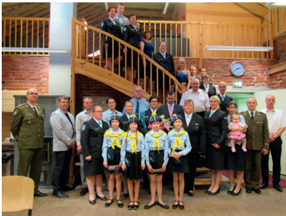
Pärnumaa ringkonna taastamise 26. aastapäeva tähistati Tihemetsas Kikepera malevkonna majas. See maja on sageli ka Saarde jaoskonna kasutuses.