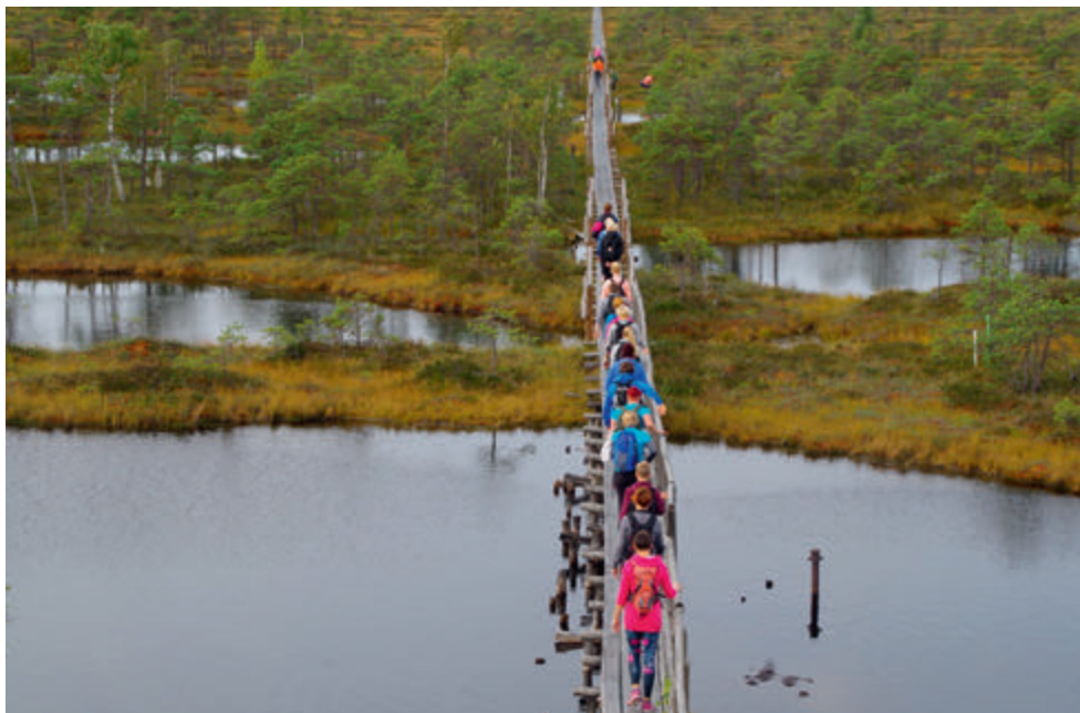
Endla rabamatk.