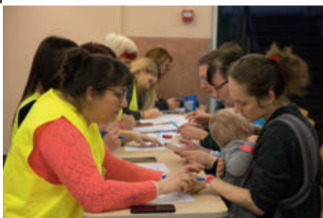
Evakuatsiooniõppusel saab osaleda ka koos väikese lappesega.