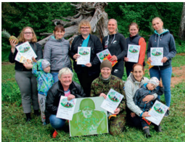
NKK pehme laskevõistlus "Täpne Mutt". Nii vähe ongi rõõmuks vaja.

Valga ringkond ühines üle Eesti korraldatavate BVÕ online -õppe moodulitega. Nii said läbi viidud organisatsiooni moodul ja ohutushoiu moodul. Ohutushoiu mooduli puhul lepidi kokku, et parematel aegadel tuleb läbi viia kindlasti kontaktõppena füüsilise enesekaitse ja tuleohutuse osa. Eriolukord kehtis riigis 17. maini. Peale seda hakkasid piirangud vähenema ja värskes õhus tohtis juba korraldada üritusi ja õppeid.