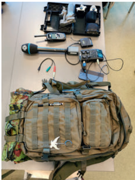
Rindereporteri varustusekott.

Tuleb tõdeda, et juba esimesest koostumisest oli tunda, et teha tahtmist oli õhus piisavalt ja ideedest puudu ei olnud. Hoog oli sisse lükatud ja koormusmatka planeerimine oli peagi üks osa meie argielust. Tuleb tõdeda, et veidi raskendas meie planeerimist riigis valitsenud eriolukord ja sellest tulenevalt ka toimumise kuupäeva muutus, aga raskused on ületamiseks ja saime ka selle situatsiooniga kenasti hakkama. Koormusmatkale registreerus 16 võistkonda 14 ringkonnast. Koormusmatka läbiviimisse oli kaasatud 93 inimest, kellest naiskodukaitsjaid oli 46. Kuna rada sai maastikult väga raske - soine ja rägastikuline, siis põhirõhu panime toetavate kohtunike ja põnevate kontrollpunktide peale. Tagasisidelehti lugedes õnnestus see meil päris hästi: "Mina tundsin igal sammul, et olete ürituse teinud