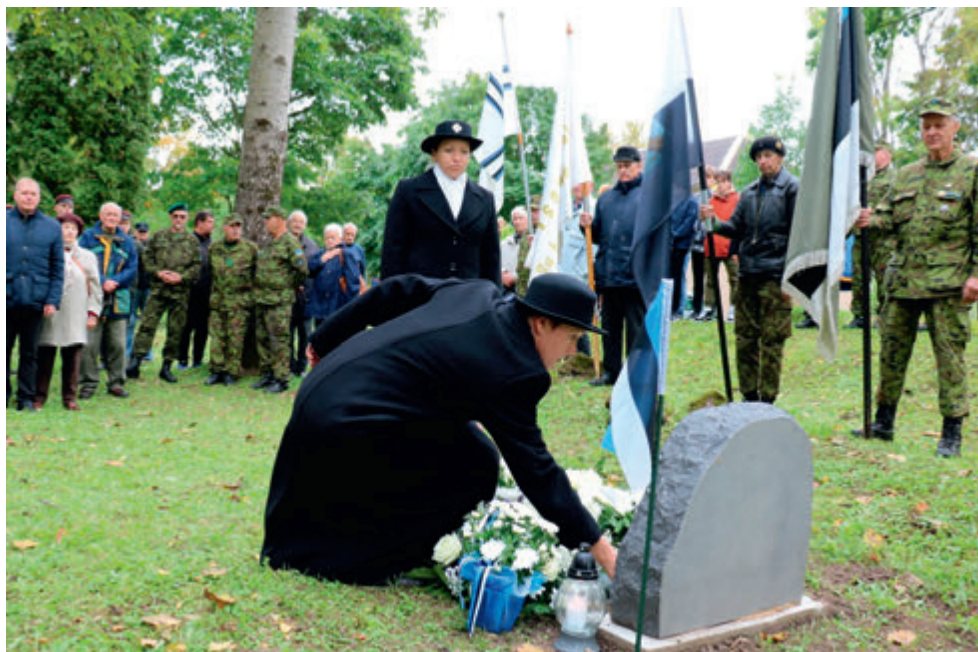
Väike-Maarja naiskodukaitsjad mälestamas Porkuni lahingus langenuid Väike-Maarja suru- nuaias, kus avati langenutele mälestustahvel.

aegse abi eest äärmiselt tänulikud. Naiskodukaitsjad reageerisid kõikvõimalikele abipalvete kriisi haldamiseks. Panustati Rakvere haigla välitriaažitelgis ja EMOs, lisaks suunati inimesi Toidupanga ning Politsei- ja Päästeameti järjekorras. Lisaks on Väike-Maarja naised panustanud aktiivselt COVID-19 tingitud eriolukorrast tulenevate reeglite täitmise kontrollimisse ja teinud hulga patrullitunde oma vallas – ikka selleks, et me terved püsiks ja mõtlematu käitumise tagajärjel nähtamatu vaenlase küüsi ei langeks.