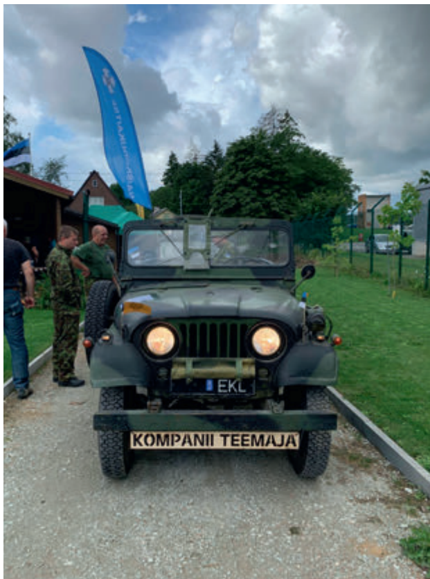
Saue mobiilne Kompanii teemaja.