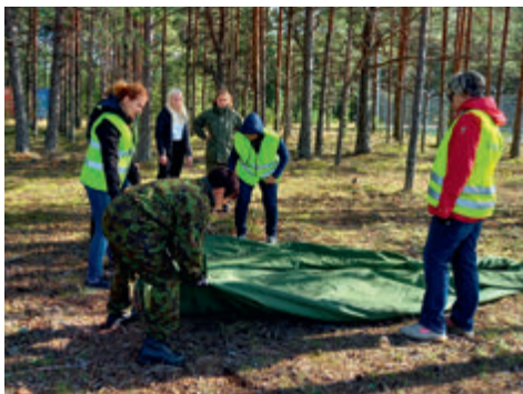
Noored juhendamas erialagruppide kompleksõppusel 2020.