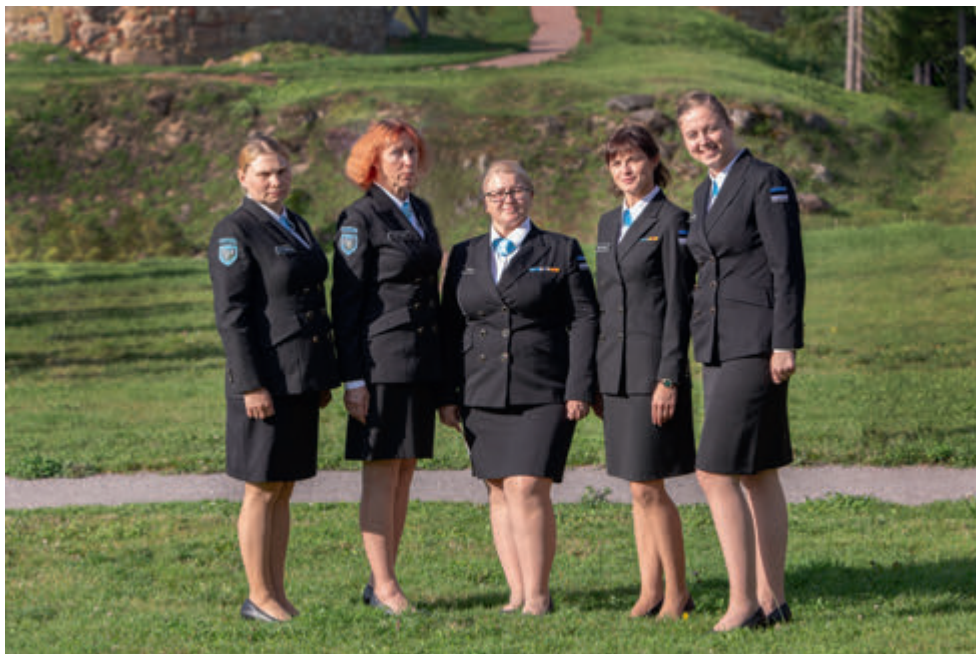
Võru naised Naiskodukaitse aastapäeval.

edasi ja käisime paljudel üritustel. Talve saabudes pidime vastu seisma järjekordsele viirusesse nakatunute lainele. Oma üritustel pidime jälle arvestama maskide ja vahekauguste hoidmisega.