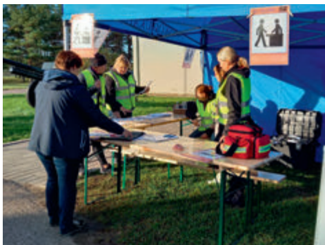
Evakuatsioonigrupp töö. Erialagruppide kompleksõppus 2020