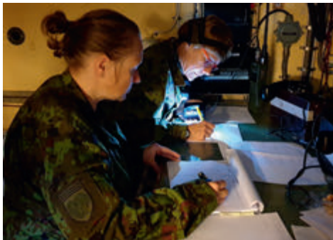
Teadmisi praktikasse rakendamas.