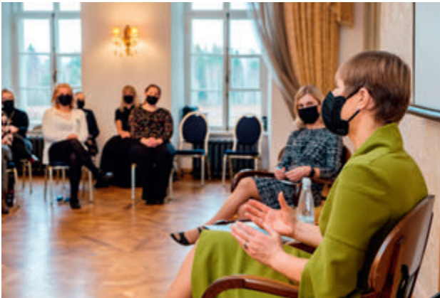
President Kersti Kaljulaid Naiskodukaitse juhtide õppepäeval.

2019. ja 2020. aasta töid Naiskodukaitse väljaõppes kaasa märkimisväärse arenguhüppe ja seda just digiõppe valdkonnas. 2019. aasta algul kinnitati ümberhindamise käigus suure muutuse läbi elanud Naiskodukaitse baasväljaõppe õppekava. Iga moodul koosneb nüüd digiõppe- ja lähiõppeosast. Digiõppe osad on loodud või loomisel ka suuremal osal erialakursustest.