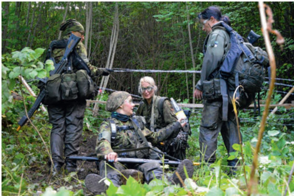
Sügistorm 2020.

Naised panustasid seitsmesse väljaõppe nädalavahetusse oma vaba aja, mille nad muidu oleks võinud veeta hoopis koos perega või mingil muul moel, aga mitte ennast ületades ja väsinuna pühapäeval kodus "haavu lakkudes" ja sealjuures mõeldes, et homme on esmaspäev, miks ma seda teen?! Aga nad osalesid ja tegid seda hästi!!