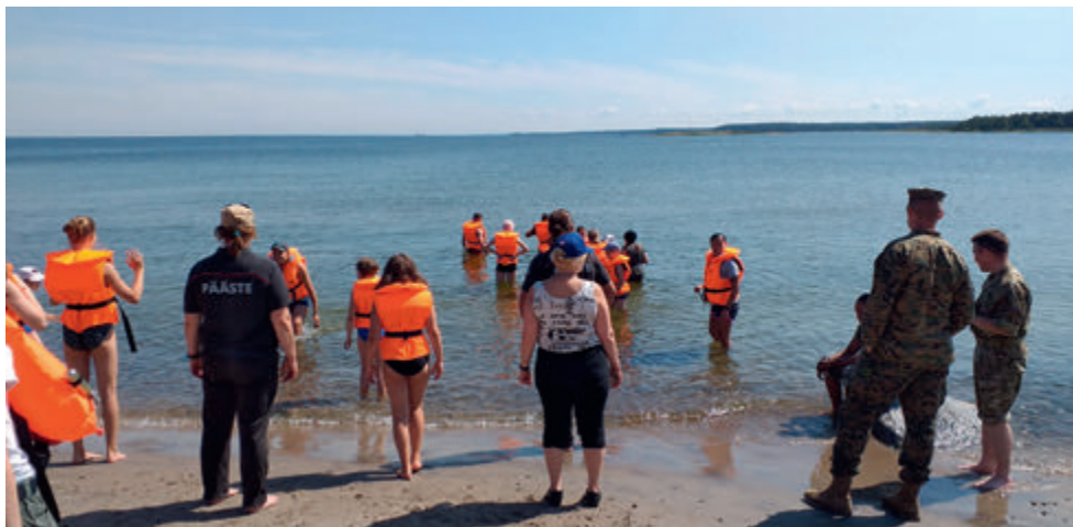
NKK ja KT veeohutusõppus koos liitlasvägedega 2019. aastal.

kuna suurem osa üksustest formeerivad ennast ise. Formeerimisalaseid väljaõppeid ringkond ise ei ole korraldanud, kuid näha on, et suurematel Põhja maakaitseringkonna õppustel on meie naiste abi alati vaja olnud erinevate personalialaste ülesannete täitmise osas.