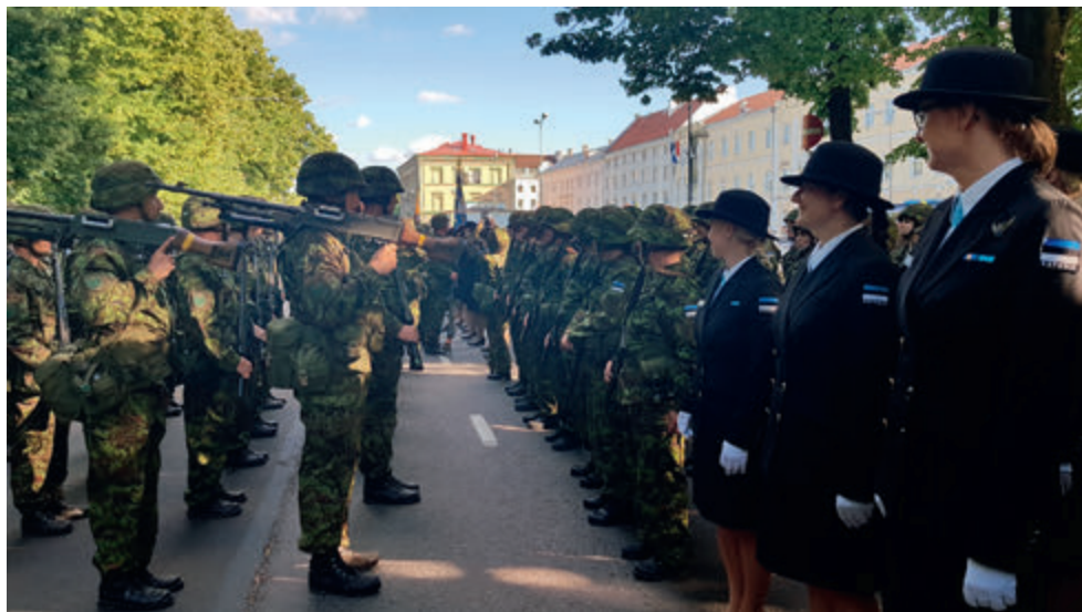
2019. a Võidupüha paraad Tartus.