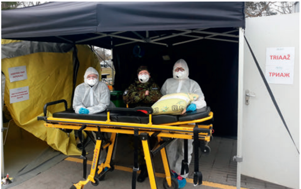
Naiskodukaitsjad teostasid Rakvere haigla EMO juures eeltriaaži, mis hõlbus patsientide suunamist õigesse tsooni.

2020. aasta jõulupühade eel tegid hakkajad naiskodukaitsjad Rakvere haigla sünnitusosakonnale südamliku kingituse: õmblesid 24 lapitekki, mille sisse mähkida haiglas vastsündinud ilmakodanikud. Igaüks neist oli ise mustri ja motiividega,