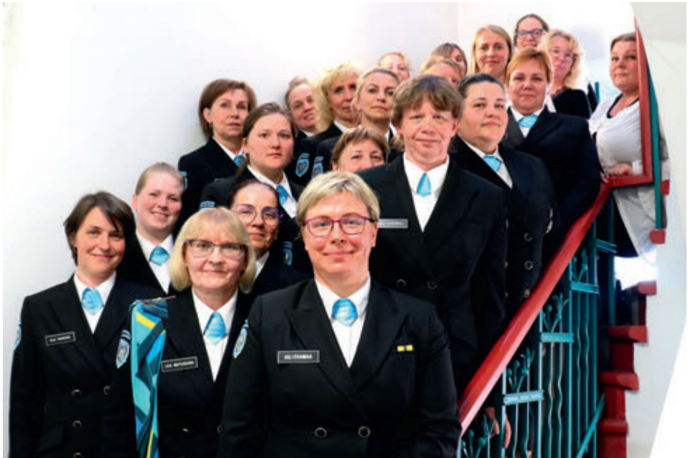
Heade vabatahtlike juhtide ja aktiivsete liikmete koostöös on ringkonnas sisse lülitanud viies käik. Fotol 2020. aasta ringkonnakogu.

Viru ringkonna jaoks on aastad 2019 ja 2020 kulgenud proovile pannes ja eesmärke täites. Saavutatud on töövõite ja loodud süsteemne juhtimine. Kogetud on põnevaid elamusi ja korraldatud eriilmelisi sündmusi. Eriliseks on teinud need aastanumbrid keeruline koroonaviirushaiguse pandeemia. Aegade kiuste oleme suutnud säilitada positiivse meele ning heade vabatahtlike juhtide ja aktiivsete liikmete koostöös sisse lülitanud viienda käigu.