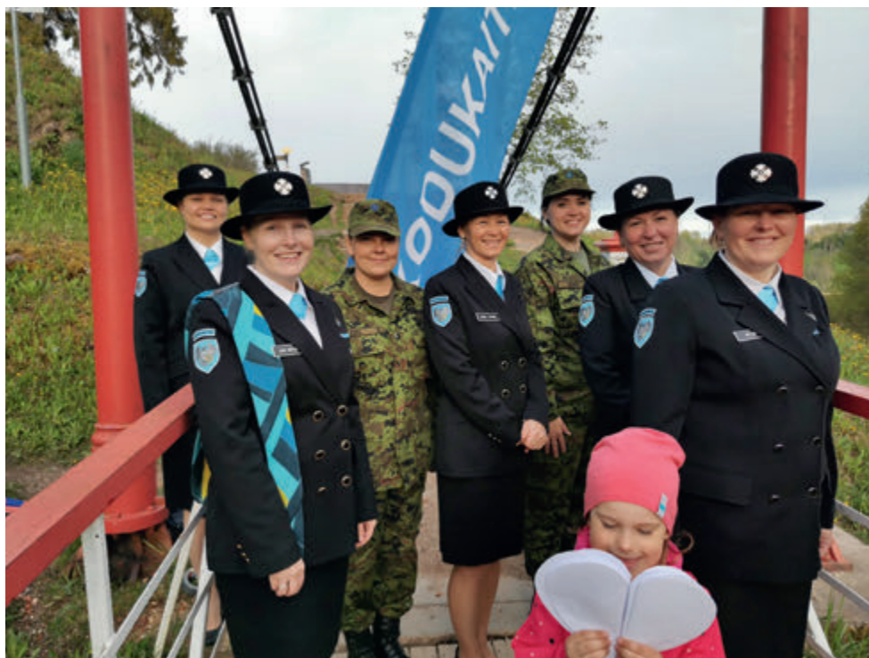
"Lapsele pai" klipi filmimine Viljandi lossimägedes.

EvakRs saab õppida ja omandada oskusi, mida on kindlasti vaja ka väljaspool NKK tegemisi. Oluline on olla koostöövalmis, võimeline kiiresti reageerima erinevates keerulistes situatsioonides, olla avatud ja panna esikohale teiste vajadused. Oskus jääda keerulistel aegadel rahulikuks, pakkuda tuge ja mõelda enda ninatsast kaugemale, on just see, mida praegune aeg meilt kõigilt nõuab. Ja muidugi arendab selline koostöö mõtlemist, et miski pole võimatu. Ära mõtle, miks sa ei saa midagi teha või ei sobi millekski, vaid mõtle, et teeme selle asja ära, uurime, vaatame, mõtleme koos välja lahenduse. Just koos tegutsemine ja lahenduste leidmine ongi see, mis mind võlub.