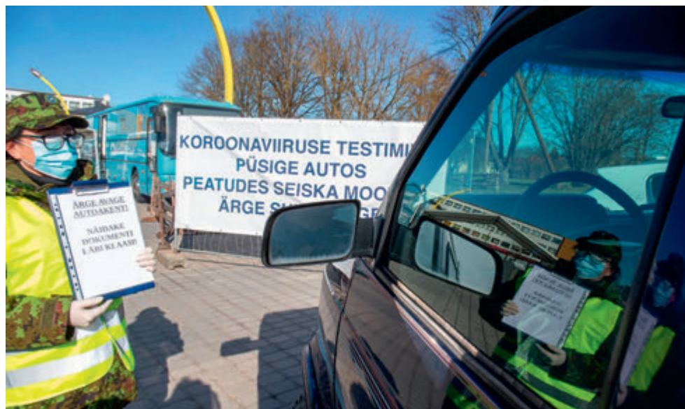
Tervisebuss Viljandis.

Eelnevat olime teinud ajakirjanduses ning valdade kodulehtedel kohalikule elanikkonnale teavitustööd koormusmatka toimumisest. Relvadega naised päeval ja öösel metsas ei ole just igapäevane nähtus ja kohates neid juhuslikult metsas võib hirmutunne kiiresti tekkida. Matka eelõhtul sõitsime läbi kõik kontrollpunktid, tutvusime rajaga ning ülesannetega. Pidasime plaani teha sotsiaalmeedias arvukalt live-ülekandeid, etteruttavalt võib öelda, et plaanideks see jäigi ja seda äärmiselt halva internetilevi pärast. Vahest see oligi hea, tegime pilte ja videoid, mis said sotsiaalmeediasse paisatud esimesel võimalusel, siis kui viimane võistkond oli kontrollpunkti läbinud. Olime oma kaameratega igas punktis kohal, jääd-