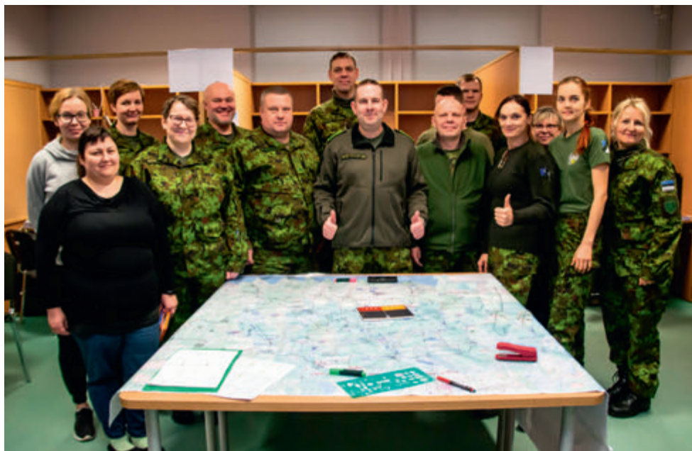
Maakaitseringkonna õppus Terav ora.

Kahe aasta jooksul on toimunud kõige rohkem õppusi just EvakR liikmetele, et paika panna nende tööülesanded ja koostoimimine. Jõgeva ringkonna EvakR on osalenud õppusel Põhjakonn, juhtide väljaõppel kui ka teinud praktilisi harjutusi maakondlikult.