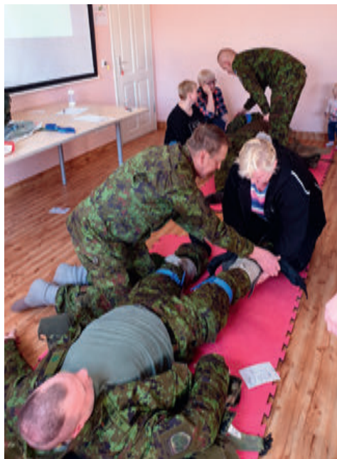
Lahingmeditsiini õppepäev 2019.

tus võeti rahva poolt väga hästi vastu, siis on plaan ka edaspidi selliseid toredaid tantsuõhtuid teha.