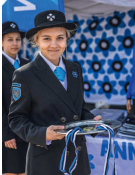
Esinemisoskus oli abiks näiteks tutvustades meie tegemisi ja äppi Ole valmis! noortele Narvas toimunud inspiratsioonipäeval ja Anname au kampaania raames Jõhvis toimunud Tõnissoni perepäeval.