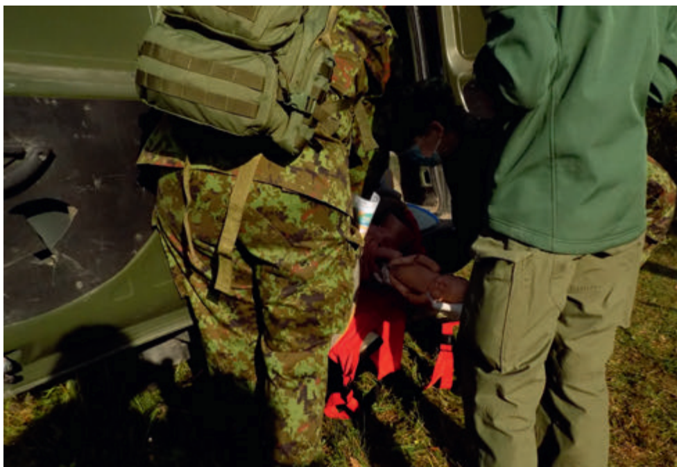
Sünnitaja metsas.