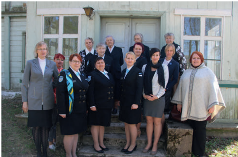
Mälestuspäev Kursi kirikus (2019).

Väga positiivseks tulemuseks loeme ka 2020. a lahingrelvadega laskevõistluselt saadud 6. kohta, koormusmatkalt toodud 5. kohta, esmaabi võistlustelt saadud 7. kohta ja välitoitlustuse võistluse 4. kohta, mis andsid hea hoo ja motivatsiooni edasiseks harjutamiseks ja veel paremate tulemuste poole püüdlemiseks. Lisaks