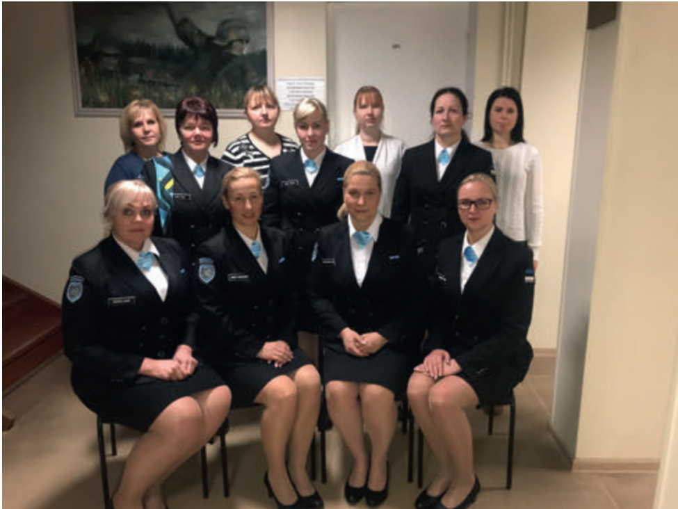
Orajõe jaoskonna asutamine.

2020. aastat võib pidada eriliseks, sellest sai Põlva ringkonna jaoks märgiline aasta, sest Põlva jaoskonna liikmetest moodustati pisike uus jaoskond – Orajõe jaoskond.