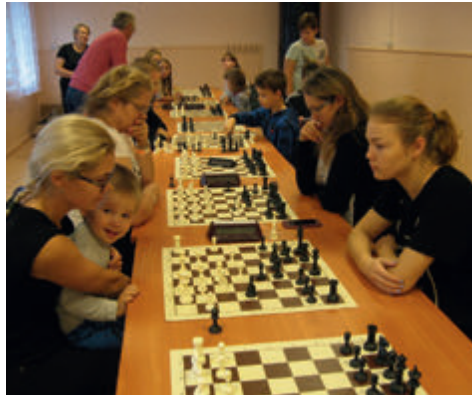
Maleõppe Soodomal.