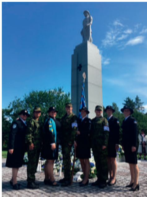
Petseri Vabadussõja monumendi avamine.

koolieelikutele. Projekti raames tutvustatakse koolieelikutele erinevaid oskusi ja teadmisi, mida nad siis kooli minnes võiksid teada. Naiskodukaitse tutvustas esimesel osalusaastal koduseid varusid ning teisel aastal rääkisime evakuatsiooni-varudest.