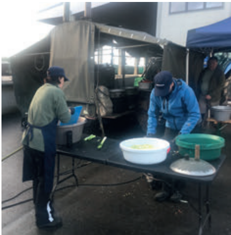
Kriisireguleerimise harjutusõppus HOTSPOT Koidulas.