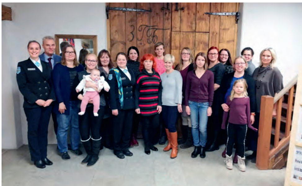
Rapla ringkonna Kohila jaoskond sündis 3. detsembril 2018.

õppusele läheb, on vaatamata vähesele naiskodukaitsjate hulgale struktuuris kõik vajalikud kohad naiste poolt ajutiselt õppuse ajaks täidetud. Üksused saavad toidetud, side peetud ja staabid assisteeritud, miski pole siiani tegemata jäänud.