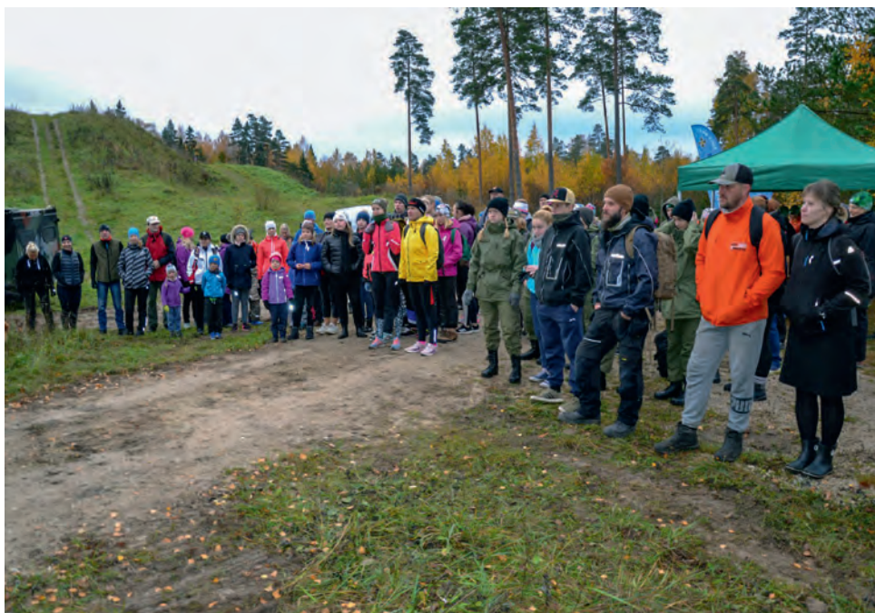
Märjamaa Mäger tõi kokku palju matkahuvilisi.

Ollakse ikka seda meelt, et võistkond tuleb igale poole välja panna. Tähtis on osavõtt. Kambavaim ja teotahe on need, millel on kaalu rohkem kui soolateral.