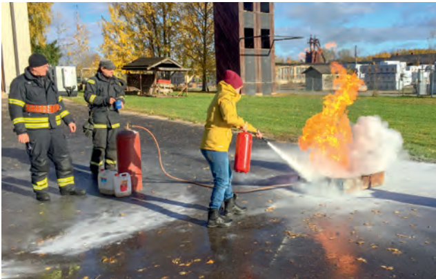
Ohutushoiu kursus.

Tänapäeva keerulises ja kiires maailmas tuleb mõelda ka sellele, et mis saab siis, kui juhtub mingi massirahutus või loodusõnnetus. Kuidas me siis käitume? Nendele küsimustele saab vastuse ohutushoiu mooduli läbimisel, kus muude kasulike õpetussõnade kõrval saavad kõik osalised selgeks ka põhilisemad enesekaitsevõtted. "Siil 2018" raames panime