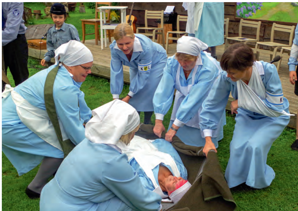
Stseen näidendist “Minu kohus”.