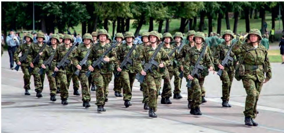
Võidupüha paraad Tallinnas.