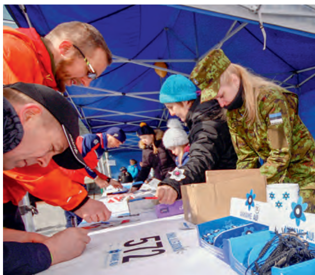
Anname Au! raames toimunud Sinilillejooksul sai ringkond uue kogemuse võrra rikkamaks, aidates jooksu korraldajaid.

Kogukonda ja heategevusse panustas ringkond erinevate ürituste korraldamisega ja osavõtuga. Korraliku hoo on sisse saanud Eesti Kaitseväge ja Kaitseliidu veterane toetav kampaania "Anname Au!". Pärnumaal on saanud traditsiooniks, et kampaania avanädalal kutsub NKK külla oma missioonidest raamatu kirjutanud veterani, kes räägib läbielatud ja sealsetest oludest. 2018. a toimus aga Pärnus ka Sinilillejooks, mis tunnustab tervislikke eluviise ja austab neid, kes on käinud rahvusvahelistel operatsioonidel meie julgeoleku eest seismas. Jooksul osalesid nais-