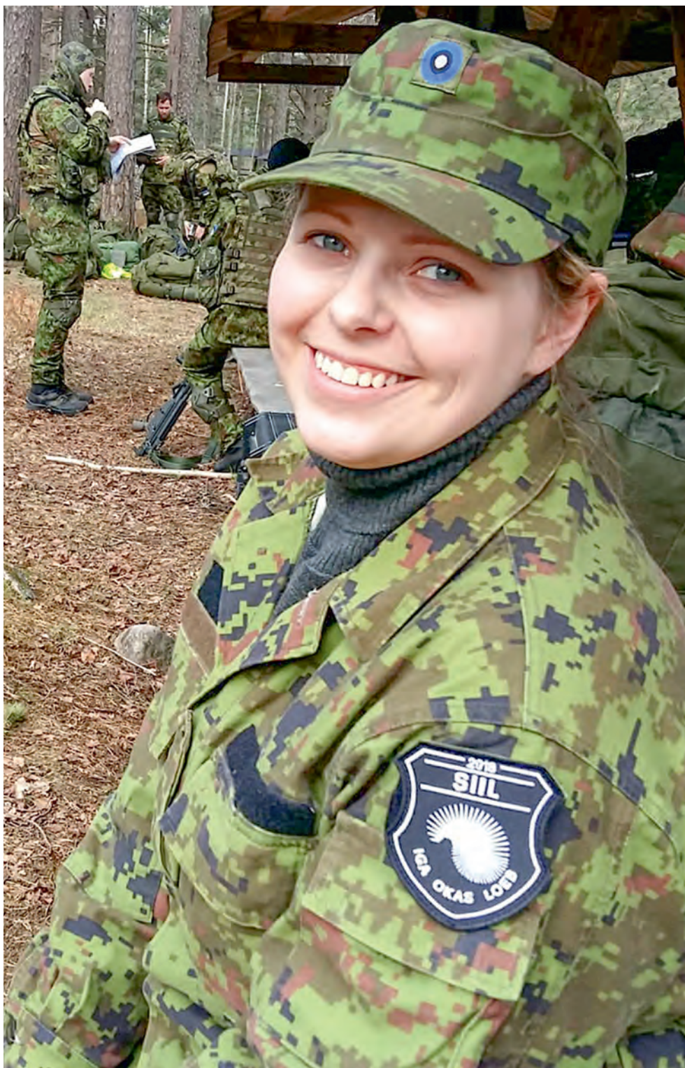
Suurõppus Siil 2018.