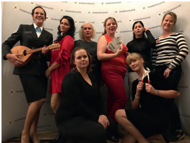
Võrumaa ringkonna laulunaised Võrumaa ringkonna 90.aastapäeval.

põnevaks kohaks oli Suure Munamäe torn. Pisikesele vahekorruusele fotode paigutamine oli küll omaette kunst ja mõttetööd nõudev, kuid lõpptulemus oli pilkupüüdev. Meile endalegi suureks üllatuseks läks meie näituse jutt ka Võrumaa peale oma rada kõndima ning meiega võttis ühendust Rõuge lasteaiad, kes ise palus meie fotonäituse oma majja. See oligi näituse viimane ning meelde jääv lõpetus. Näitus oli iga kuu erinevas paigas.”