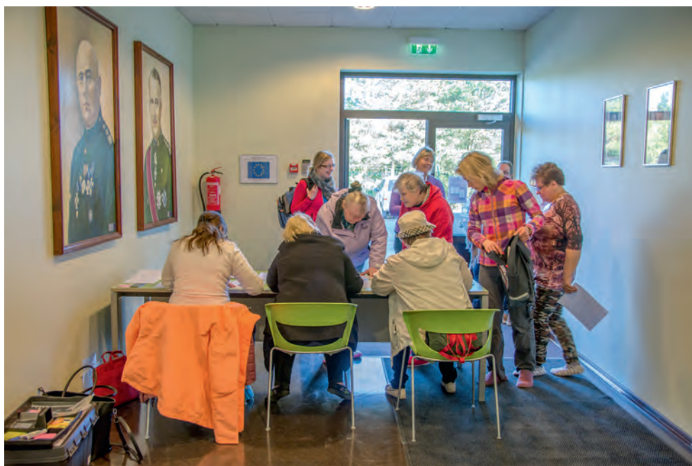
Evakuatsioonipunkt suurõppusel SIIL 2018.

Tundub, et sõjaaja struktuuri kohtade täitmise puhul kehtib ütlus: “Algul ei saa vedama, pärast ei saa pidama.” Siin on veel tunda teatavat saarlaslikku alalhoidlikkust ja pelgust uue suhtes, s.t peljatakse võtta vastutust ja kirjutada avaldus kuhugi ametikohale kuulumise kohta. Ent algus on siiski juba tehtud. Hetkel on naised panustamas formeerimises ning sisekaitsekompaniis. Veidi vähe on naisi veel üksuste juures, kuid loodetavasti evakuatsioonimeeskondade tulekuga leiab rohkem meie ringkonna naisi endale ametikoha. Suurõppusel Siil panustas meie naisi tervelt 122 ehk osalusprotsent oli 85,31.