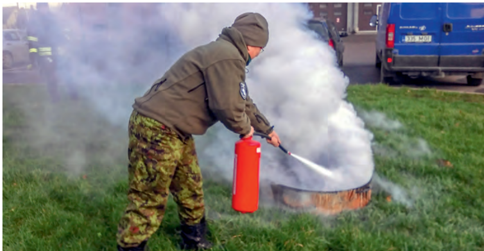
Ohutushoiu baasväljajõppe praktiline osa.

Ohutushoiu teema on NKKs päevakorral ning annab tegevustele sisu ja mahtu.