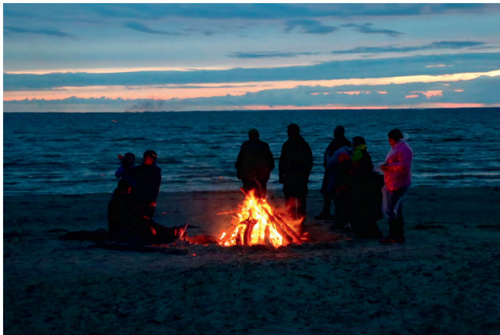
Pärnu jaoskonna rattaretk lõppes muinastule süütamisega.