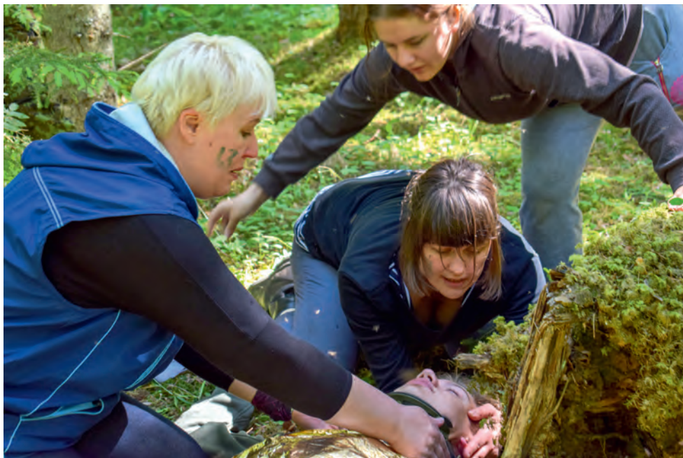
Esmaabi erialavõistlus. Haavatud noorkotkas.