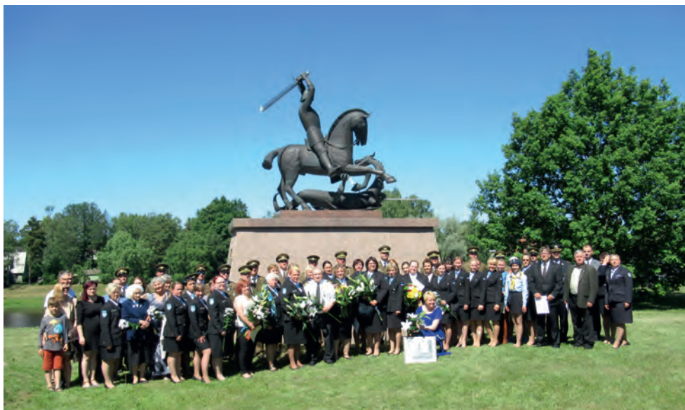
25 aasta möödumist ringkonna taastamisest tähistati Toris Eesti Sõjameeste mälestuskirikus.