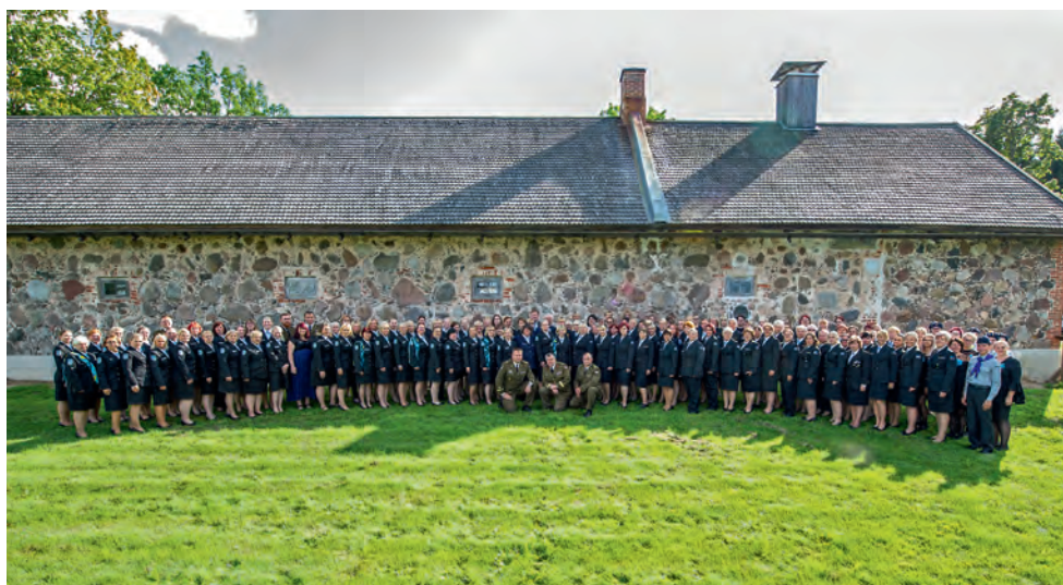
NKK 91. aastapäeva tähistamine Põlvamaal.

Revisjonikomisjon: Jaanika Sild, Silja Oss, Kristi Vanatalo