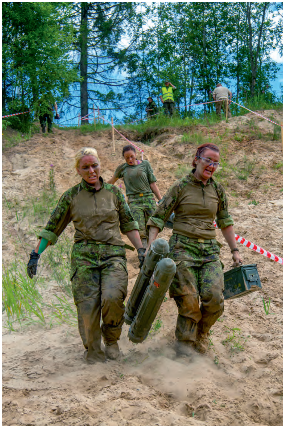
Naiskodukaitse Rapla ringkonna võistkond Pitka 2017 luurevõistlusel