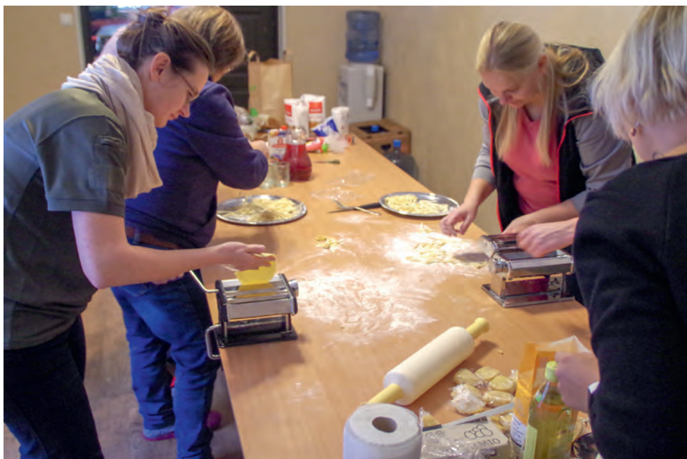
Käsitööpäeval Tormas pastat tegemas. 2018.