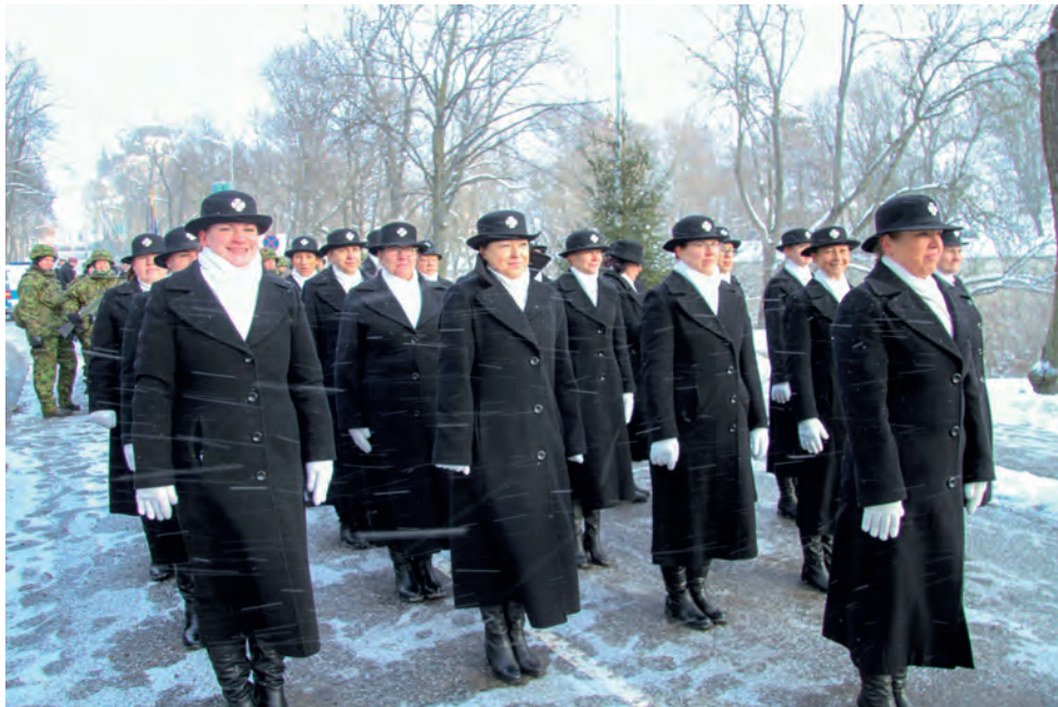
EV 100 Kaitsejõudude paraadil tuuli trotsides.

Traditsioone austades korraldatakse igal aastal jüripäeva paiku NKK mälestuspäev, mida on juba mitmendat aastat eest vedanud Toompea jaoskond. 2017. a korraldas mälestuspäeva Muusika jaoskond, siis istutati hukatud organisatsioonikaaslaste mälestuseks Plangu territooriumile õunapuu. 2018. a tutvuti Toompea ja Põhja jaoskonna eestvedamisel koos Ajaloomuuseumis Eesti Vabariigi 100. sünnipäevaks avatud näitusega "Minu vaba riik", mis avab meie riigi ajaloo temale omases nii keerulises ja huvipakkavas võtmes.