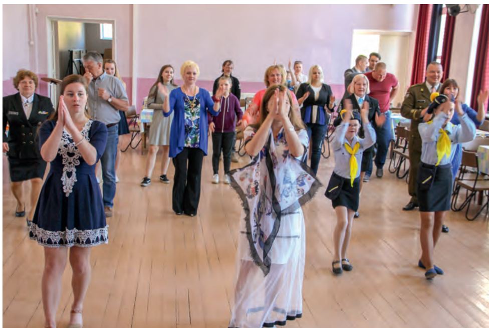
Valga ringkonna naiskodukaitsjad ja kodutütared tähistavad koos külarahvaga 2017. aasta emadepäeva.

misega. Iga võistkond võttis ühest karbist võistkonnale mõeldud kaardi, kus oli pilt ja pildil oli kujutatud asukoht, mille pidi lähiümbrusest üles leidma. Kui olid õiges kohas, leidsid sealt küsimuse või ülesande, mille peale pidid liikuma alguspunkti tagasi ja selle koos meeskonnaga sooritama. Ülesanneteks oli kolmekesi ühis- tel suuskadel suusatamine, “soo ületamine” väikestel plaatidel, küsimustele vas- tamine ja nõõrist maakaarti joonistamine.“