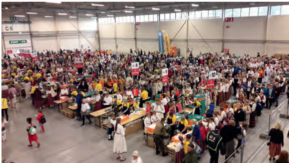
Naiskodukaitsse vastutas noorte laulu- ja tantsupeo tootlustuse eest.