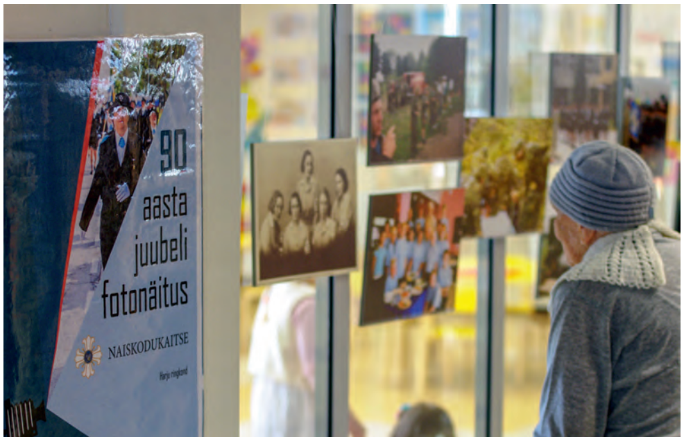
NKK 90. aasta juubeli fotonäituse avamine Keilas 2017. aastal.

Noortejuhtidena tegelevad naiskodukaitsjad aktiivselt Jüri, Keila, Kiili, Kolga, Kose, Kuusalu, Saue ja Viimsi rühmades andes nii vajaliku panuse, et meil järelkasvu oleks.