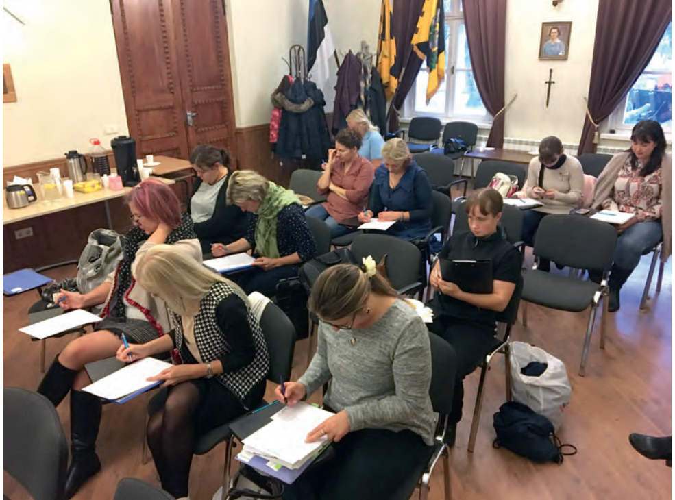
Naiskodukaitse Lääne piirkonna avalike suhete täiendõppe Pärnumaa maleva saalis.

erialagrupi selle järgi, et täiendõppe järel leida amet mõne üksuse juures staabiasistendina, välikokana, meditsiini, teavituse või tsiviil-militaarkoostöö (CIMIC) vallas.