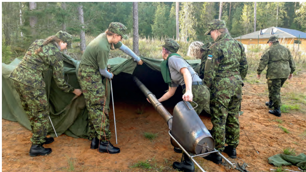
Valga ringkonna naiskodukaitsjad sõdurioskuste baaskursusel 2017. a septembris.

Meie naiskodukaitsjaid leiab igast Valgamaa Kodutütarde ja Noorte Kotkaste laagritest või muudelt sündmustelt. Valga ringkonnas on paljusid tublisid tegevliikmeid, kes veavad aktiivselt mõnda noorte tegutsevat rühma, lisaks on meie tegevliikmed abis noorte üritustel tegevuspunkte läbi viies või toitlustamas. Samuti on noorteorganisatsiooni liikmed oodatud NKK BVÕ moodulitele, kus nad saavad häid teadmisi tublidelt instruktoritelt. Nii on vanematel kodutütardel üleminekul Naiskodukaitsesse lihtsam sisse elada.