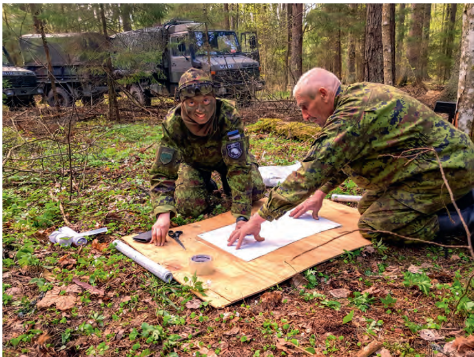
Kokk/sidemees/staabiassistent kolm ühes õppusel Siil.

Võrumaa ringkond on just 2017.-2018. a hakanud tihedat koostööd tegema malevaga erinevate ürituste toituldamisel. Kui varasematel aastatel toitulustas ringkond peamiselt väljapoole organisatsiooni, siis 2017/2018 on toitulustatud hulganisti ka KL Võrumaa maleva väljaõppeüritusi, samuti on aidatud kuivtoidupakkide pakkimisega. Enim koostööd tehakse MPPa-ga, kellega naised on käinud kaasas toitulustamas isegi Sirgalas.