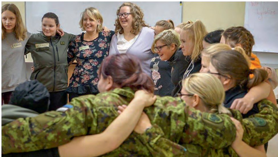
Kodutütred ja naiskodukaitsjad õlg-õla kõrval.

male ja anda neile aimu, millega me ikkagi täpsemalt tegeleme. Kindlasti plaanime antud ettevõtmist lähiaastatel korrata.