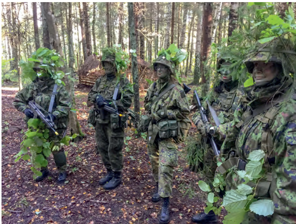
Leia pildilt naised. Sõduribaaskursus 2018.

Juba kolmas nädalavahetus toimus metsas. Hommikul saime üksteisele "kena meigi" teha ning siis kaeviku kaevata ja öö sealsamas telkmantli all veeta. Neljandal nädalavahetusel toimus meil väike matk. Anti erinevate punktide koordinaadid ning me pidime koos lahingpaarilisega kõik punktid üles leidma. Väga palju oli hästi üles ehitatud ülesandeid, mis pakkusid põnevust, uusi teadmisi ja ka nalja. Näiteks oli väga naljakas olla pimedas meetrikõrguse rohu sees peidus, kui sind taga otsitakse. Seda enam, et vaatad tõtt otsija saapaga ja loodad, et ta sulle peale ei astu. Ühel õhtul pidime maanteed jälgima ja kogu info pärast edastama. Peitsime end mäeküljele põõsa ja kraavi vahele. Tuul oli lõikavalt külm ja me lõdisesime lakkamatult. Kuid nii põnev, naljakas ja tore laupäev kui see oli, jääb mulle kauaks meelde. Kaks nädalavahetust ning lõpumatk on meil veel ees. Kardan lõpumatka, see saab raske olema. Kuid tean, et nii toredate ja abivalmis nii vanade kui ka uute sõpradega me teeme selle läbi. Kõik ühe eest, üks kõigi eest!