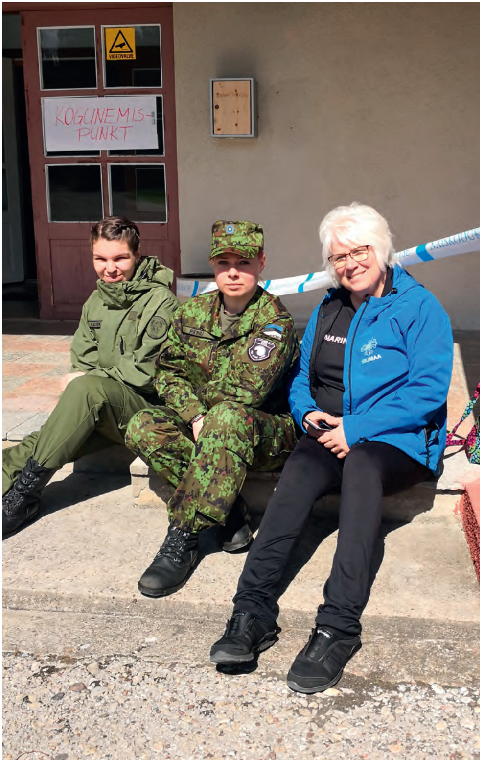
Suurõppus Siil 2018. Kogunemispunkti Hiiumaal.