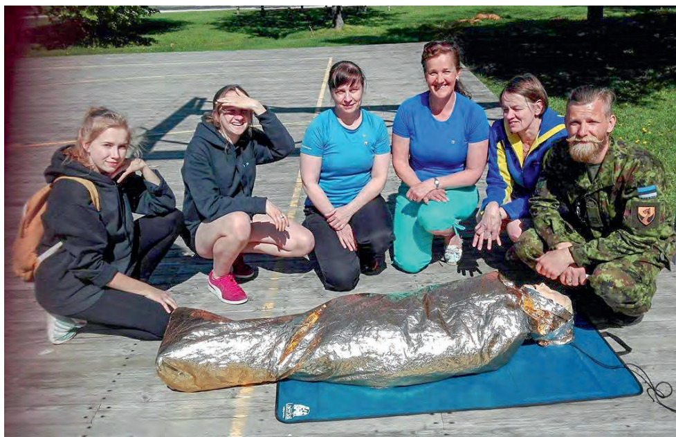
Lääneranna ohutuspäev koostöös kodutütarde ja Lääne malevaga.

NKK juhtide laagris 2015. a suvel hakkas idanema idee teha kodanikukaitsest meie viies baasväljaõppe moodul. Lääne ringkonna esimene ohutushoiu kursus viidi läbi Risti jaoskonna eestvedamisel 22.-24. septembril 2017 Piirsalu Rahvamajas. Kursusel olid ka külalised Ameerikast - neli vaatlejat laupäeva hommikust kuni lõunasöögini, kes jälgisid tunde “Kodu ja vara turvalisus”, “Tuleohutus” ja “Turvareeglid teistes võimalikes hädaolukordades”. Elevust tekitasid nii ameeriklastes kui õppurites naiskodukaitsejate poolt käsitsi valmistatud maja-maketid. Nimelt on igal maketil majas ja maja ümbruses midagi valesti ning õppurid peavad selgitama, mis on ohtlik ja miks. Väga põnevad olid ka gruppide poolt lavastatud erinevad võimalikud hädaolukorrad.