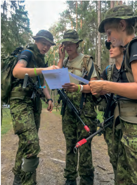
Admiral Pitka luureretk 2018.

2017.-2018. aastatel lahkusid organisatsioonist peamiselt liikmed, kelle elukoht on muutunud ning nad on juba pikemat aega olnud Võrumaalt eemal. Samuti jookseb välja üldine joon, et need liikmed ei ole kunagi organisatsiooni tegevuses väga aktiivselt osalenud. Pigem ongi liitunud ning osalenud mõnel üritusel ning seejärel jäänud tegevusest eemale. Analüüsi tulemusena oleme selgusele jõudnud, et nende liikmete ootused organisatsioonile olid teistsugused kui see, mis neid NKKs ees ootas.