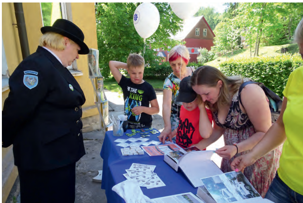
Kohvikute päev.