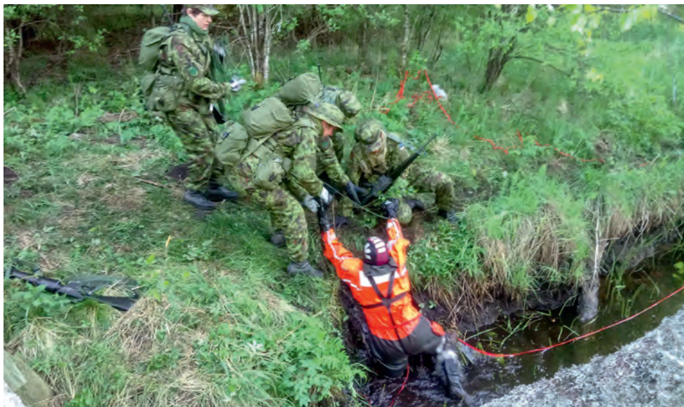
Koormusmatk 2018. Uppuja päästmine on naiskodukaitsja asi.

ligi kolm tundi puhkeajaga, millest horisontaalasendis olime paar tundi. Magamiskotte meil kaasas ei olnud, õnneks aga olid termokiled ja telkmantlid ning nende abil tegimegi endile kuuskede alla “pesa”. Hommik oli pehmelts öeldes karge. Temperatuur oli (olnud) miinuspoolel... Aga peagi hakkas päike paistma ning lõpuni ei olnud enam palju jäänud. Veel nn pioneerisilla ületus, kohtumine esinainesega, “uppuja” kaldale aitamine ning viimane pingutus ehk lõpujooks Simisallu, kus ootas kuumaks köetud saun. Ja vaat see on alles mõnu! Meie pluss on see, et me naudime, mida teeme. Muidugi kaasneb sellega ka pingutus, aga see on selline hea ja meeldiv pingutus. Meil kõigil on oma tugevused ja kogemused, kokku olime optimistlik naiskond ning tõestasime (iseendile), et “passi pole vaja vaadata”. Elu on seiklus!”