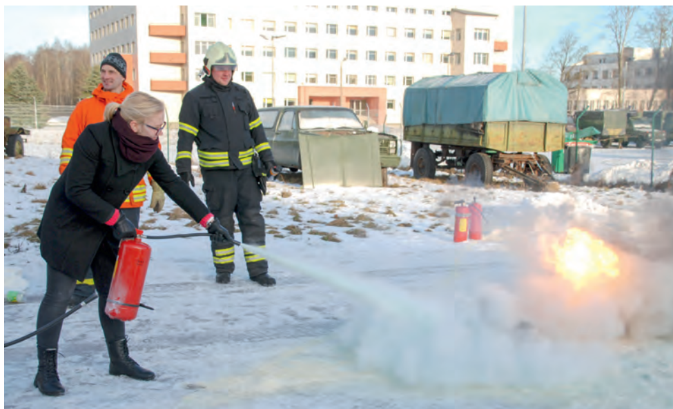
Ohutushoiu mooduli läbimine.

Jätakuvalt on ringkonnas baasväljaõppe läbimine uute liikmete seas aukohal, paljud läbivad selle ühe aastaga, kasutades võimalusel ka teiste ringkondade moodulite külastamist. 2017. a alustati ringkonnas ka ohutushoiu moodulite õpetamisega – nii mõnigi pikaajalisem liige leidis just nüüd teema, millega tahab end NKKs siduda. Ohutushoiu teemad on kindlasti need, mida iga liige saab oma igapäevaelus kasutada. Ilmselt oleme leidnud ühise lähtepunkti siduma tavalist elanikkonda NKKga. Malevas on paranenud laskeharjutuste tegemise tingimused ja seetõttu on meil intensiivistunud relvaõpetest ja laskeharjutustest osavõtmine.