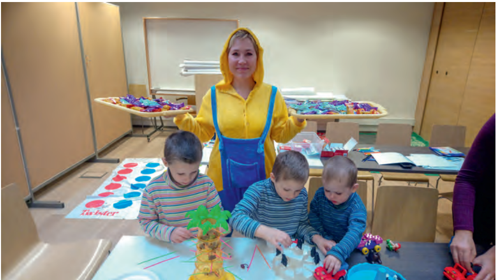
Keegi ei jää ukse taha. Evakuatsiooniõppuse lastehoid.