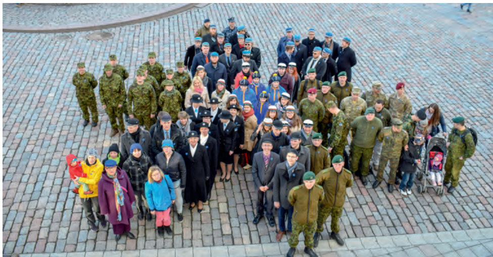
Sinilille loomine.

tegevuses (külalisõhtud, Anname au kampaania), kultuurigrupi üritustel (heategevusliku loterii meisterdusõhtud) ja sõjalis-sportliku iseloomuga tegevustes (ellujäämisõpe, spordivõistlused). Noorkotkad on rõõmuga nõus ürituste korraldamisel appi tulema ja sportlikes tegevustes oma meeskonna välja panema. Mõningaid üritusi (sõdurioskuste BVÕ, laagrirutiinid, laskepäevad) ei kujutaks aga ilma meie kaitseliitlastest sõpradeta enam ettegi.