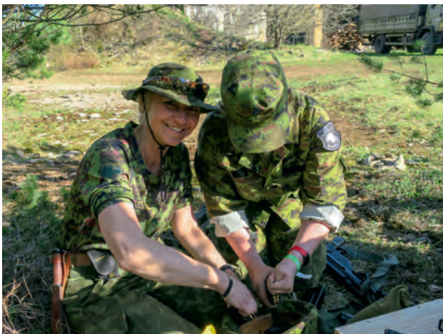
Pärast Siili lahingut.

Iga naiskodukaitsja vajab head orienteerumisoskust, olgu siis metsas marju korjates, linnadžunglis ekseldes või üksusega metsas toimetades. Seeläbi on ka orienteerumisõpped siiani olnud väga populaarsed. Ja seda mitte ainult uute liikmete, vaid ka vanemate olijate seas. 2017. a sügisel korraldasid Akadeemiline ja Põhja jaoskond päevase orienteerumisõppe, mis andis korraliku teoreetilise ning praktilise baasi ning 2018. a suvel toimus julgematele juba öö-orienteerumine Akadeemilise ja Nõmme jaoskonna eestvedamisel.