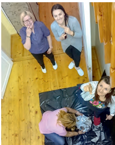
Ringkonna õppepäev 2017 aasta kevadel.

misega. Iga võistkond võttis ühest karbist võistkonnale mõeldud kaardi, kus oli pilt ja pildil oli kujutatud asukoht, mille pidi lähiümbrusest üles leidma. Kui olid õiges kohas, leidsid sealt küsimuse või ülesande, mille peale pidid liikuma alguspunkti tagasi ja selle koos meeskonnaga sooritama. Ülesanneteks oli kolmekesi ühis- tel suuskadel suusatamine, “soo ületamine” väikestel plaatidel, küsimustele vas- tamine ja nõõrist maakaarti joonistamine.“