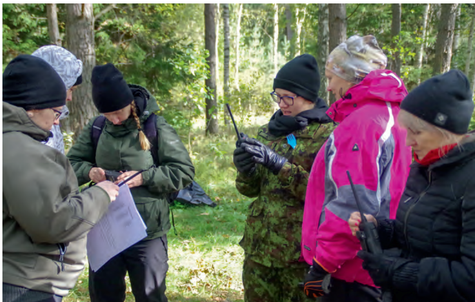
Ringkonna metsalaagris sideprotseduure meelde tuletamas. 2018.