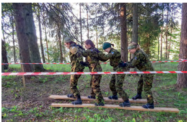
Koormusmatk 2018.