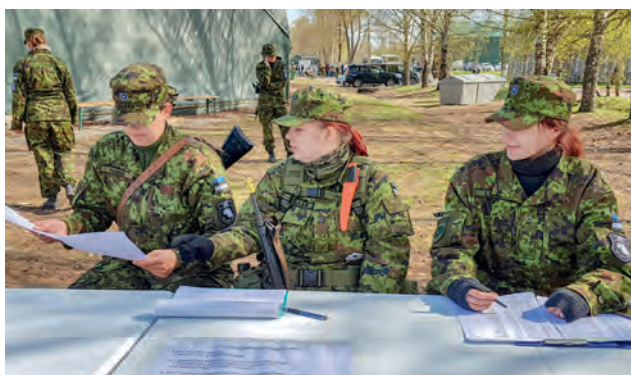
Siil 2018.

andmebaasi haldur, laskeväljaõppe koordinaator, laohaldurid, raamatukogu haldur, ftohaldur, mentorluse koordinaator). Kaks korda aastas toimuvad infotunnid, kus ringkonna juhatus kohtub jaoskondade ja erialagruppide juhtidega. Lisaks on meil sisse viidud ametisse asunud juhtide õpe ning juba tegutsevatele juhtidele korraldame koolitusi erinevate oskuste lihvimiseks. Samuti kohtuvad kõik juhid planeerimisseminaril ja juhtide aastalõpu seminaril. 2018. a toimus esmakordselt ka ringkonna vabatahtlike instruktorite õppepäev, mille käigus arutleti NKK baasväljaõppe sujuvama läbiviimise üle ja täiendati end täiskasvanute koolitamise valdkonnas.