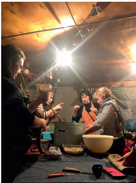
Verivorstitegu käis vanade retseptide järgi. Enne kui peened vorstitoppimismasinad käima said, oli suur jagu vorste valmis.

Tähtsate väljaõpete ja muudel ülesannete vahel jääb naistel aega ka mõnusa- mateks motivatsiooni tõstvateks seltskonnaüritusteks. Nii on ette võetud näiteks rabamatk täiskuisel ööl, lõkkeõhtu muinastuledega ja suuremad verivorstitalgud.