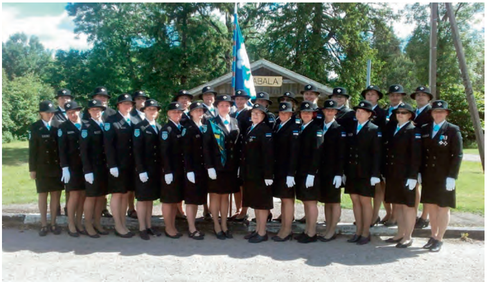
Rapla ringkond 2017. aasta võidupühal.