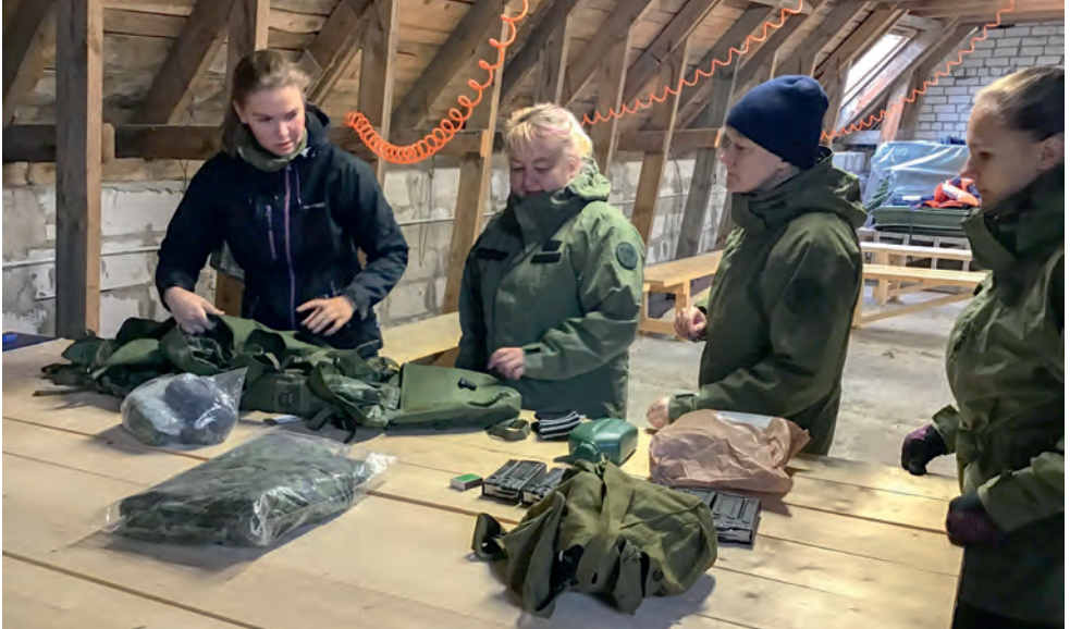
Erialagruppide vaheline võistlus.