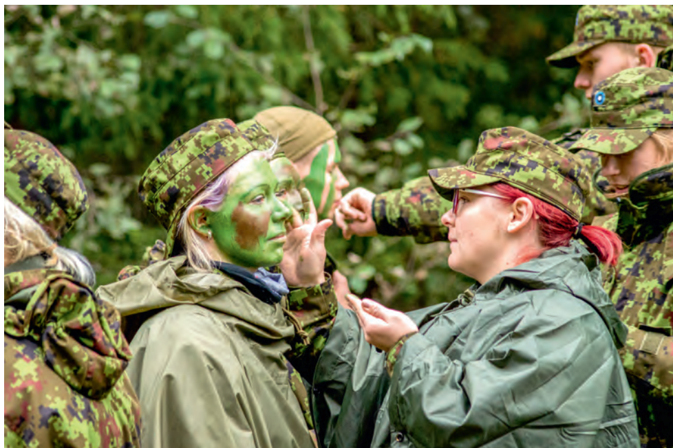
Pop-up grimmitoas kasutatakse ainult metsavärvidega sobivat värvipaletti.

- oluline on arvestada oma võimete piiridega ja osata edaspidi organisatsioonile võimalikult kasulik olla oma teadmiste ja oskustega.