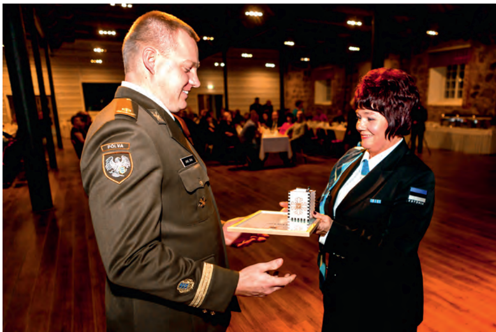
Ringkonna aastapäev, Pilt: Riho Semm