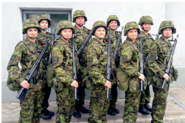
Digilaigulises vormis üksuse osa Rakvere Võidupüha paraadil 2017.

Jõgeva ringkonna arengukava aastateks 2018-2020, millele, loodame, tuleb ka järg. Samuti on üle vaadatud tunnustamise meeespea ja kinnitatud aruande vormid jaoskondadele ja erialagruppidele, et kõik teeksid aastast kokkuvõtteid samadel põhimõtetel.