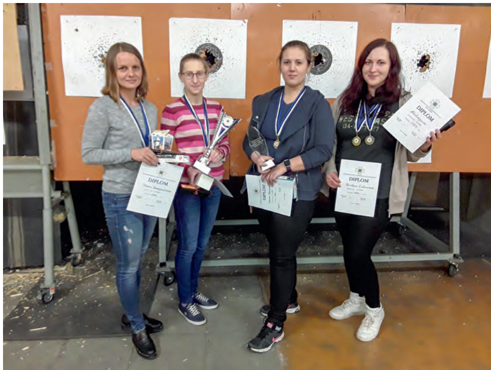
2018. aasta laskevõistluse võitjad.

“...vahet ei ole, kas väike või suur kaliiber, Alutaguse – parim!”