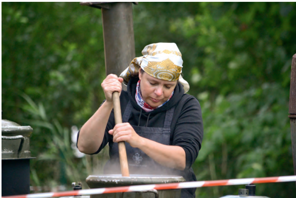
Päevad on nii pikad, et katla juures tuleb tukk peale.