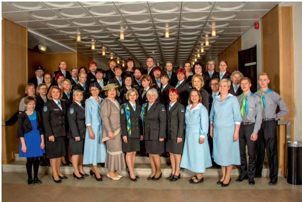
Konverentsi lõpupilt koos korraldajate ja külalistega.