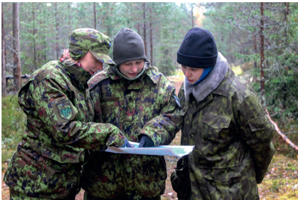
Sõduriõpe 2017. aastal Rutjal.