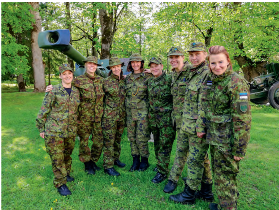
Naiskodukaitse koormusmatkal I ja IV koha saanud naiskonnad.