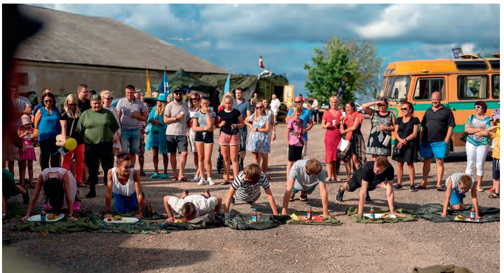
Drillburgeri tegemine.

Burgeri aja peale kokkupanek on väljaõppe viimaseks osaks vanemveebel Tormi imeteost nr 632, tuntud ka kui “Teeme kerast kriipsu ehk Kaalujälgijate superdieet – söö, palju jaksad”.