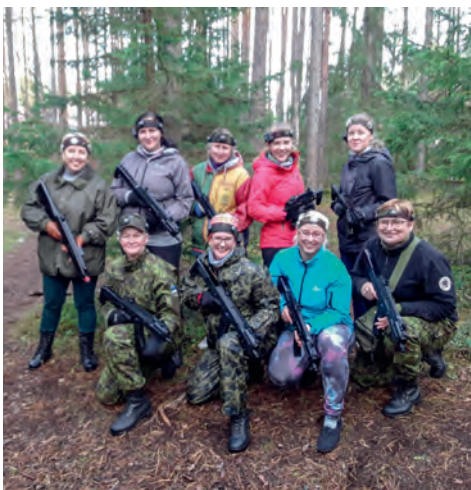
Lasermäng 2018.