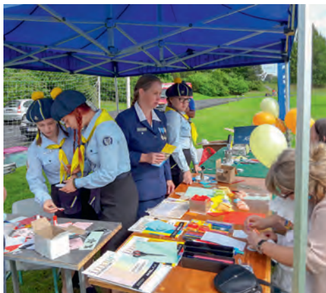
Avinurme perepäev.