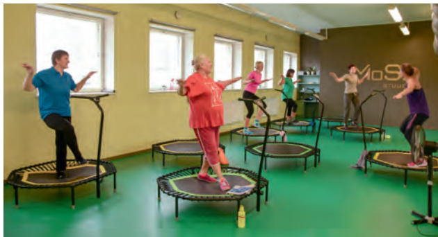
Juhtide sügisene õppepäev 2018 algas põneva treeninguga MoSo stuudios.

Ringkonna väljaõppes jätkame traditsiooniliste suundadega, kuid oleme edukalt algatanud ka uusi. Meil on hästi käima läinud juhtide õppepäevad kaks korda aastas – kevadel kaasame uusi juhte ja teeme tööd alusdokumentidega, sügisel vaatame aastale tagasi ning boonusena teeme midagi üldharivat.