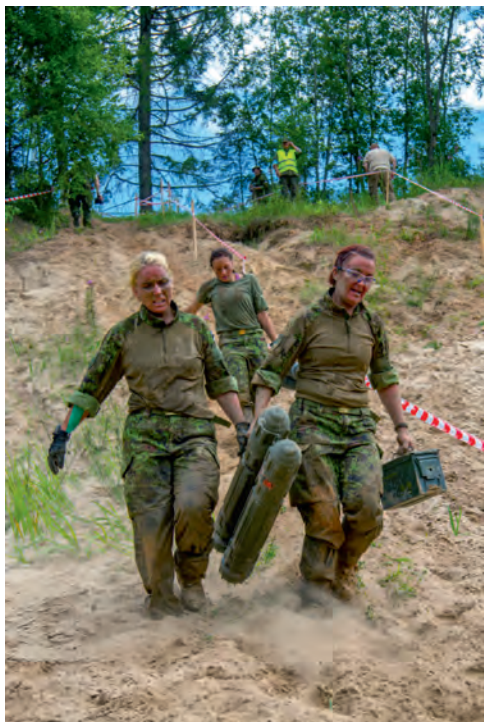
võidufoto Rapla ringkonna naistest Pitka retkel.