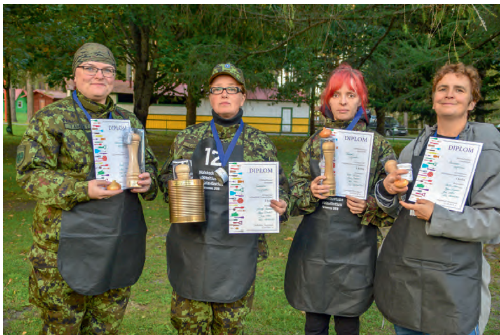
2018. aasta välitoitlustuse erialavõistluse võitjad.