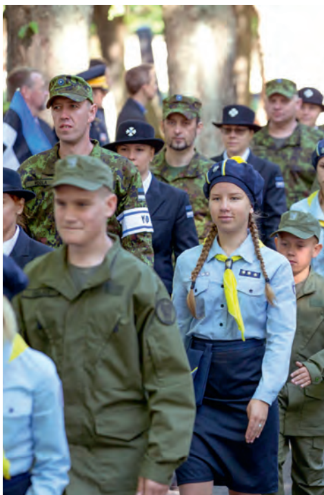
Tuletoojad.