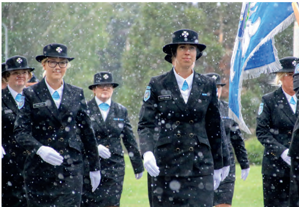
2018. aasta maakaitsepäeval Põltsamaal.

Me oleme suurte muutuste keerises, naiskodukaitsjatelt oodatakse ikka rohkem ja rohkem. Vahel tekib küsimus, kas kõiki ootusi ikka suudetakse täita. Ringkonna esinaisena tean, et meiega liitub järjest teadlikumaid naisi. Liitujad teavad, mida nad ootavad organisatsioonilt ja samas on valmis ka ringkonna arengule kaasa aitama. Samas on hea tõdeda, et vahepeal “kodusolijad” leiavad julgust tegevuse juurde tagasi pöörduda.