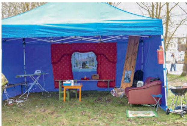
Ohutushoiumaja Supilinna päevadel.