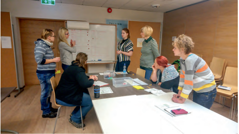
2017. aasta evakuatsiooniõppuse hoogne arutelu.

Sama trend jätkus ka 2018. a: organisatsiooniõppe mooduli läbis 16 liiget, esmaabil osales 18, toitlustusel 13 ja sõdurioskused said omandatud 21 liikmel.