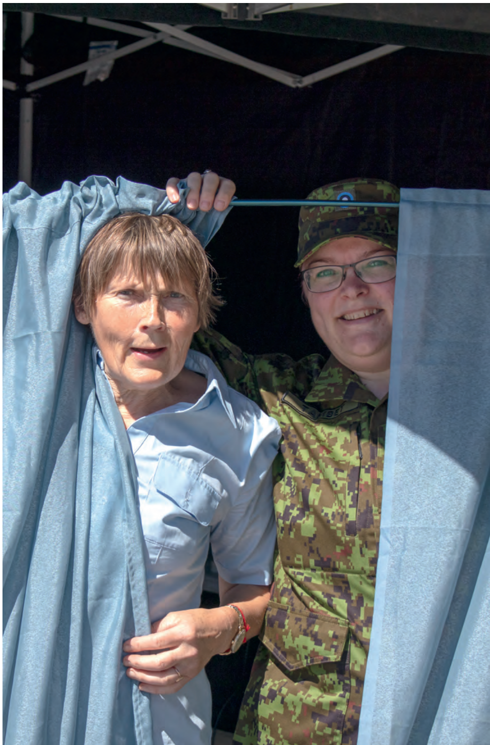
Pärnumaa naiskodukaitsjad 2018. aasta maakaitsepäeval ohutushoidu tutvustamas.