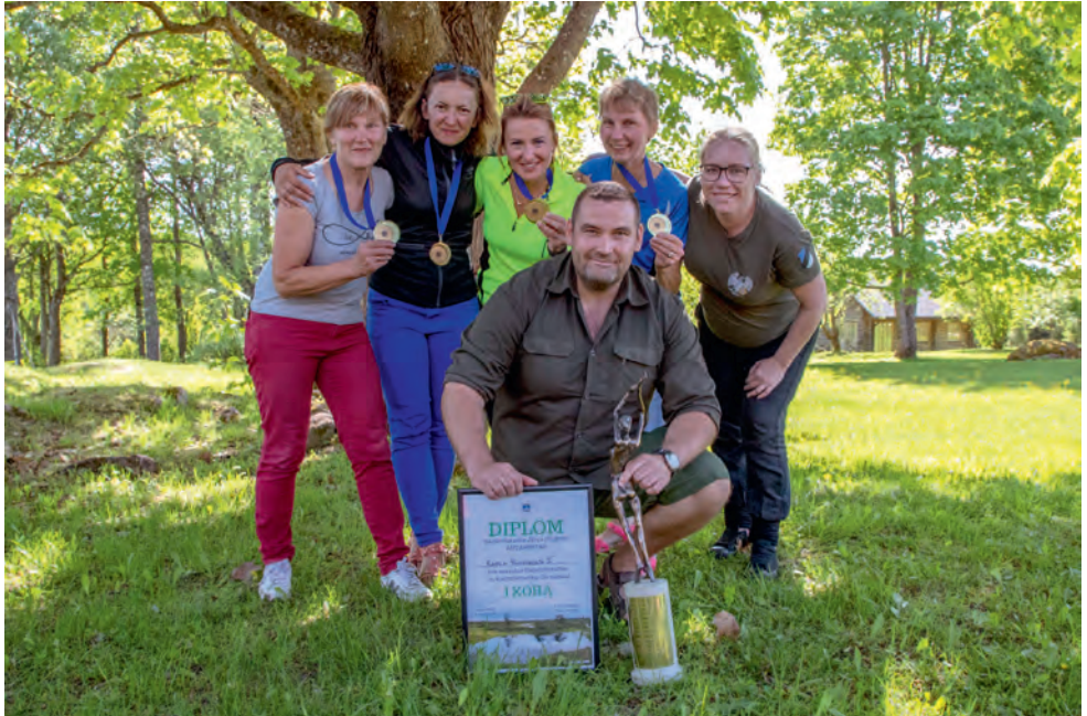
Koormusmatka võitjad 2018.