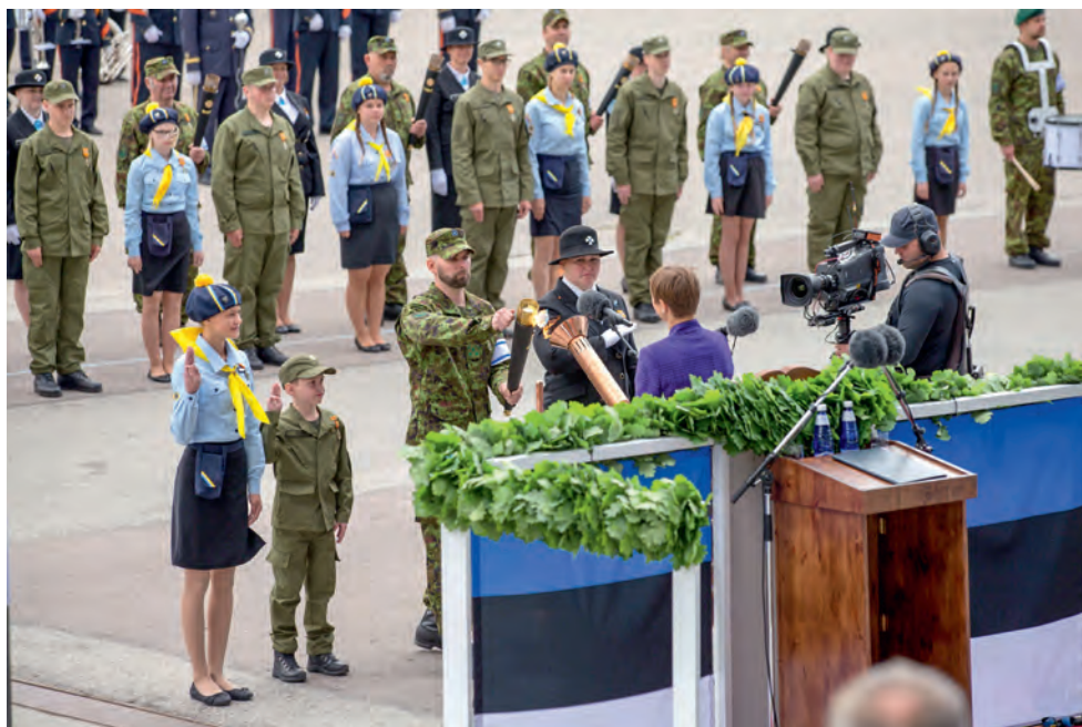
Võidutule üleandmine 2018. aastal.