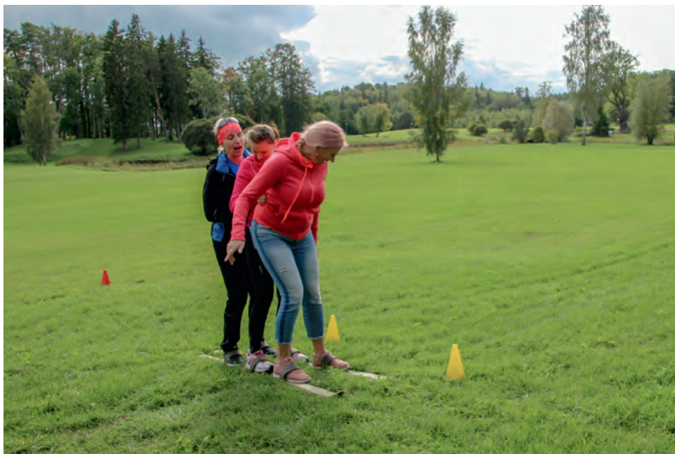
Otepää jaoskonna võistkond Valga ringkonna spordipäeval 2018 aasta septembris.