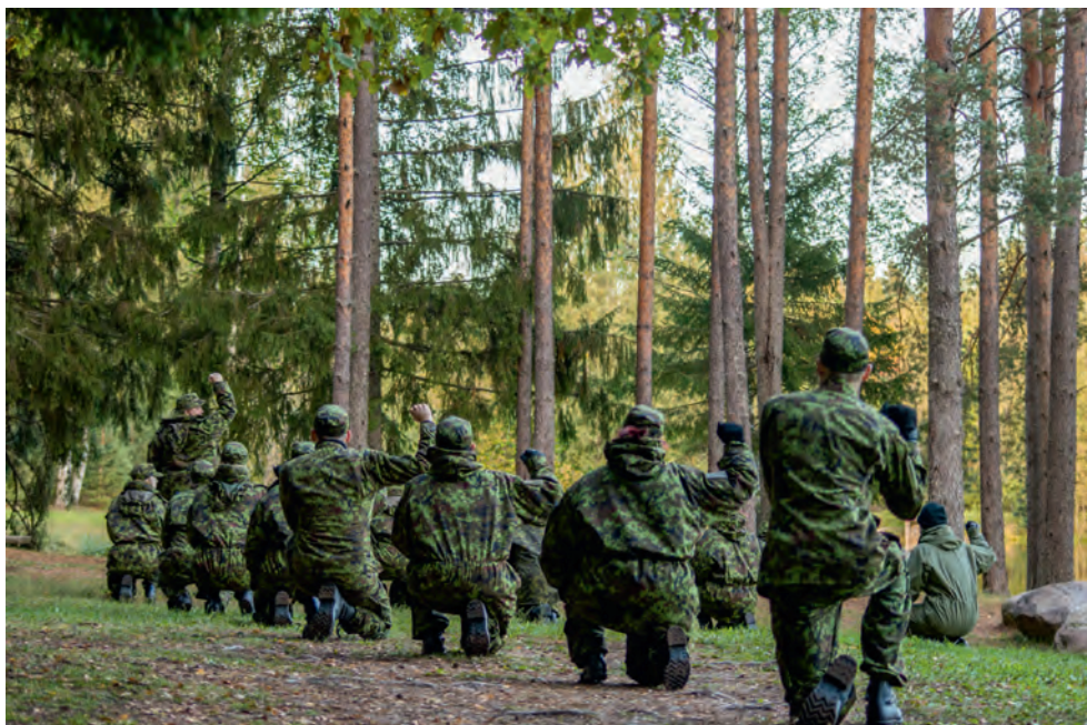
Paljud naised saavad just sõdurioskuste kursusel teada, miks filmides sõdurid imelikke asju teevad.

Tugev sõdurioskuste põhiõpe koos eesmärgiga suunata järjest enam naiskodukaits- jaid KL ettevalmistatavasse üksustesse on kaasa toonud suurema huvi vaadata just kaitseväge rohelist vormi nõudvate erialade poole. Järjest enam naisi on valinud oma