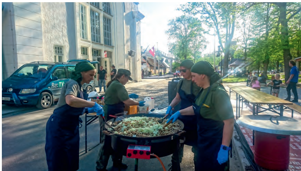
Toitlustamine Valga raudteejaamas 2017. aasta mais lätlaste korraldatud sünnimisel Läti 100 raames.