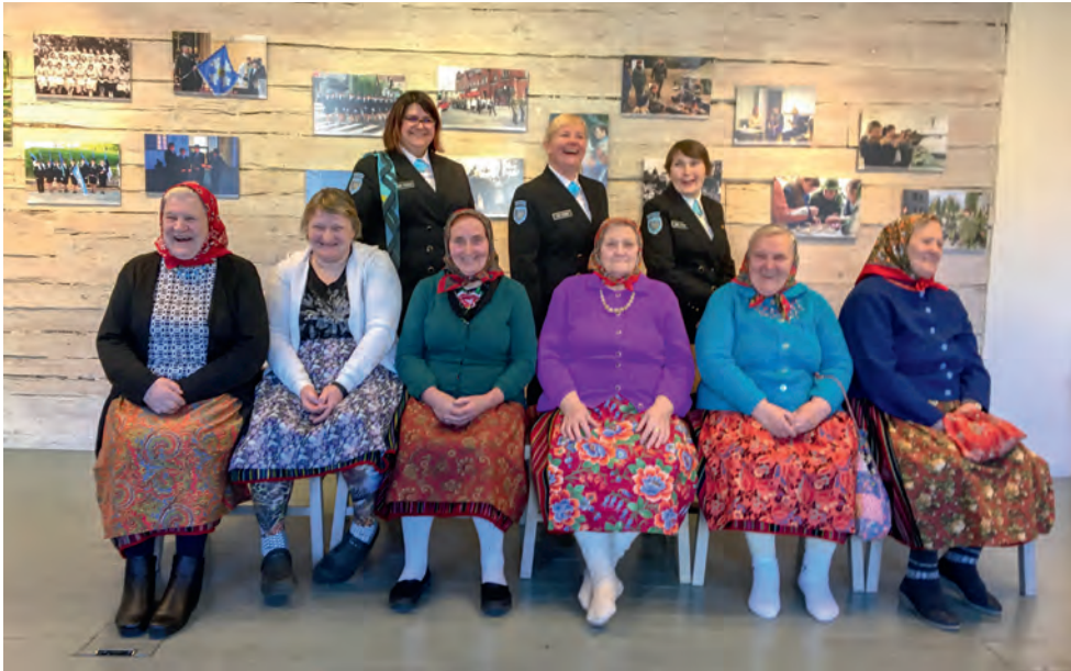
Naiskodukaitsse Pärnumaa ringkonna fotonäituse avamine Kihnus.

2017. a kulges NKK 90. aastapäeva tähistamise rütmis. Aasta algul pani ringkond kokku oma ajalugu ja tegevust tutvustava fotonäituse, mis hakkas kodumaakonna erinevatel seintel oma lugu rääkima. Näituste sari sai avalöögi kutsehariduskeskuses, liikus sealt edasi Kihnu (kuhu halbade ilmaolude tõttu tuli kaks korda startida), Pärnu Haiglasse, Sinti, Kilingi-Nõmme, Vändrasse, Häädemeestele ja Endla teatrisse. Iga näituse avamine kujunes eraldi sündmuseks, kus tutvustati organisatsiooni, räägiti ajaloo ja vahel jagati ka kasulikke ohutuslaseid nõuandeid.