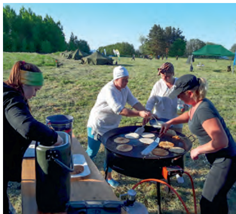
Toitlustuse BVÕ.

Avinurme jaoskond – haldusreformi käigus liikus Avinurme vald 2018. a algusest Jõgeva maakonda, kuid malevkond ning jaoskond on endiselt Alutagusel. Liikmeid ei ole palju, kuid suur osa neist lööb erinevates ettevõtmistes kaasa. Avinurme jaoskonnas on traditsiooniks saanud kohalikule kogukonnale suvise perepäeva korraldamine. 2018. a toimusid need juba viiendat korda. Kaasatud on jõustruktuurid oma demonratsioonide ja tehnikaga.