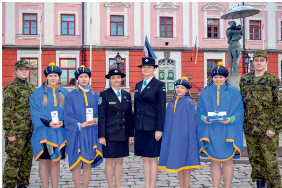
Sinilillekampaania 2017. Üks organisatsioon: NKK, KT, KL, NK.