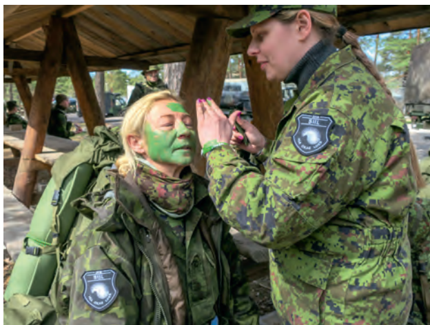
Siili rännakuks valmistudes.