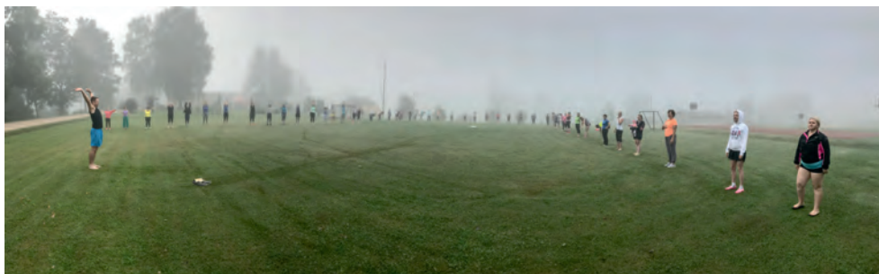
Hommikuvõimlemine 2018.a juhtide laagris.

ka laul. Tantsuproovides käies lubas juhendaja Silja Oss, et oma aastapäevaks õpime ära line-tantsu etteaste. Nii sai ka tehtud. Ja juba 2. detsembril Võrumaa ringkonna aastapäeval tehti avaesinemine ringkonna line-tantsu grupiga. Edasi läks kõik kuidagi nii kiiresti, et enam ei saanud arugi, kuna meie ühekordsest projektist sai esimene NKK line-tantsu grupp, keda kutsuti erinevate rahvamajade jõulupidudele ja üritustele. Võrumaa ringkonna naised astusid oma laulu ning line-tantsuga üles ka 2018. a suvel Nõiarriigis, kus toimus üle-eestiline NKK juhtide laager.