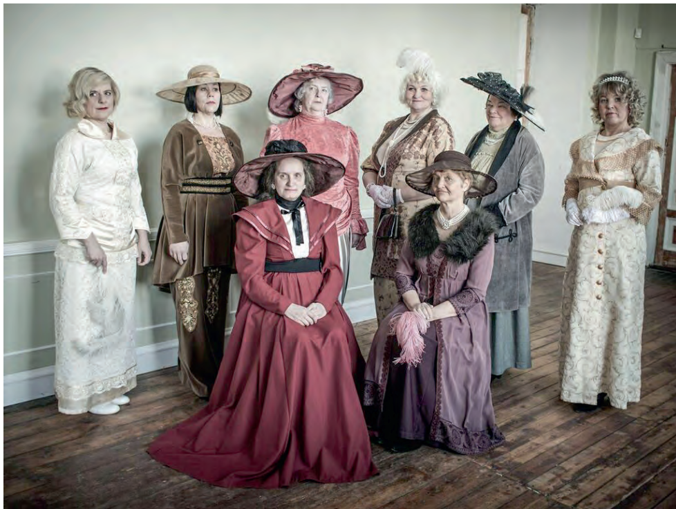
EV100 raames korraldas Paldiski jaoskond stiilse fotosessiooni “Naine 100 aastat tagasi”.

Veebruaris oli Muraste kogukonnakeskus tihedat sagimist täis, kui 12 särasilmset ja energilist Harku naist kogunesid selleks, et õppida meistrimehe käe all sushi valmistamise kunsti. Tarkusi omandades ja maitsvaid sushisid nautides pandi punkt edukale 2017. aastale ja tähistati ühtlasi ka isamaa 100. sünnipäeva.