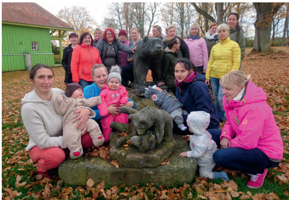
Beebid ei sega juhtimist, juhtide õppepäev 2018.

2018. a esimese poole märksõna oli Siil. Mina sain kätt proovida staabiassistendina. Oli põnev ning väljakutseid pakkuv kogemus – kuidas siis ikkagi kiirelt ning oskuslikult reageerida reaalses olukorras, kui ei tohi pead kaotada. Kõik see nõuabki harjutamist, teooriat paberi peal lugedes oskusi ei saavuta.