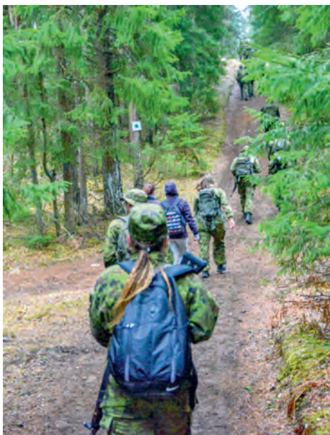
Tõnissoni rännak ehk käin kuni saan.

“Käin seni, kuni saan esikoha – olgu see siis mistahes vanuseklassis”.