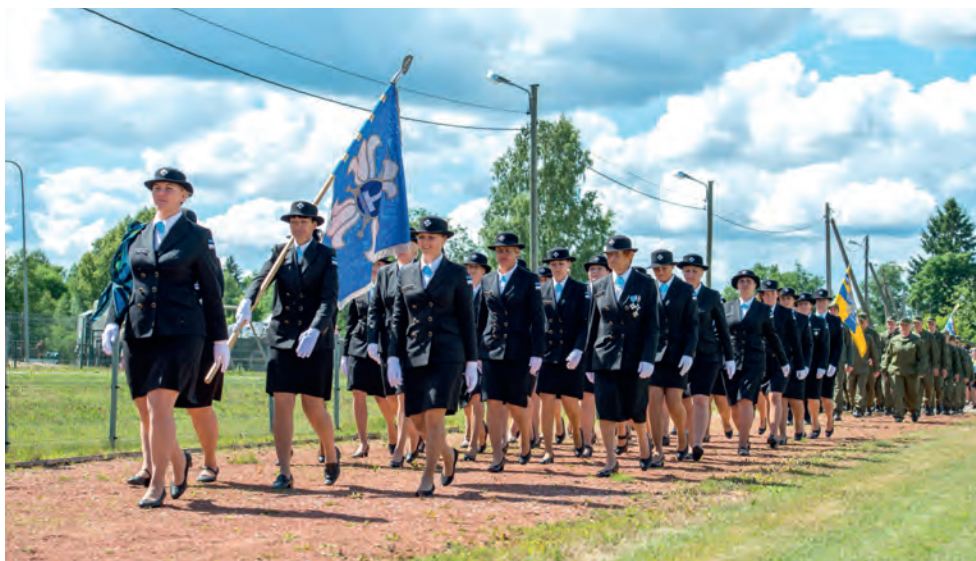
Maakaitsepäev Kärus 23. juunil 2018.