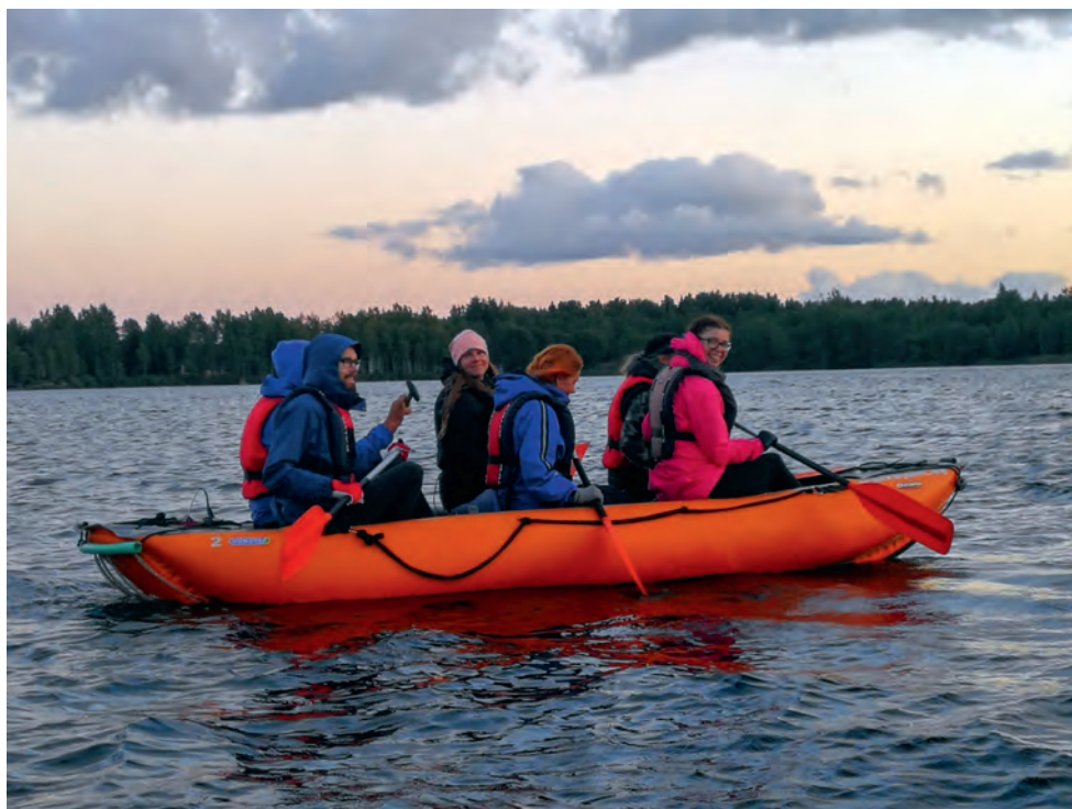
Kultuurigrupp Rummu karjääris öisel paadimatkal.

Kultuurigrupp näiteks on külastanud mõningaid väikesaari, õppinud erinevaid meisterdustehnikaid ja käinud külas lausa nii kaugel kui Hiiumaal. Suuresti kõik väljasõidud on olnud liikmete oma finantseerimisel, kuid naised lähevad alati ägedate mõtetega kaasa. Side- ja staabigrupp ning formeerijad korraldasid üheskoos veeohutuse õppepäeva. Ka toitlustajate põnevatel õpetel on uuritud näiteks kuivtoidupaki sisu, õpitud hügieeni ja palju muud huvitavat.