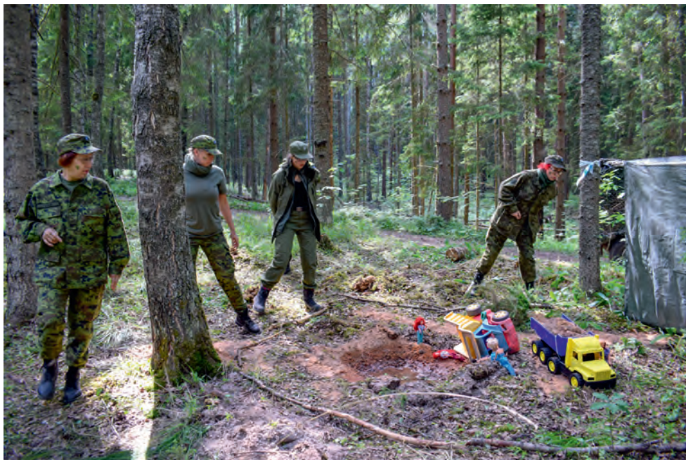
Esmaabi erialavõistlus.