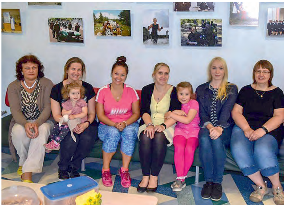
NKK 90. aastapäevale pühendatud näituse avamine Verekeskuses.