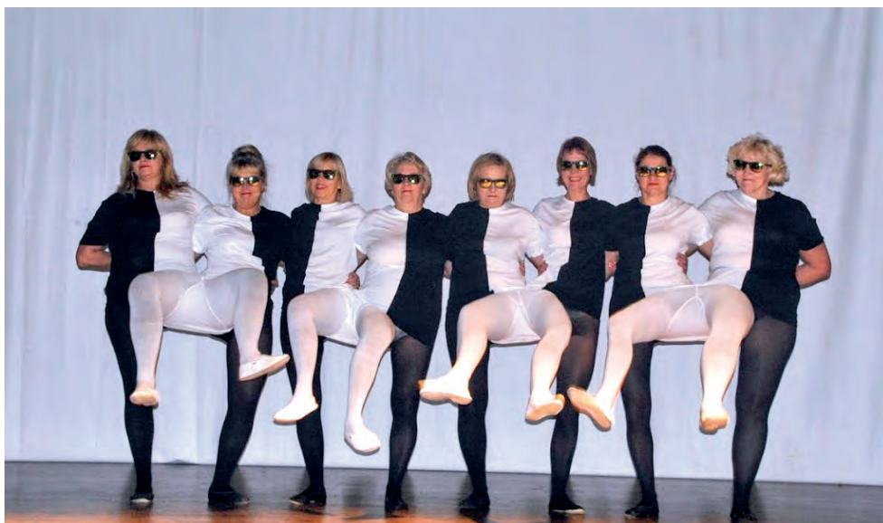
2018. aasta ringkonna aastapäeva must-valged tantsijad.

Ringkonna juhatuse liikme Liina Riismaa sõnul võib ringkonna aastapäev olla kuiv kõnede rägistik, kus kuulajad peidavad haigutusi ning vaatavad vaikset kella poole. Kuid nii ei ole, kui ürituse korraldaja on Harju ringkonna kultuurigrupp. Iga-aastased vastuvõttud saavad hoopis teise näo, kui neile on andnud oma "puudutuse" kultuuritegelased. 2017. a oodati vastuvõtule kadripäevale omases valges rõivastuses või ajaloolises kostüümis, 2018. a oli vastuvõtu stiil 1920-30. aastad. Vastuvõtul osalejaid kaasati viktoriinidesse ja etteastetesse.