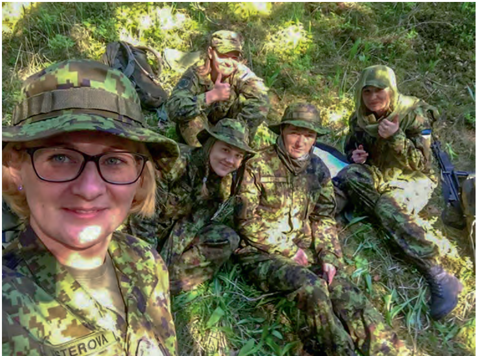
Koormusmatk 2018.

Kasutatud on NKK kodulehel Sündmuste rubriigi materjale 2017/2018 aasta kohta. Tsiteeritud on tekstide autoreid või autorite poolt tsiteeritud osalejaid.