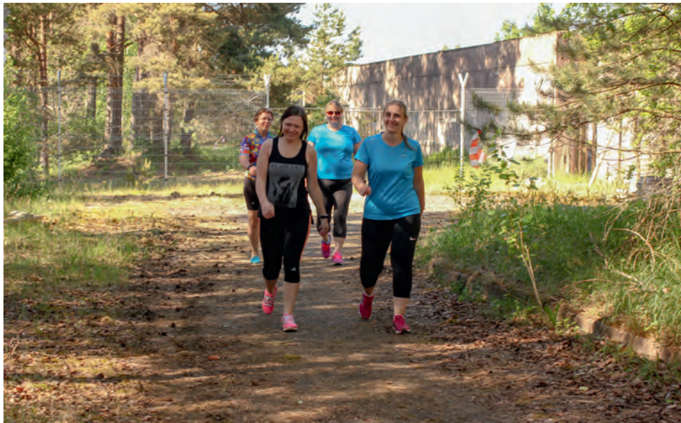
Xena reidi kõnnietapp - kõigile sobiv.