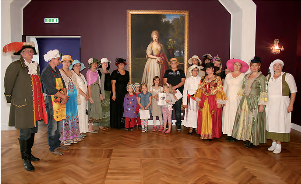
Daamide vibupäev 2014.