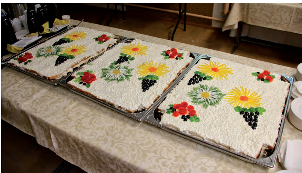
Elva malevkonna kodu avamine maakaitsepäeval 2013.

Uutest algatustest ühiskonna heaks olgu märgitud maakaitsepäeva loterii, mille kogu tulu annetatakse selle omavalitsusüksuse haldusalas tegutsevale abivajajale, kus toimub maleva maakaitsepäeva üritus. 2013. aastal toimus maakaitsepäeva paraad Elvas ning tulu läks kohalikule väikelastekodule jalgarataste ja spordivarustuse soetamiseks. 2014. aastal oli 23. juunil üritus Kambjas ning toetasime Kambja