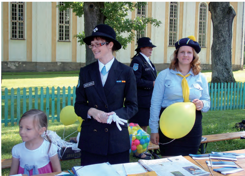
Põlva maakaitsepäev.

Arendavaks ja kasulikuks motivaatoriks oli ka loeng „Vabatahtlikkus ja vaba tahe“, mille raames meisterdati savist kruuse ning valmistati ehtekarpe.