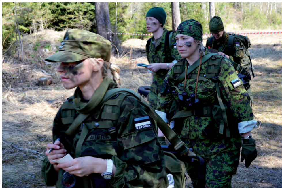
NKK koormusmatka võitjad (ise nad seda veel ei tea).

Samuti algatas Tallinna ringkond tervelt kolm uut toredat üritust, et oma liikmete seas sporti propageerida. Spordigrupi eestvõttel korraldati patrullivõistlus „Xena reid“ lahingpaaridele, tilluorienteerumine „Mary Poppins“ NKK pisikestele ja nende vanematele ning ringkonna laskevõistlus „Jane Bond“. Xena reidile kutsusime ka Harju ringkonna naiskodukaitsjad, kellest üks lahingpaar läks rajale jalgratastega. „Mary Poppins“ osutus ülimalt populaarseks, nalja ja naeru jätkus nii vanematele kui ka lastele. Kuna Naiskodukaitsese on pereväärtusi hoidev organisatsioon, leidis enamik osalejaid, et selliseid üritusi võiks sagedamini korraldada. See aitaks hoida aktiivsena neidki tegevliikmeid, kes on pisiperega kodus ega saa ka suurema tahtmise juures minna osalema militaarvõistlustele.