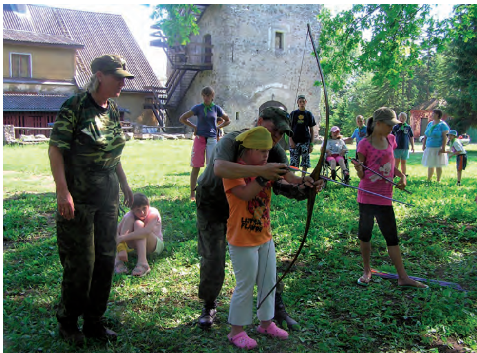
Koostöö Porkuni kooliga.

Meie säravaks sõbraks on Porkuni kooli pere, keda külastame igal aastal, kaasates kodutütred, noorkotkaid ja maleva kaitseliitlasi. Porkuni koolis veedavad oma päevi mõõduka ja raske intellektipuudega lapsed. Nad kuulavad huviga ja teevad kaasa, kui õpetame, kuidas metsas ellu jääda ja suurt sõduritelki püstitada. Uurivad hoolega, milline on kaitseliitlase varustus ja kuidas õhupüssist märki lasta, mida põnevat on suures seljakotis, kuidas katelokiga vett keeta ja palju muud. Meie lahkudes hüüavad Porkuni kooli lapsed: „Tulge jälle, kallid sõbrad!“ Nii on meie koostöö kestnud mitu aastat ning jätkub veel kaua. See sära, mis laste silmades peegeldub, jääb meile kõigile alati meelde ning hea tunne on teada, et oled oodatud.