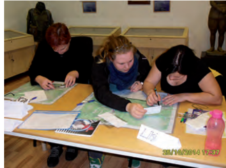
Esmaabi ja sõdurioskuste BVÕ. Pilt: live Rohtla.

Naiskodukaitset tutvustavaid voldikuid ja teabematerjale ellujäämise teemadel. Samuti said huvilised kirjalikku testi tehes kontrollida, kas nad sobivad Naiskodukaitsetesse ja millisesse erialagruppi täpselt. Parimad testitegijad lahkusid õnnepuõngiga, mille eest sai pannkoogi koos koduse moosi või meega.