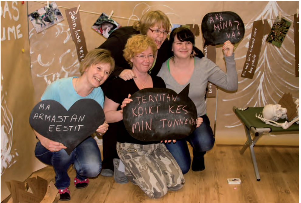
Naiskodukaitse avalike suhete kursuse ajal käib hoogne ideede kogumine. Üks võimalik messiboks 2013. aasta kursuslastelt.

erialavõistluse. Mõlemad paistsid taas silma uuenduslike ja huvitavate ülesannetega ning heal tasemel korraldustöoga. Ühisjooneks võib neil võistlustel pidada asjaolu, et ülesanded olid väga praktilised ning üles ehitatud reaalsete situatsioonide lahendamisele.