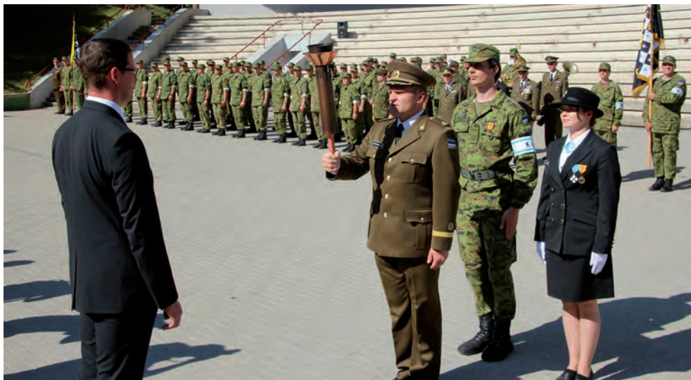
Maakaitsepäev 2013.

Liikmete arvu kasvule mõjus positiivselt Lõuna-Tartumaa jaoskonna moodustamine