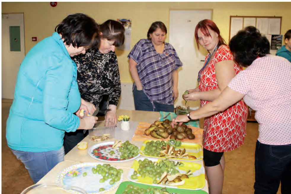
Sõbrapäev Tahevas.

Kindlasti jätkame ka 2015. aastal oma traditsioonilise naistepäevale pühendatud laskevõistlusega. Laskevõistlus sai alguse 2007. aastal ja esimesel kolmel korral osales ka Läti politsei naiskond. Kui Läti politsei enam võistleva ei tulnud, otsustasime kaasata kodutütred ja nii ongi viimasel kolmel aastal osalenud nemad. Võistlusest ongi välja kujunenud terviklik koostööüritus kodutütarde ja noorkotkastega. Kellele siis ei meeldi, kui naistepäeva aegu poisid lauda katavad ja lilli kingivad! Tunamullu koos Naiskodukaitse instruktoritega tekkis mõte hakata korraldama üritusi, kuhu oleks kaasatud endised Lõuna piirkonna ringkonnad. Valga ringkonnas otsustasime, et kuna meil on juba nii mõnus traditsioon olemas, siis kutsumegi naabrid külla just sellisele mõnusale võistlusele. Nii ongi juba teist aastat järjest meie võistlusele oodatud ka naaberringkonnad.