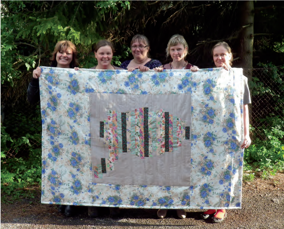
Pihla jaoskonna naised on Võsu tekile jäädvustanud Saaremaa kontuuri.

tehnika võtteid. Nii muuseas saavad käsitööõhtutel tehtud ka maleva jaoks vajalikud õmblustööd: lipukotid, saepurukotid lasketiiru ning köögivarustus.