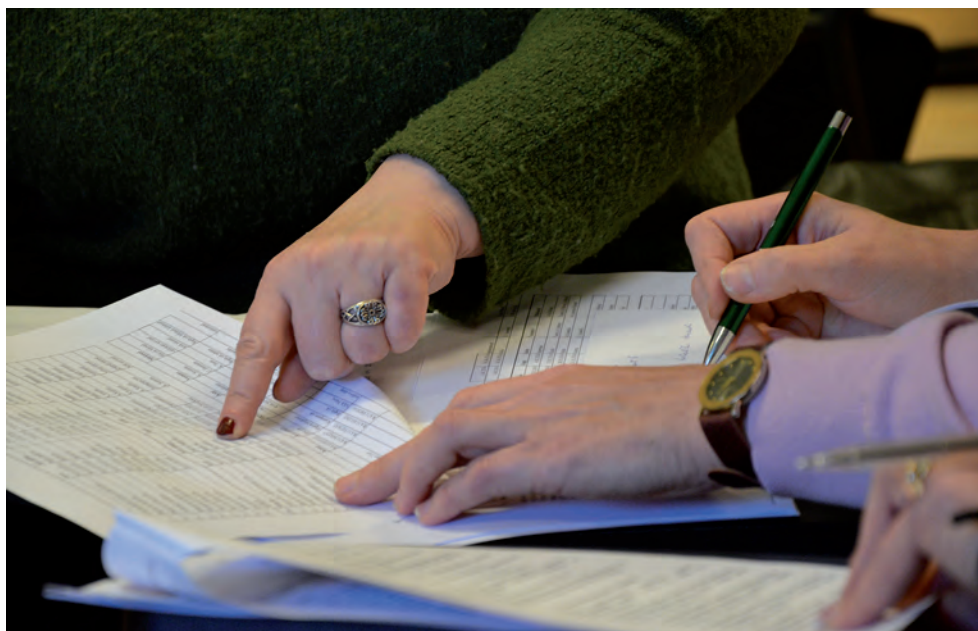
Revisjonikomisjonide õppepäev Raplas.