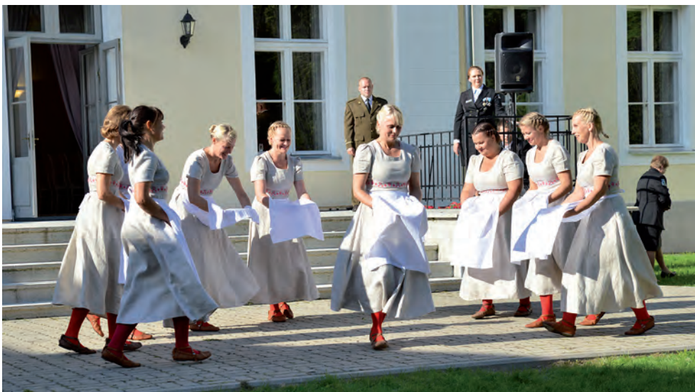
Naiskodukaitse aastapäeva tähistamisel Koigis loob meeleolu Järva ringkonna naisrahvatantsurühm Köver Künarnukk.

Mainitud ettevõtmine oli Järva ringkonnale erilise tähendusega, sest organisatsiooni üle-eestilise sünnipäeva korraldamine oli usaldatud Järva ringkonna naiskodukaitsjatele. Peopäeval löid tänuhetkede vahele meeleolu ansambel Tuulemaa ja Järva ringkonna oma naisrahvatantsurühm Köver Künarnukk. Päikesisel sügispäeval peetud pidu Koigi mõisas ja selle õues sai kiitvat tagasisidet mitmelt poolt.