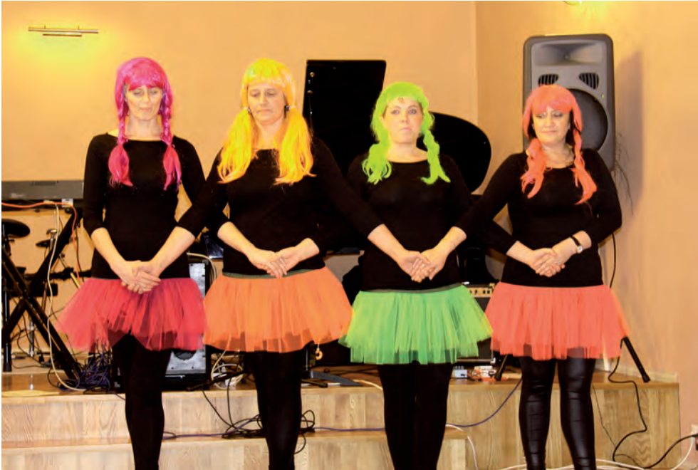
„Luikede järv” kultuurigrupi esituses.

2013. aasta oli ka Harju formeerijatele väga töörohke, sest toimus suurõppus Kevadtorm. Meie ringkonna naised olid Kevadtormil formeerijatena suisa 30 ning peale nende veel parameedikud ja toitlustajad.