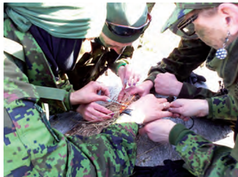
Vasakul: Jõgeva ringkonna BVÕ IV 2014. Paremal: NKK koormusmatk 2014 Saaremaal.