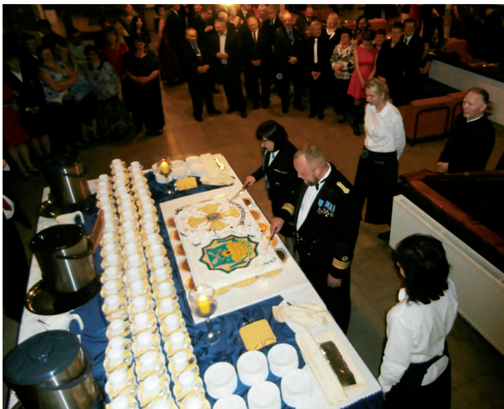
NKK Viru ringkonna ja KL Viru maleva aastapäev.