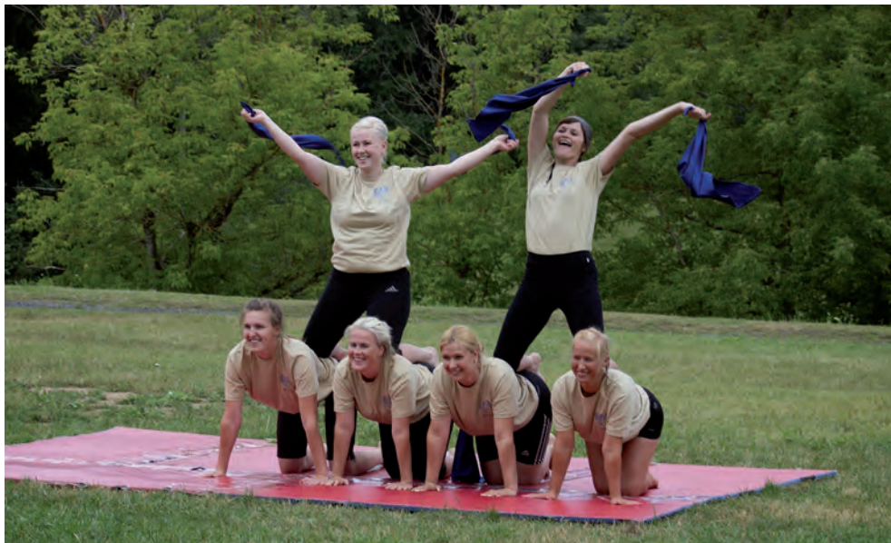
NKK spordivõistlusel jõu ja ilu numbreid näitamas.

„Minu kallis isa, kas sa oled visa ja teenid palgalisa? Oled ehk MacGyveri moodi, või hoopis kuningaks sind loodi?“ Vastus: „Iga isa on omamoodi, just nii, nagu ta loodi.“ Nii kirjutas isast kunagi üks koolipoiss. Olla isa tähendab olla eeskuju, see tähendab olla turvaliste piiride seadja, vastutaja. 2014. aastal valis Põlvamaa aasta isa välja esimest korda Naiskodukaitse Põlva ringkond. Kokku esitati 14 kandidaati. Lugesid kirju, õhkus neist igaühest soojust, hellust, armastust selle inimese vastu, kellest kirjutati. Kandidaate esitasid nii lapsed, lapselapsed, abikaasad kui ka sõbrad.