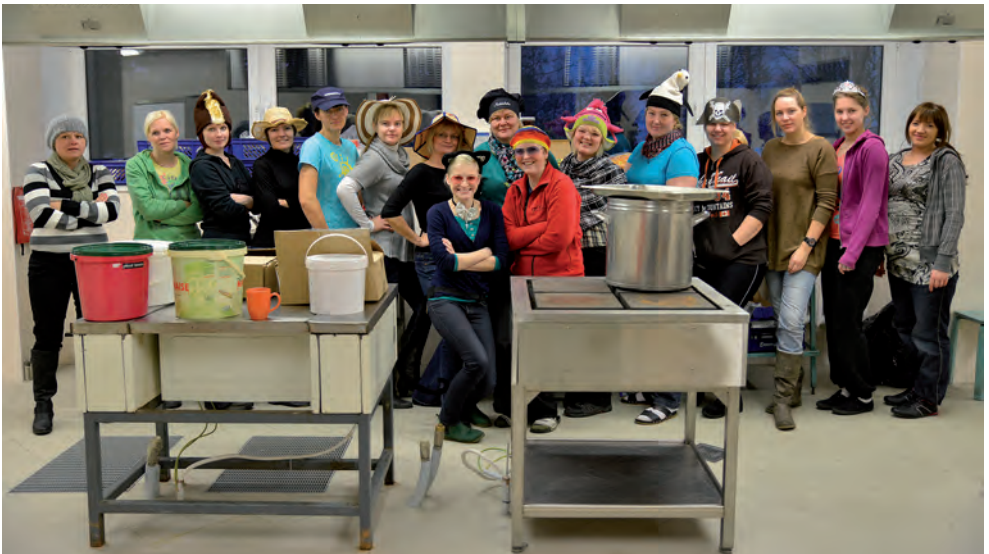
Toitlustamise BVÕ 2013. aasta kursusel summutati õppimist pidurdavat ärevust lustakate peakatete kandmisega.