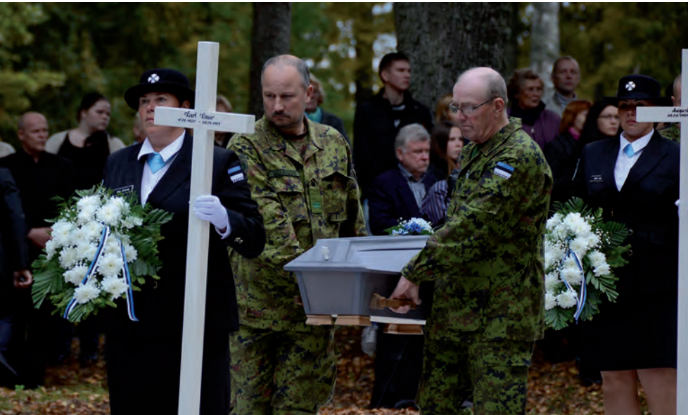
Metsavendade ümbermatmine 2013. aasta septembris.