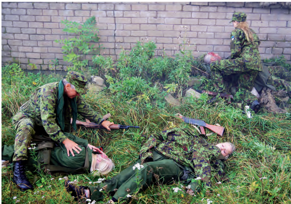
Esmaabi erialavõistlus 2014.

2013. aasta lõppes meile liikmete arvus olulise piiri, saja ületamisega. Saja tegevliikme hulgas oli kaks noorliiget, peale nende on meil kaks auliiget ja üks toetajaliige. 2014. aasta jooksul liikus palju naiskodukaitsjaid Sakala ringkonnast ära. Oli neid, kellele