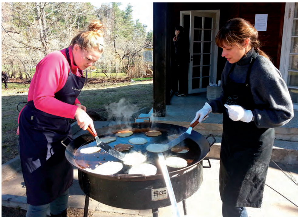
Hommikused pannkoogid Võsul.

Jätakuvalt on Harju ringkond koos malevaga väga heades suhetes Soome Vabatahtliku Reservväe Liiduga. Meie ühiseks pidepunktiks on alati maakaitsepäev – nii siin- kui sealpool piiri.