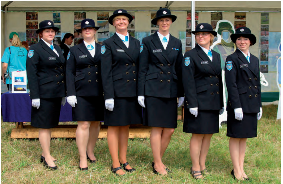
Männiku jaoskond.

Erialagrupid said kahe aastaga hoo sisse. Aktiivselt käivitus kultuurigrupi tegevus. Esineti mitmel üritusel näidenditega, tehti tantsukavasid ning tegutses ringkonna ansambel. Laulutrio kogus kuulsust ka üleriigilistel kokkusaamistel ning meie näitetrupp jäi eredalt meelde oma Luikede järve kavaga. Käsitööringid toimusid regulaarselt ning nobedad näpud löid erinevaid ilusaid ja vahvaid asju. Nii loterii tarbeks kui ka isikliku arengu huvides naised üle ringkonna kudasid, heegeldasid, punusid, meisterdasid ning sündisid jälle uued sokid-kindad, sokiloomad, käepaelad, heegelnukud, papud, satsisallid ja kaardid-karbid jne. Eri töötubadel ja käsitööõhtutel ei paistnud lõppu ☺