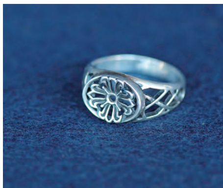
Naiskodukaitse sõrmus 2014.