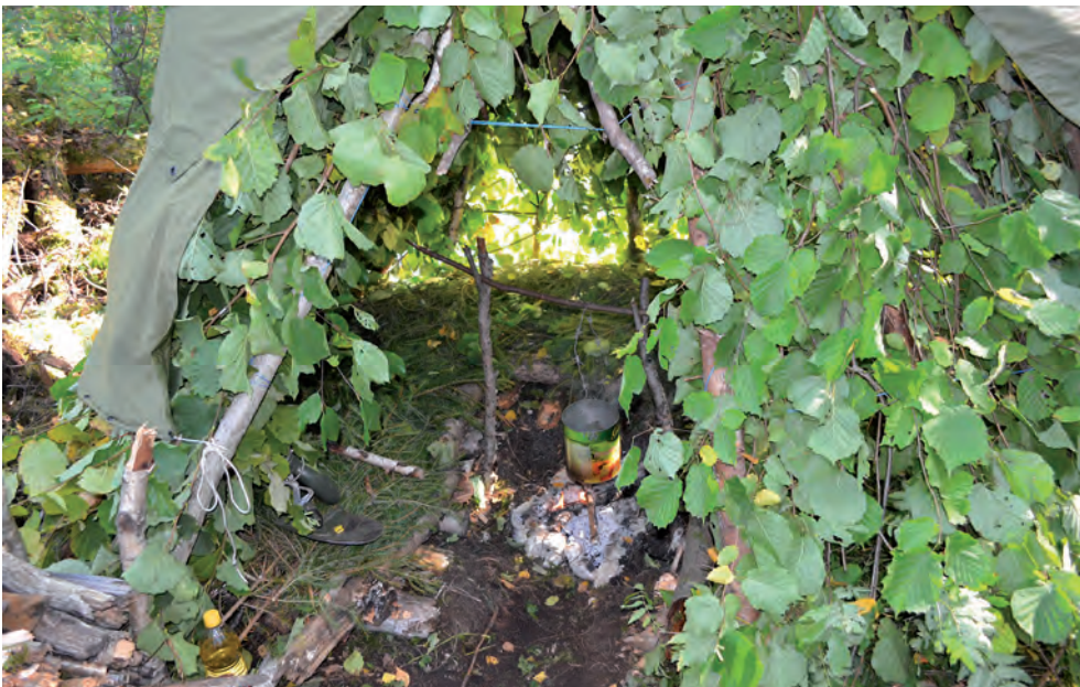
2013 aasta suvine ellujäämiskursus Kirnal.