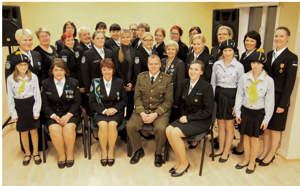
Ringkonna 17. aastapäev Soodoma külakeskuses.

Marsruudiks said kokku pandud otse loomulikult Põlvamaa kaunid kohad. Rada kulges kahe päeva jooksul ligi sajalt kilomeetrit Põlvast Värskasse. Miks minna otse,