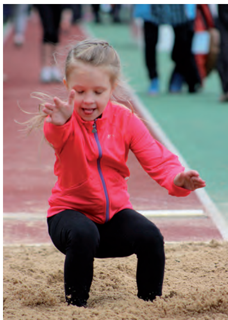
Laste kergejõustikupäev 2014.