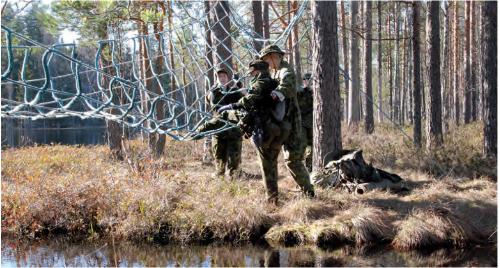
NKK koormusmatk 2013 Jõgeva ringkond.

Enne kojuõitu ootas ees viimane teooriatund – terade olemus ja teritamise põhimõtted. Kümme naist seisis reas ja teritasid oma nuge. Instruktori poolt tunnistati sobilikuks meetodiks ka kodustes tingimustes nugade tassi kareda põhja vastu hõõrumine.