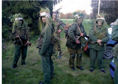
Sõdurioskuste BVÕ.