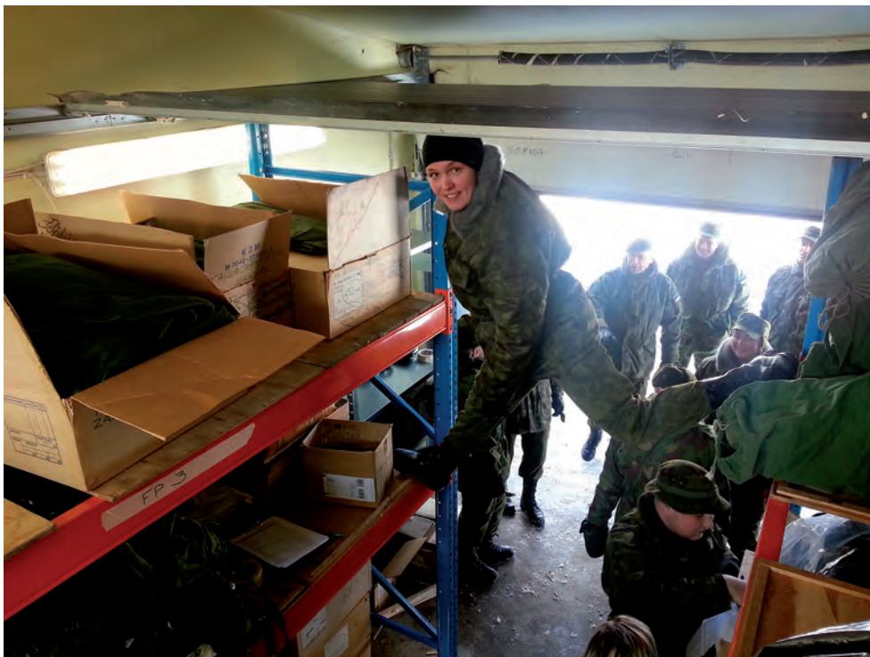
Formeerimise organiseeritud segadus.