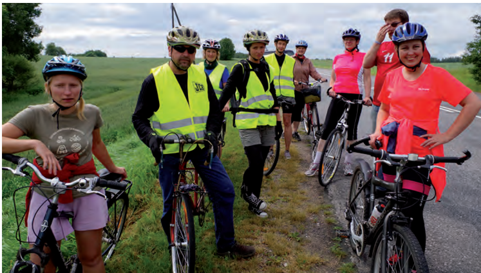
Kuperjanovi rattaretk.

Vähehaaval on ka suureks saanud kodutütred meiega ühinema hakanud, mis teeb ainult rõõmu.