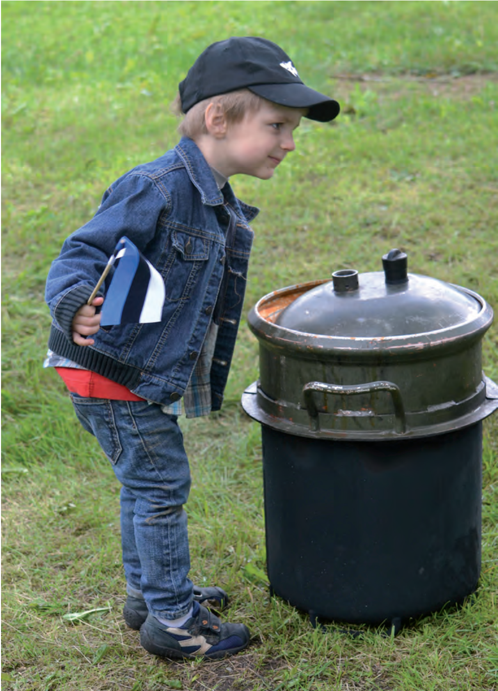
Maakaitsepäev Võhmas 2014.