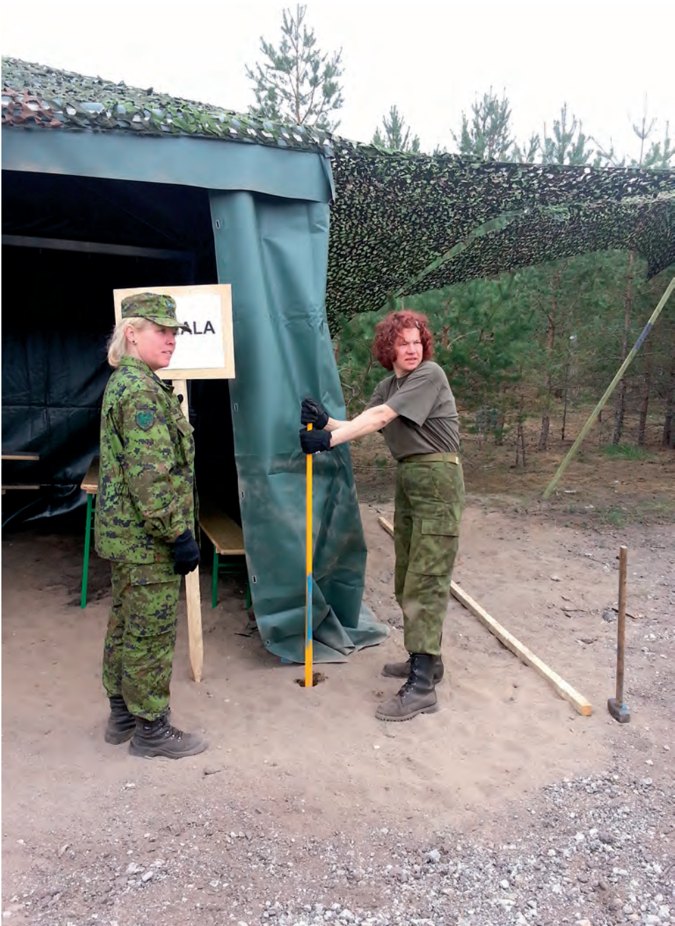
Kevadtorm 2013 vajab meie tugevaid naisi.