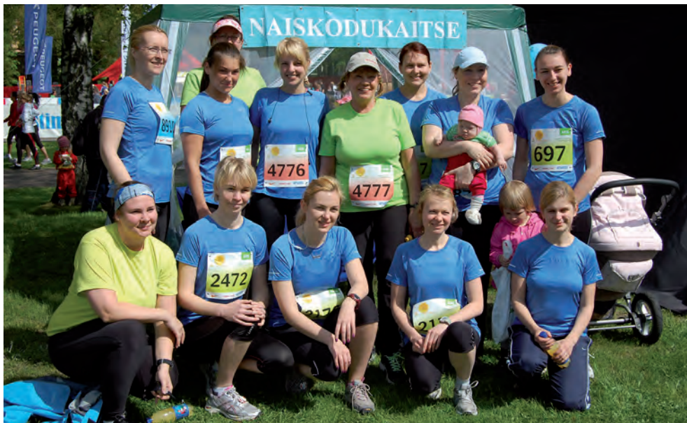
Maijooks. Tallinna ringkonna esindus.

Baasväljaõppe moodulid on õppureid kogu aeg täis, seepärast tuli mõelda võimaluse peale korraldada kõiki mooduleid kaks korda aastas. Oma üritustest olid meelde jäävamad 2013. aasta suvine ja 2014. aasta talvine üleelamislaager. Viimase kohta kirjutatud artikkelgi valiti aasta parimaks. Pakume igal aastal nii enesekaitse- kui ka igapäevaturvalisuse koolitusi. Traditsioonidestki peame lugu: korraldame NKK mälestuspäeva üritusi ning oleme esindatud vabariigi aastapäeva liputseremoonial Toompeal Pika Hermannini torni juures.