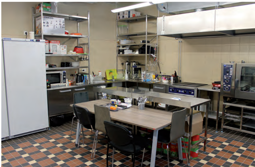
Valga maleva kauaoodatud köök.

Kuna meie ringkonna võistkond saavutas Naiskodukaitse koormusmatkal väga tubli teise koha, oli meil jälle põhjust uhkust tunda. Kui saime teada, et esimese koha