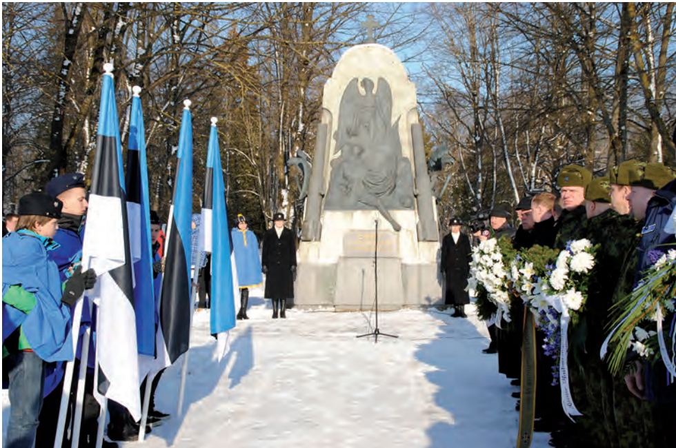
2013. a vabariigi aastapäeval olid Vabadussõjas võidelnute ausamba juures valves naiskodu- kaitsjad ja kodutütred.