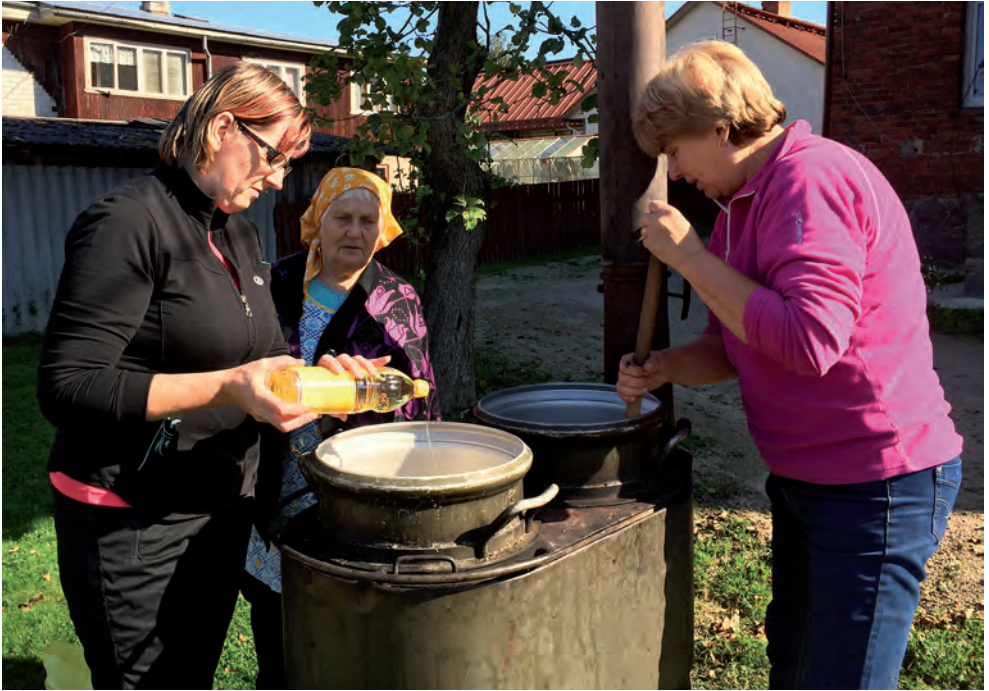
NKK Võrumaa ringkonna Võru jaoskonna naised 2014. aastal borši põhja keetmas puudustkannatavatele peredele.