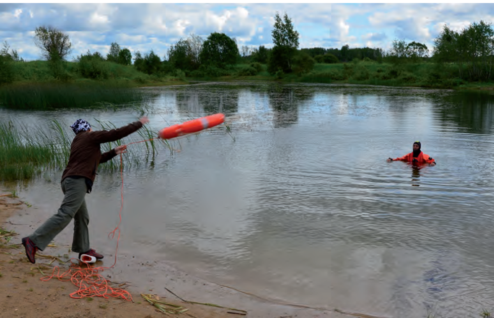
Tule- ja veeohutuspäev Karitsa järve ääres.