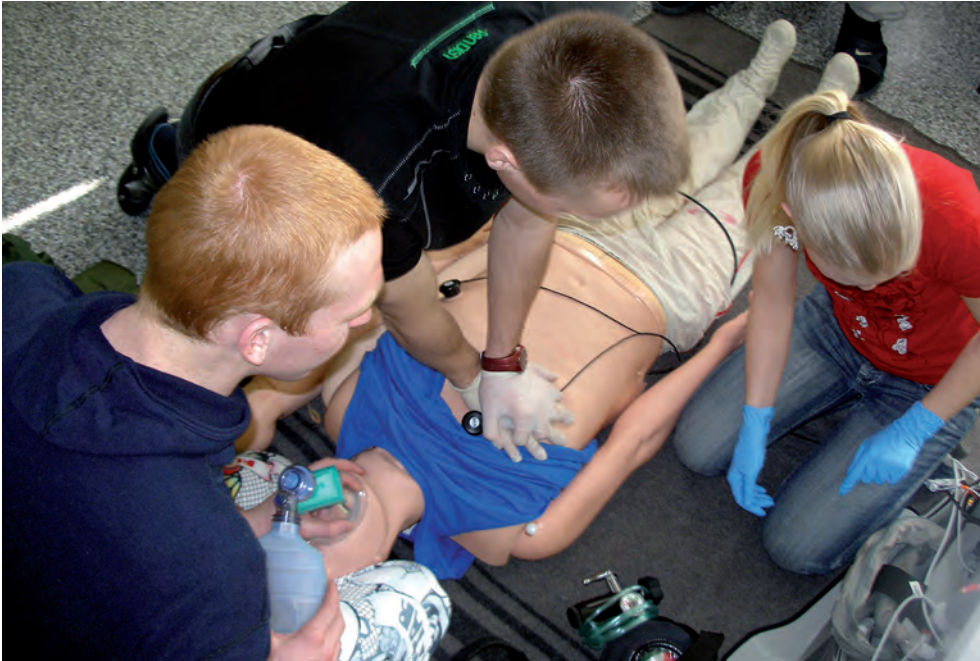
Rühmaparameedikute erialakursus Kaitseliidus 2013.