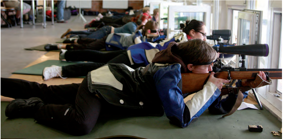
Naiskodukaitse laskevõistlus Pärnus, 2013.