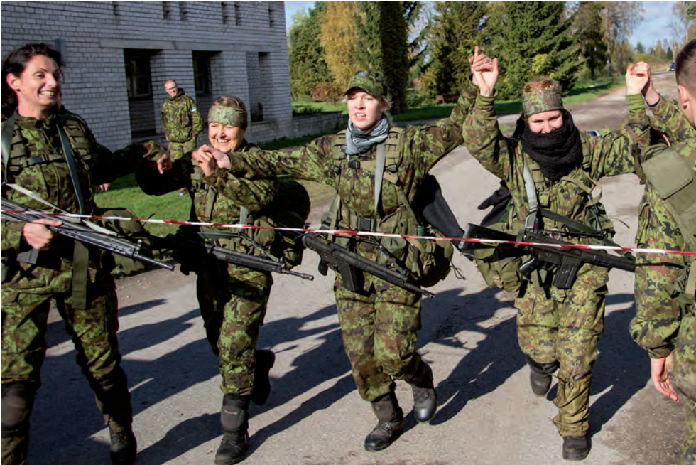
Sookolli finišis hoidsid võistkonna mehed linti, et naised saaksid elegantselt lõpujoone ületada.