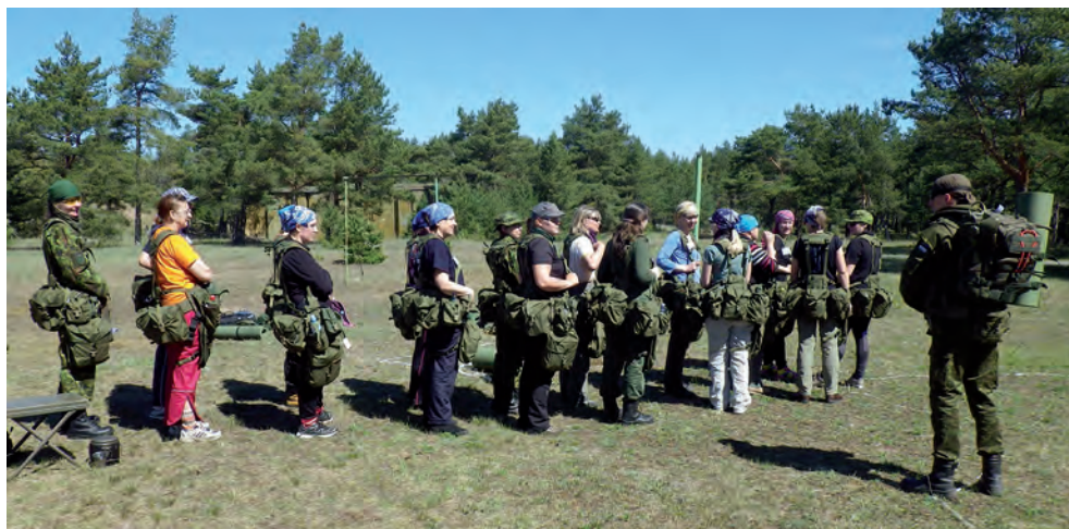
Sõdurioskuste BVÕ-I saadi esimesed kogemused rakmetega.