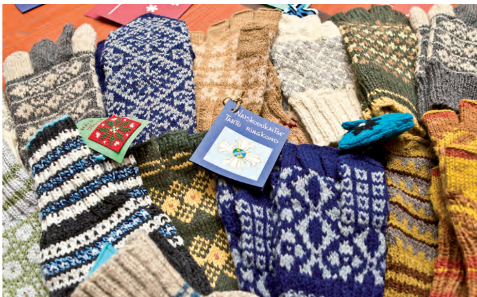
Naiskodukaitse kingitused välismissioonidel teenivatele kaitseväelastele 2013.

2014. aasta kevadel korraldas Eesti Vigastatud Võitlejate Ühing esimest korda