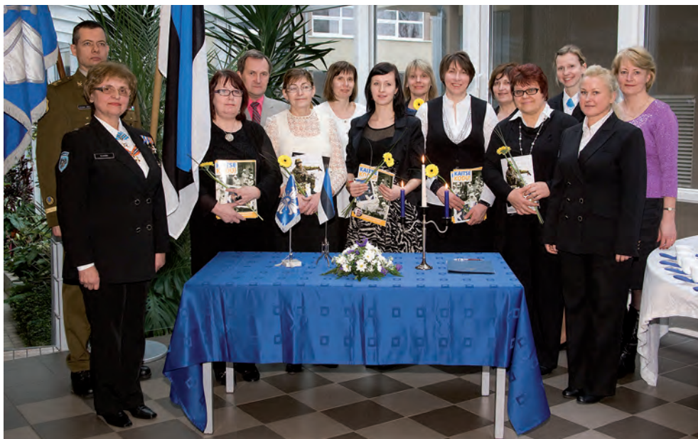
Akadeemilise jaoskonna asutamine.

Vastukaaluks akadeemilise jaoskonna loomisele tähistas 2014. aasta lõikustänu-pühal üks meie vanemaid jaoskondi, Orissaare, oma 15. sünnipäeva. Peokülalised võeti vastu Orissaares Püharisti külalistemajas. Kutsutute hulgas olid teiste jaoskondade