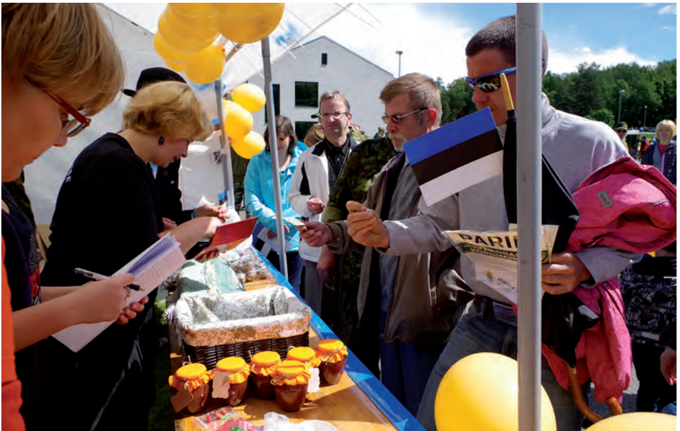
Maakaitsepäeva loterii.