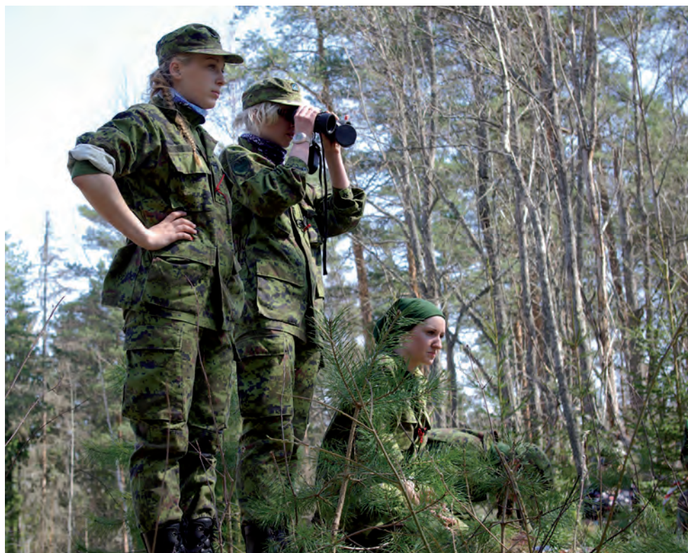
Valga kodutütred NKK koormusmatkal 2013.

Meie ringkonna korraldada oli Naiskodukaitse 2013. aasta koormusmatk. Kuna meie järelkasv tuleb kodutütarde seast, kutsusime osalema ka nende võistkonnad. Tagasiside oli positiivne nii kodutütarde kui ka naiskodukaitsjate puhul. Loodame, et