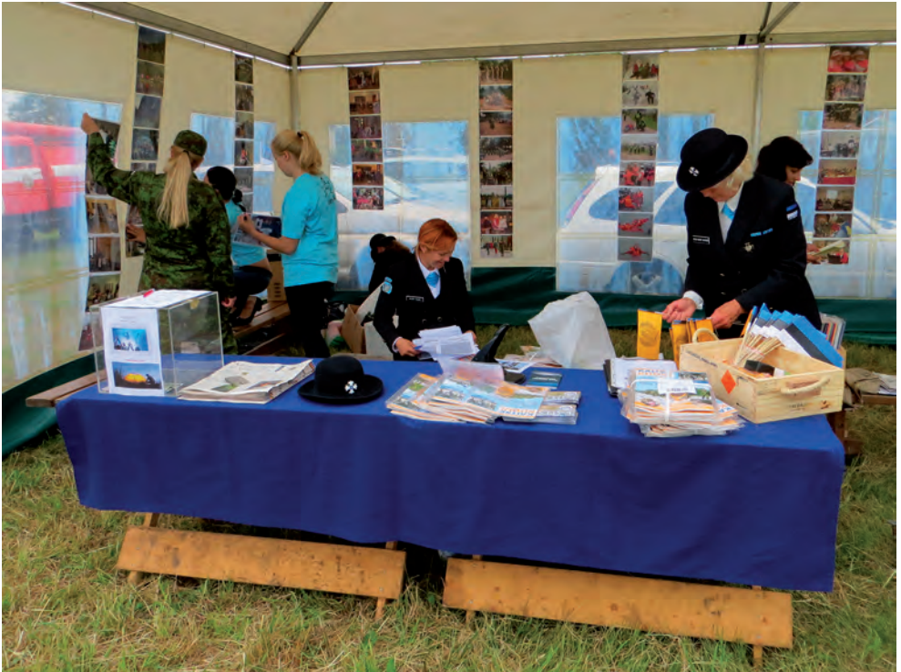
Maakaitsepäeva PR telgi sagimine.