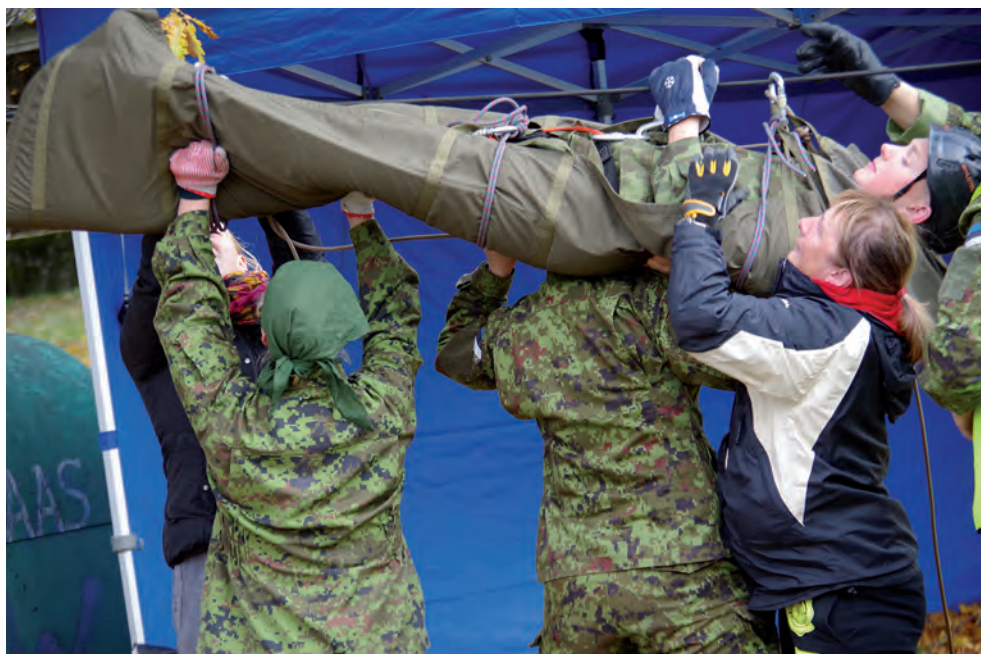
Esmaabi erialavõistlus Vana-Võidus 2014.