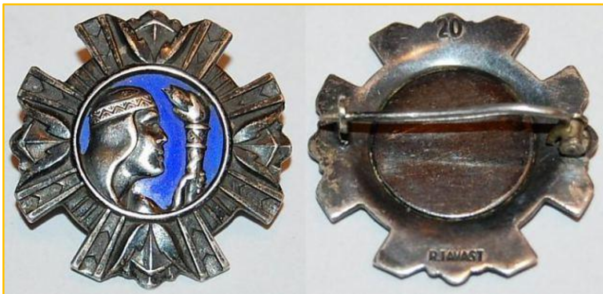
Naiskodukaitse Teenetemärk, asutatud 1935. a.