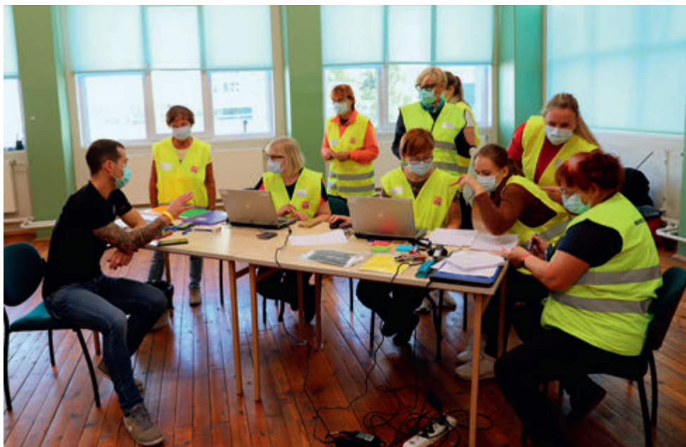
26.-27.09 2020 toimus Kunda spordikeskuses Kaitseliidu Kirde maakaitseringkonna õppuse Põhjakk raames naiskodukaitsjate evakuaatsiooniõppus, kus keskenduti evakuaatsiooni punkti ülesseadmisele, evakueeritavat.

Eesmärgiga anda naistele rohkem võimalusi panustada riigikaitsele ning muuta lihtsamaks asumine SA struktuuri, ka võitlevatesse üksustes, on loodud naiste