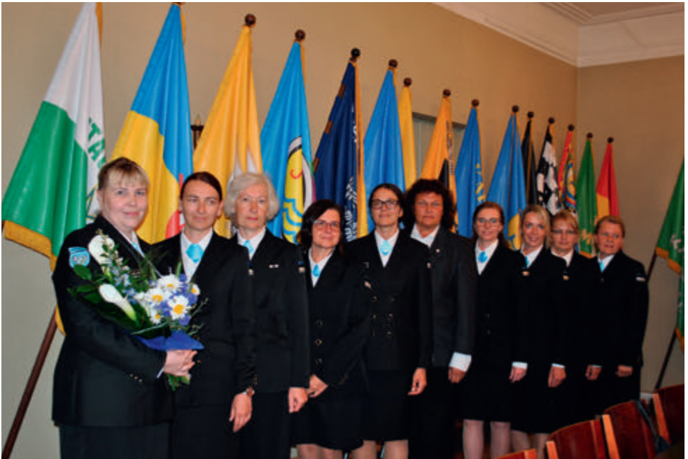
Kalevi jsk asutajaliikmed 30.06.2020.