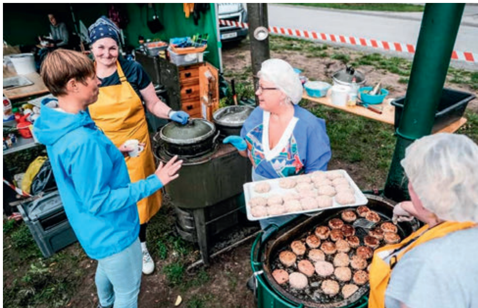
Eesti Vabariigi president ja naiskodukaitsjad kogupereüritusel 30.08.2020 "Pühapäeva piknik Paldiskis" köögis.