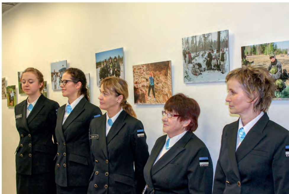
Pildinäituse avamine Kagukeskuses 02.02.2017.