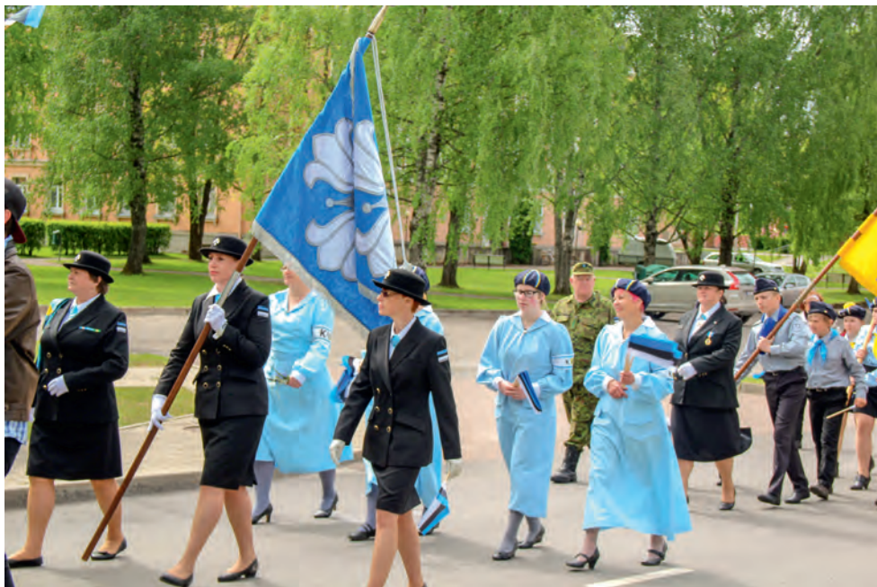
Eesti lipu päeva tähistamine Otepääl 04.06.2017.

šokolaadimedali. Jagamine kestis tunnike, mille jooksul kinkisime kõigi gruppidega kokku üle saja helkuri. Kokkuvõtteks oli lahe ettevõtmine ja edu politseile, kes sellise kampaania algatas.”