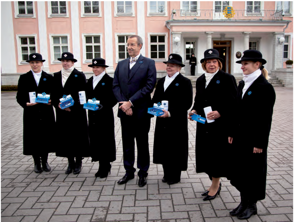
Heategevuskampaania „Anname au!” avalööök 14.04.2014.