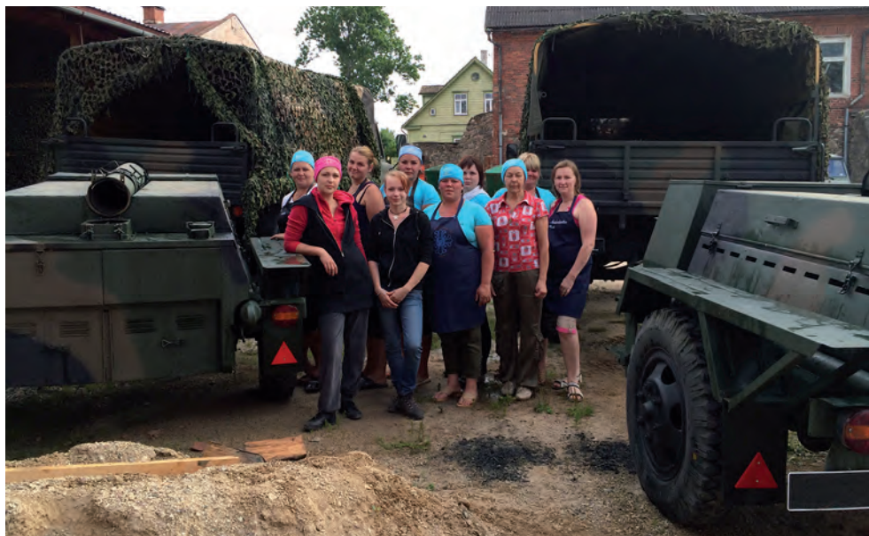
Naiskodukaitsje Võrumaa ringkonna liikmed 12.07.2014 ETK suvepäevade toitlustusel.

Spordigrupp on tegutsenud usinalt. Terviseõhtute sarja korraldamise kõrval on osaletud võistlustel (suusatamine, jooksmine, laskmine, orienteerumine jne). Kohalikul